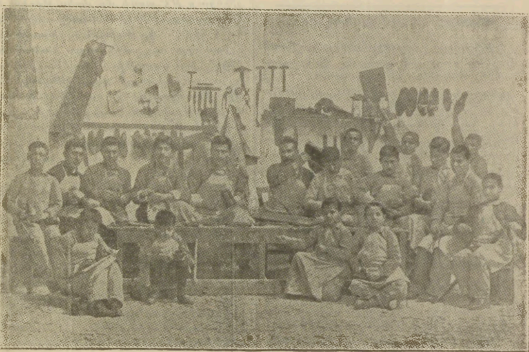
ԿՕՇԿԱԿԱՐ ՀԱՅ ՈՐԲԵՐԸ ԿԻՊՐՈՍԻ ՈՐԲԱՆՈՑԻՆ ՄԷՋ

Եթէ չկայ ժողովուրդի ոյժը, Պատրիարք ու պաշտօնական սող ոյժ չեն ներկայացնէր: Մենք արդար իրաւունք ունինք զայրանալու մեր Պատրիարքին գէ՛մ, խիստ կերպով քննադատելու դանի, երբ նա չի պահպաներ ազգին իրաւունքները, երբ նա կը խնայէ այն ինչ որ ձեռքէն կուզայ, և կընէ այն ինչ որ շահաւոր ու պատուաբեր չէ ազգին: Իսկ անկէ դուրս անկախել, որ Պատրիարք մը բարեկարգութեան յաջող ձեռք բերել, փառաւոր իրատէներով, փոխարէն սուր կիճնայ, դարձեալ արիւն...: