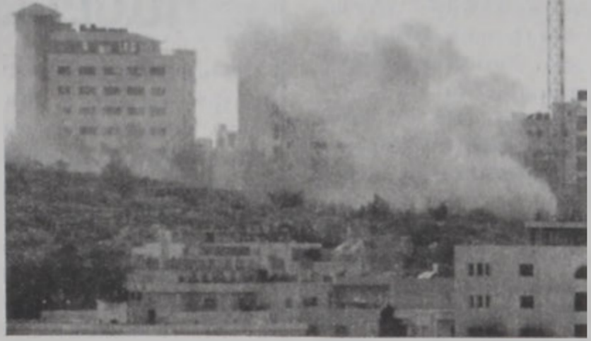
Ռամալլայի մէջ պաղեստինեացի ռմբակոծուած կեդրոններէն մէկը:

Պաղեստինեան շրջաններուն մէջ կացութիւնը վատթարացաւ երէկ եւ բախումներուն վերջ տալու ճիգերն ու փորձերը նոր եւ ուժգին հարուած մը ստացան, երբ պաղեստինցի ցուցարարներ իսրայէլացի երկու պինտոր սպաննեցին Ռամալլայի մէջ, որուն իբրեւ հակադարձութիւն իսրայէլեան օդուժը «Քուրա» ուղղաթիռներով ուժեղացուց Ռամալլայի եւ Կապան պատճառելով մարդկային եւ նիւթական ահաւոր վնասներ: Քանդուած են պաղեստինեան ազգային ռատիոկայանը, պաղեստինեան իշխանութեան նախագահ Եասէր Արաֆատի կեդրոնատեղին, պաղեստինեան ռատիոկայանուն մը եւ տարբեր կեդրոններ, որոնց ընթացքին արձանագրութեամբ է 17 վիրաւոր: Ռամալլայի մնաց խաւարի մէջ, երբ վնասուած է նաեւ քաղաքին էլեկտրակայանը: