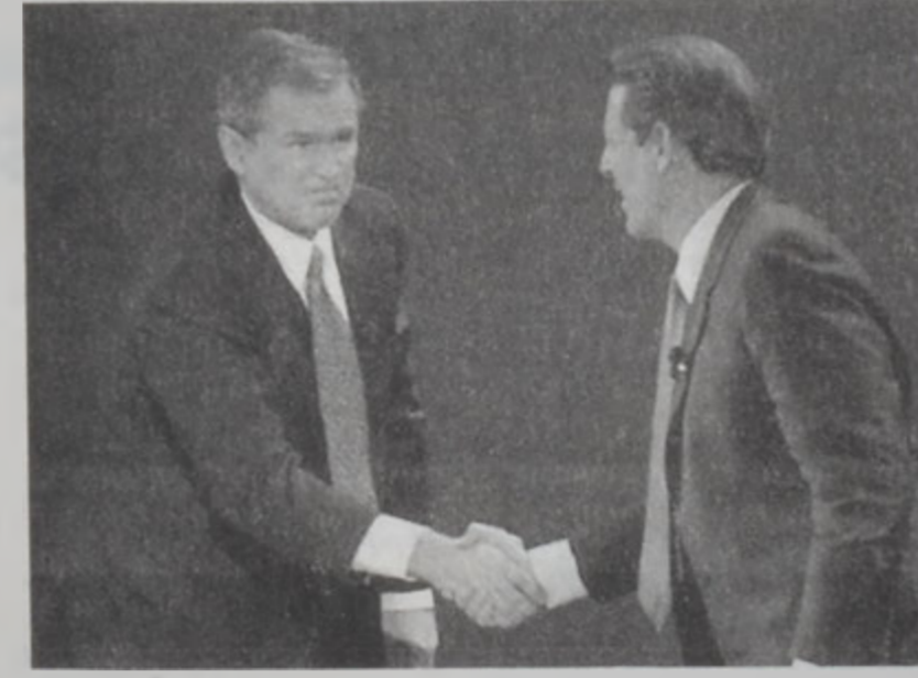
Պուշ եւ Կոր՝ բանավեճի աւարտին:

շատ քարճր էր, նկատի ունենալով, որ արտաքին քաղաքականութիւնը երկրին համար խոցելի մարդ մը կը նկատուէր: Սակայն ան յաջողած է քանակէն «կանգուն» պահել Ռուսիոյ, Հայիթիի, Ռուանտայի, Սոմալիի, Քոլոմպիոյ եւ Միջին Արեւելքի վերաբերող հարցերու մասին: