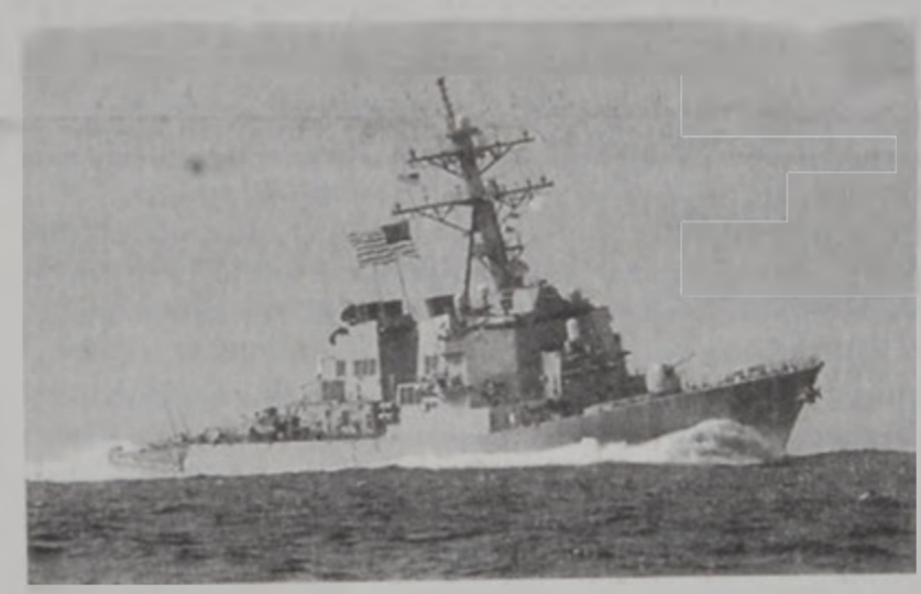
«ԵՆ. Էս. Էս. Զոյ» մարտանաւը: Ըստ, որ մարտանաւուն յայտնած է, որ տեսած է վրայ գտնուող բարձրաստիճան զինուորական մը թէ լաստ մը արագօրէն Ծարը՝ էջ 10

ՏՈՒՊԱՅ, 12 (ՌՈՅ-ԹԸՐԸ).- Ականուած լաստ մը երէկ բարեցաւ ամերիկեան ծովու զորքի 350 զինուոր փոխադրող մէկ մարտանաւուն, որ խարսխած էր Ատէնի (Եմէն) նաւահանգիստին մէջ եւ պիտի ուղղուէր դէպի Պահլէյն: Պայթուած պատճառով է 5 ամերիկացի զոհ, 36 վիրաւոր եւ 12 կորսուած, յայտնեցին ամերիկեան ծովու զորքի պաշտօնատարները: Ամերիկեան ծովու զորքի հինգերորդ նաւատորմին բանբերը՝ Տարըն Փելթը