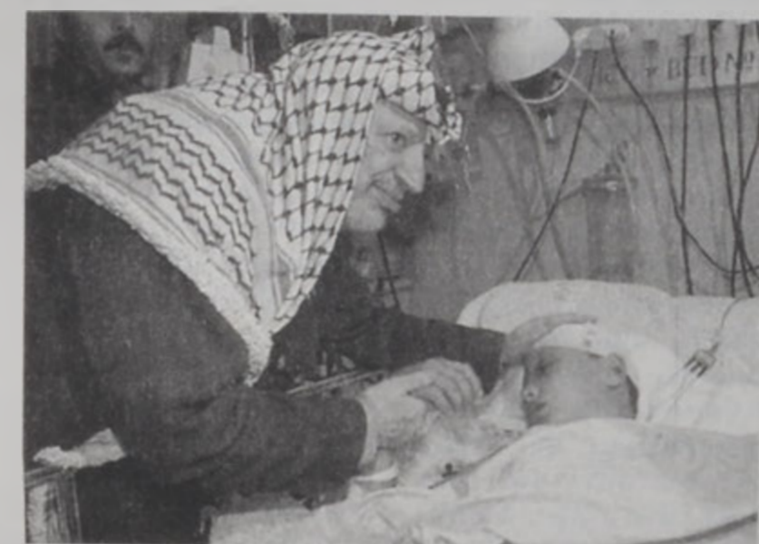
Արաֆատ կ'այցելէ վիրաւոր մահուկի մը՝ Կապանի մէջ հիւանդանոցը, իսրայէլեան ռմբակոծումներէն ետք:

Պաղեստինեան ռատիոկայանները յայտնեց նաեւ, որ յստակ չէ, թէ իսրայէլացի պինտորները ինչու մտած էին Ռամալլայ: