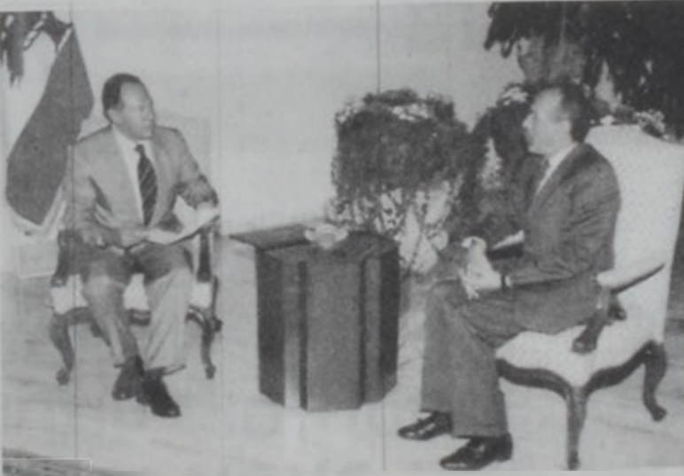
Դեսպան Մարիա Գախազան Լահուտի մօտ

Հանրապետութեան նախագահ Կօր. Էմիլ Լահուտ երկ կրնդուհի Լիբանանի մէջ Լիպիոյ դեսպան Օյի Մահմուտ Մարիան, որ յանձնեց Լիպիոյ դեկավար Մուսամար Քապաֆիէն նամակ մը: