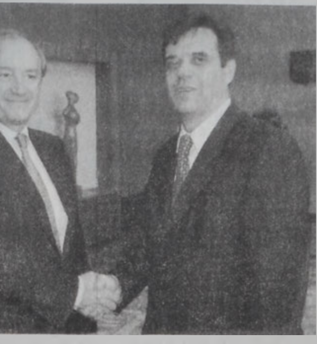
Վետրին եւ Բոշթուցից

Վետրինը նշանակուած է եւ առաջնահերթութեամբ կ'այցելուի: Վետրինը նշանակուած է եւ առաջնահերթութեամբ կ'այցելուի: