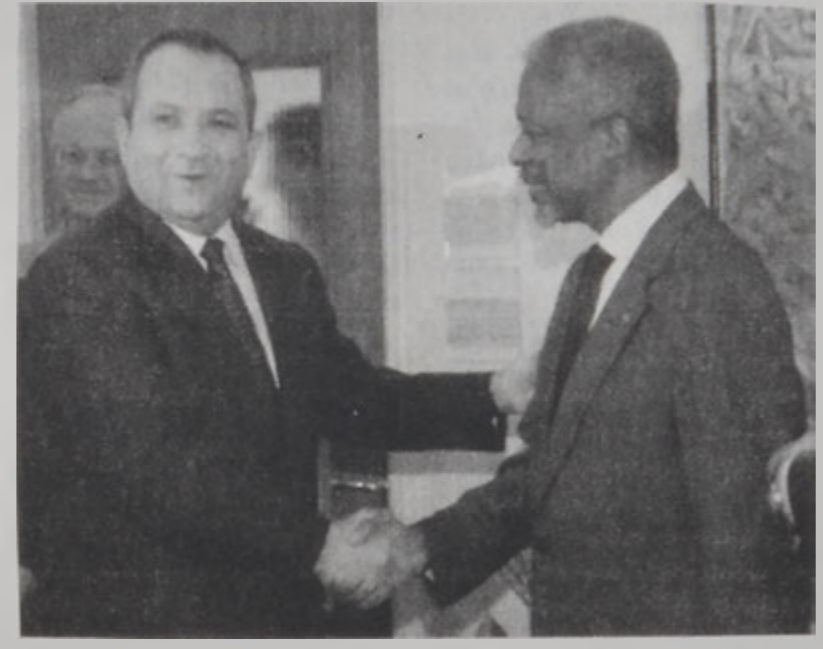
Պարաք եւ Քոֆի Անան

Միացեալ Նահանգներու նախագահ Պիլ Բիլնթըն կ'առաջարկէ վեհաժողով մը հովանաւորել Արաֆաթի եւ Պարաքի միջեւ, Եգիպտոսի Շարմ Էլ Շէյխ քաղաքին մէջ: Սակայն Եգիպտոսի արտաքին գործոց նախարար Ամր Մուսա շեշտեց, որ Շարմ Էլ Շէյխ մէջ վեհաժողով տեղի պիտի չունենայ: Ան ըսաւ, որ կարեւոր է կենսական յաջող իրադարձութիւնը պիտի ըլլայ արաբական վեհաժողովը, որ տեղի պիտի ունենայ այս ամսուան ընթացքին: Բիլնթըն Երկուշաբթի գիշեր հեռաձայնալից հաղորդակցութիւն ունեցած էր իսրայէլացի, պաղեստինցի եւ