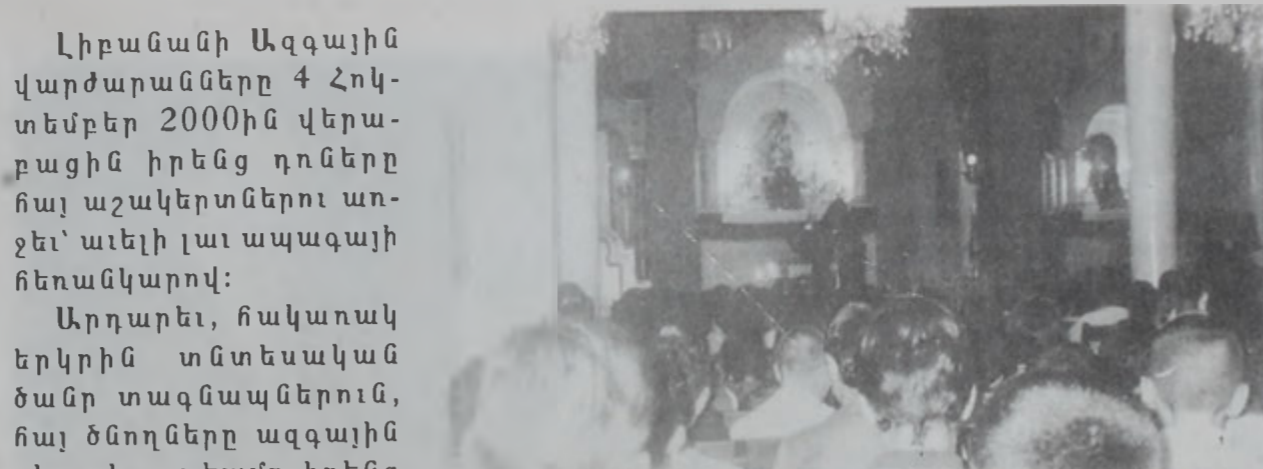
Գեղամ եպս. Խաչերեան աշակերտութեան կը փոխանցէ իր պատգամը: