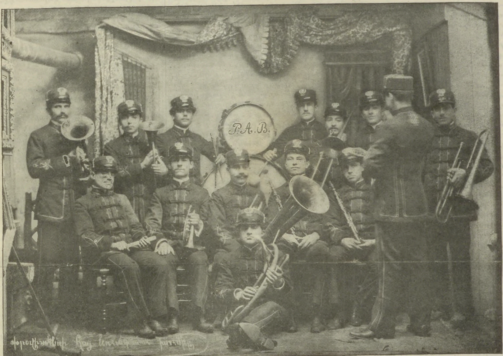
ԲՐՈՎԻՏԷՆՍԻ ՀԱՅ ՆՈՒԱԳԱՍՈՒԱՑ ԽՈՒՄԲ

ՀԱՅԿԱԿԱՆ ՆՈՒԱԳԱՍՈՒԱՑ ԲՐՈՎԻՏԷՆՍԻ ՀԱՅ ՆՈՒԱԳԱՍՈՒԱՑ ԿՈՂ- ՄԱՆԷ