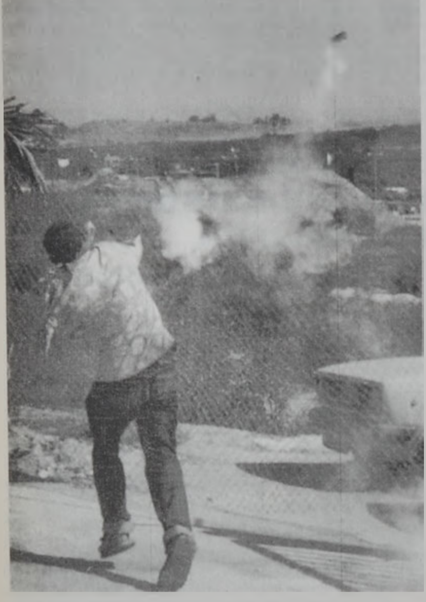
Պաղեստինցի երիտասարդ մը արցունքաբեր ումբը կը վերադարձնէ իսրայելացի գինորներուն:

մածայն, ան սպաննուած կը իրենց բնակիչներու հետ տեղի ունեցած բախումի մը ընթացքին: Երկ կ'մեռնան նաև երկու այլ պաղեստինցիներ, որոնք վիրատուրած կ'են անցեալ շաբաթ: