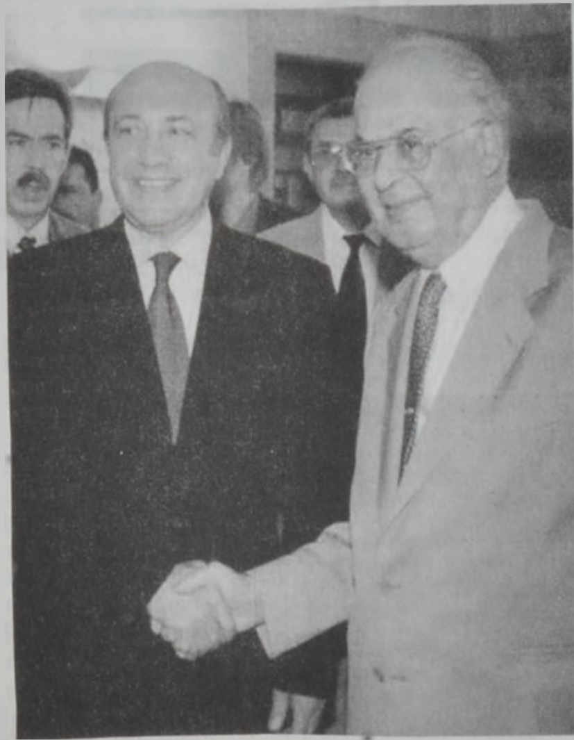
Հըս եւ Իվանով

Ռուսիոյ արտաքին գործոց նախարար Իվոյ Իվանով երէկ յետմիջօրէին Գաւառ-կոստէն Ժամանեց Պէյրուսի օդակայան, ուր կատարած իր յայտարարութեան մէջ ընդգրծեց, որ վայրագութիւնը ոչ մէկ օգուտ ունի: Ան հաւաստեց, որ Մոսկուա պատրաստ է ի գործ դնելու ամէն ճիգ, կացութիւնը հանդարտեցնելու եւ անոյր գահավէժ ընթացքը սանձելու համար: