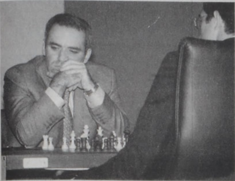
Կերի Գասպարով մրցումի պահուն:

Կիրակի օր Լոնտոնի մեջ սկսաւ ձառարկի Համաշխարհային խորհուրդի աշխարհի ախոյեանութեան տիտղոսին համար վճռական հանդիպումը՝ ուս երկու հսկաներու՝ Կերի Գասպարովի եւ Վլաստիմիր Բրամնիկի միջեւ: Առաջին հանդիպումը ավարտեցաւ հաւասարութեամբ: