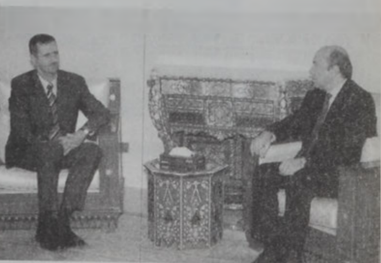
Իվանով ընդունեցաւ նախագահ Ասատի կողմէ:

Ֆրանսայի նախագահ ժաք Շիրաք հեռաձայնային հաղորդակցութիւն մը ունեցաւ Ամանի եւ Եգիպտոսի նախագահ Հիսսի Մուպարաքի հետ, կոչ ուղղելով անոնց, որ պահպանեն Միջին Արեւելքի յարաւորութեան գործընթացը: