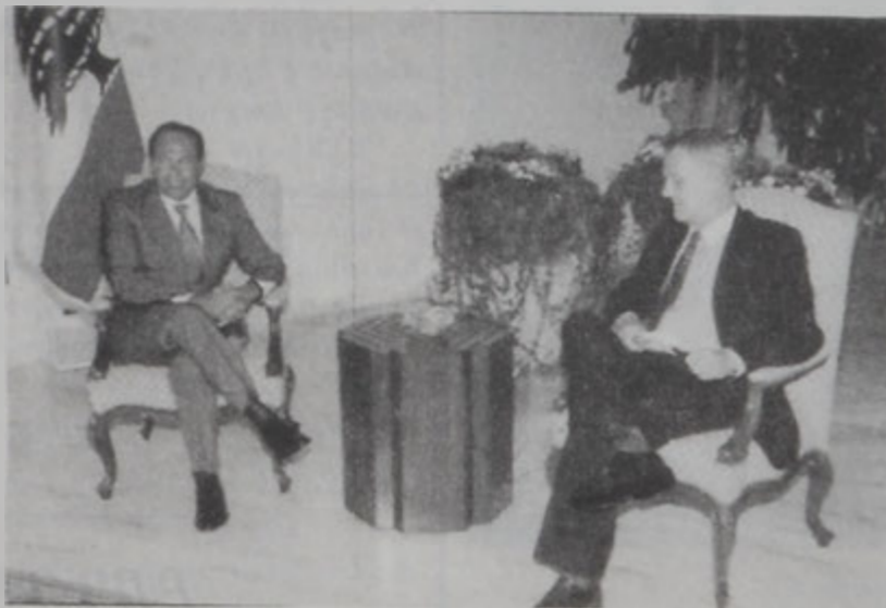
Նախագահ Լահուտ ընդունեց Զնուրընը:

«Ժողովը լաւ էր եւ անոր ընթացքին քննարկեցինք հարաւի իրավիճակը, յատկապէս անցեալ Շաբաթ օր Քիբարու պայտի եւ