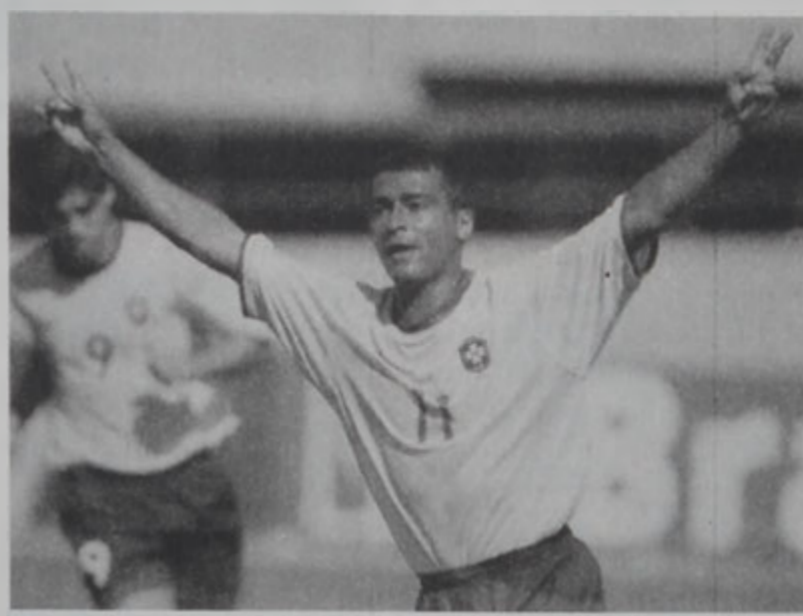
4 կողի հեղինակ Ռոմարիօ:

Հարաւային Ամերիկայի գոտիէն ներս տեղի ունեցող 2002ի Մոնտիալի գտումի 9րդ հանգրուանի մրցումներուն, խմբակին պարագլուխ դիրքը գրաւող Արժանթին արձանագրեց իր 7րդ յաղթանակը, 60 հաւաքար համակիրներու ներկայութեան իր դաշտին վրայ 2 - 1 արդիւնքով պարտութեան մատնելէ ետք Ուրուկուէյը: