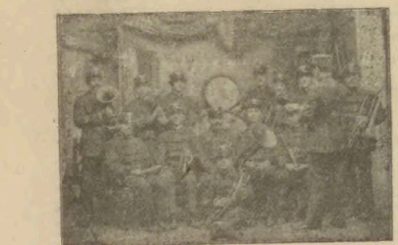
ՀԱՅԿԱԿԱՆ ՆՈՒԱԳԱՀԱՆԴԵՍ ԲՐՈՎԻՏԵՆՍԻ ՀԱՅ ՆՈՒԱԳԱՅՈՒԱՅ ԿՈՂՄԱՆԷ

Նախորդ թուոյն պատերազմական լուրերու վերջին տողը «անուշով», պէտք էր ըլլար «անուն նաւով»: