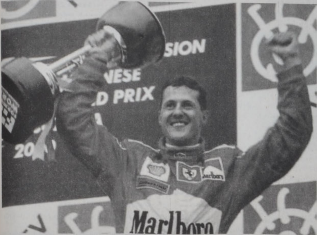
Աշխարհի ախոյեան գերմանացի Միքայել Շումախերը (Ֆեռարի) կը տօնէ իր յաղթանակը:

Գերմանացի վարորդ Միքայել Շումախերը եղաւ առաջին վարորդը, որ 21 տարեան երկար սպասումէ ետք Ֆեռարիի շնորհէց աշխարհի ախոյեանութիւնը. երբ երէկ Ֆորմիլա 1-ի աշխարհի ախոյեանութեան նախաժողովին հանգրուանի կրանփրիին՝ Սուլուրայի մէջ (Ճափոն) հանդիսացաւ առաջինը: Շումախերը իր սպորտային ընթացքին երրորդ անգամ ըլլալով հանդիսացաւ աշխարհի ախոյեան: Նախապէս ան 1994ին եւ 1995ին Պենեթոնի հետ տիրացած էր տիտղոսին: Իր արձանագրած այս յաղթանակէն ետք, այժմ Շումախերը տիրաւորութիւն ունեցաւ վերջին երկու տարիներուն աշխարհի ախոյեան հանդիսացած ֆինլանտացի Միքա Հաքինէնի (Մաքլարըն) վրայ: Նոյնիսկ եթէ վերջին կրանփրիին Հաքինէնը շահի Մալեպիոյ մրցումը, կացութեանն ռիսկը պիտի չփոխուի: Երէկուան կրանփրիին 37րդ լիֆին Շումախերը յաջողեցաւ գերապանցել Հաքինէնը, փիթ սթափի իր արագութեանն օգտուելով: Հաքինէնը հանդիսացաւ երկրորդը, իսկ Մաքլարընի անոր խմբակիցը՝ բրիտանացի Տեյվիտ Քուլթարտը երրորդը: Սուլուրայի կրանփրիին ետք իր կատարած հարցազրոյցին ընթացքին Հաքինէնը ըսաւ, որ թէեւ ներկայումս է ախտաւոր կորսնցնելուն համար, սակայն շնորհաւորեց Շումախերը, թէ քաջակամ դժուար եղանակ մը բոլորեց: Ստորեւ՝ ճափոնի կրանփրիին արդիւնքները.