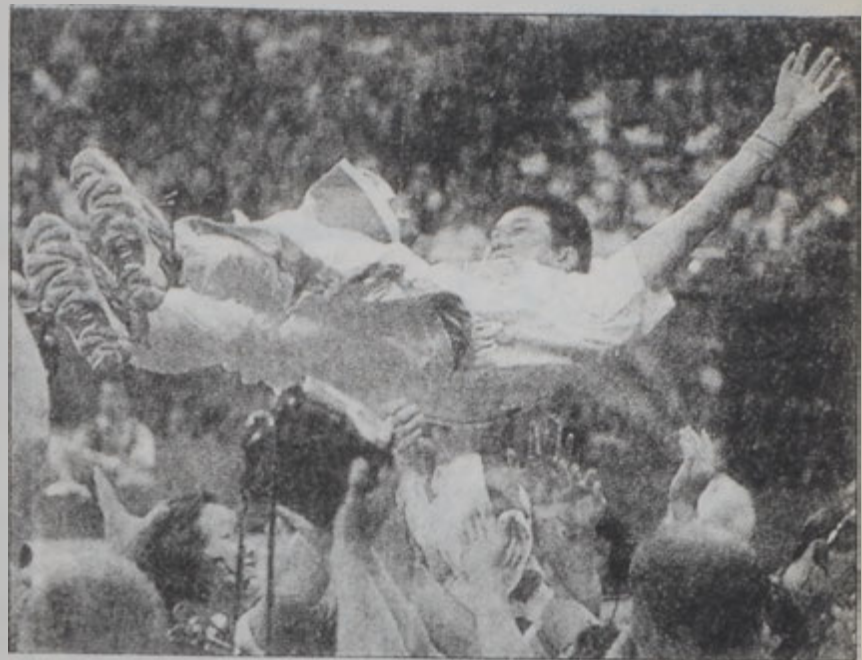
ՉԻՆԱՅԻՆ մարզիկներ օղբ կը բարձրացնեն իրենց մարզիչը, որ իրականացուցած էր յաղթանակի երազ մը:

ԹԵՒ ԱԶԽԱՐԿԻ ՊԱՏԿԵՐԱՓՈԽԻՒԻ ԿԱՅԱՆՆԵՐԸ ԿԸ ՅՈՒՑԱՐԴԵԻՆ ՈՂԻՄՊԻԱԿԱՆ ՆՈՅՆ ԽԱՂԵՐԸ, ՍԱԿԱՅՆ ԱՆՈՆՔ ՅԱԶԱՆ ՏԱՐԲԵՐ ՊԱՏԿԵՐ ՄԸ ԿԸ ՆԵՐՊԱՅԱՑՆԵԻՆ ԱՎԵՂԻՆԵՐՈՒՆ՝ ՇԵՑԵՆԼՈՎ ԱԶԳԱՅԻՆ ՄՃԱԿՈՅԹՆԵՐՈՒ ՌԻՐՈՅՆ ԸԱՅԵՑԱԿԵՏԸ