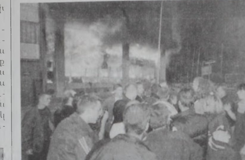
Պետական պատկերասփիւռի կայանին շէնքերէն մէկը՝ բոցերու մէջ:

թիւնը յանձնէ ընդդիմադրութեան թեկնածու Վոյտիւ Բրէկ խոստացան: Միւս կողմէ, ընդդիմադրութեան մէկ աղբիւրը երէկ ըսաւ, որ հանդիպումներու մէջ կը գտնուին բանակին հետ: Ան այլ մանրամասնութիւններ չուրէ: Միւս կողմէ Սերպիոյ Ընկերվարական կուսակցութիւնը հրապարակեալ ձեռագրուած հանրապրութեամբ մը սուր կերպով քննադատեց ընդդիմադրութիւնը երկրին մէջ անկայունութիւն եւ խառնակ վիճակ ստեղծելուն համար եւ ըսաւ, որ այս կացութեան դէմ պիտի պայքարի լոյր միջոցներով: ՍԱՆՏԵՆՆԵՐԸ ԱՏԵԱՆԻՆ ՈՐՈՇՈՒՄԸ