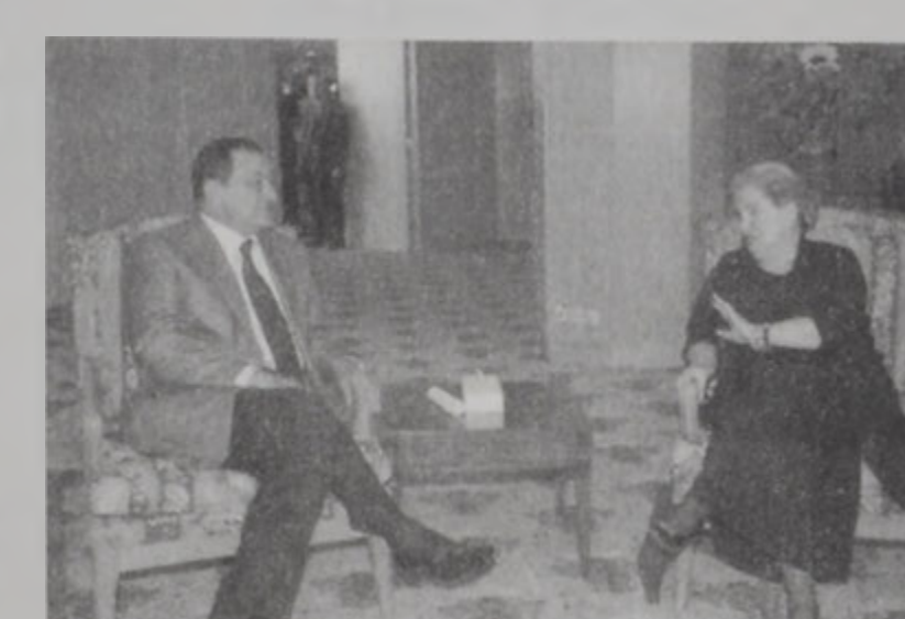
Մուպարաթ - Օլպրայթ հանդիպում

Չինացիները համաձայնագրի մասին տակ, Այսրյորդանանի քաղաքներուն մէջ գտնուող իսրայելեան ուժերը սկսան հեռանալու վերադառնալով իրենց գործառնները: Ականատեսներ յայտնեցին, որ իսրայելեան բանակի հրամարտներն ալ, որոնք պաղեստինեան քաղաքները մտած էին, հեռացան: