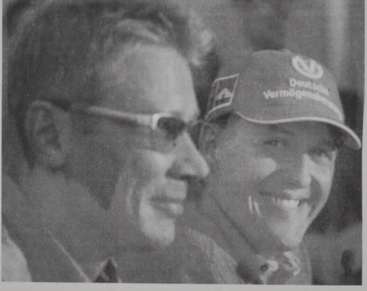
ՀաքիճԷն եւ Շուճի

Ֆորմիւրա ի 2000ի աշխարհի ախոյեանութեան նախափուլերէն հանգրուանը, որ պիտի ըլլայ Սուպերլիգ (Ճափոն) կրան փրին, տեղի պիտի ունենայ յառաջիկայ կիրակի օր, Պէյրութի մասով առաջտեան ուղիով: