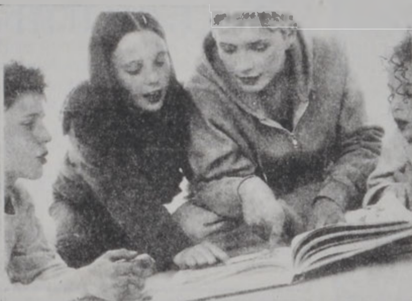
ԽԱՂԱՂ ՊԱՇՏՆԱԿՆԵՐ ԱՍԵՆՈՒՄ

Ահա և ասիկ՝ փորձառու ծնողներէ եւ դաստիարակներէ եկած օգտակար եւ գործնական գիտելիքներ, որ պէտք է վերաբերուի լաւ ձեւով սկսելուն: