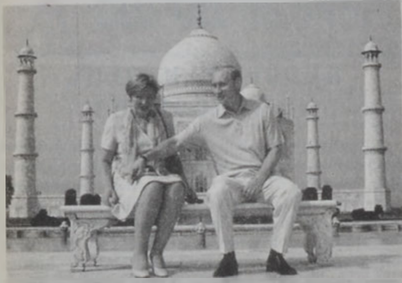
Փութին անմոլ զօտուելով Հնդկաստան գտնուելէն, կ'այցելէ Քամահալ:

ՆԻՒՍ ԵՏԼԻՆ, 4 (ՌՈՅԹԸՐՁ) - Ռուսիա եւ Հնդկաստան Չորեքշաբթի օր կնքեցին համաձայնագիր մը, ըստ որուն Մոսկուա Նի Տեղիի պիտի ծախէ թի-90 Էս. տիպի հրասայեր եւ Մո-30 Էս. Քէ. Այ տիպի ռազմական օդանավեր: Երկու կողմերը նաեւ կնքեցին պիտուրական-թերթի գործակցութեան վերաբերեալ փորձագիշտական: