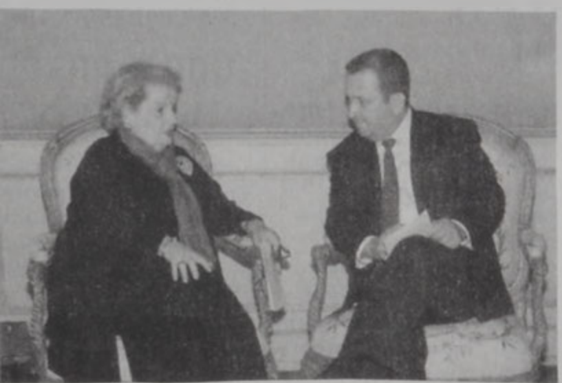
Օլպրայթ եւ Պարաք

Միւս կողմէ, Կապալի եւ այլ շրջաններու մէջ բախումները շարունակուեցան երէկ: Իսրայէլացիք ուղղա-