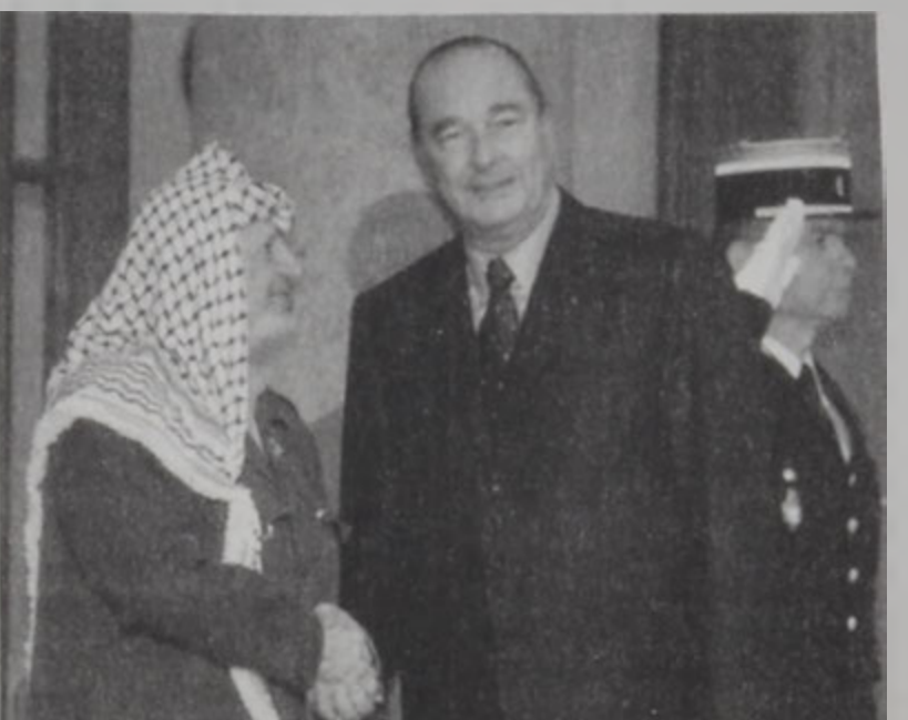
Արաֆաթ Շիրաքի մօտ

թիւներով ոմբակոծեցին քաղաքային շրջաններ. անոնք նաեւ հրասայեր գործածած են: Երէկ զոհ գացած է 9 տարեկան պաղեստինցի մանուկ մը, բախումներուն եօթներորդ օրուան աւարտին գոհերուն թիւը բարձրացնելով 66ի: