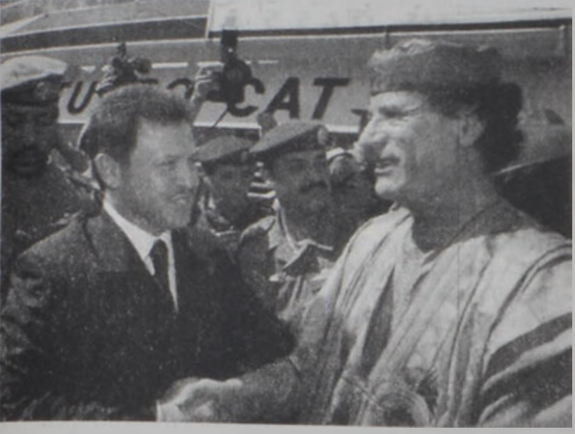
Ապտալա թագաւոր Կընդուճի Զագաֆին

ԱՄՄԱՆ, 4 (ՌՈՅԹԸՐԸ).- Լիպիոյ ղեկավար Մուսամար Քապաֆի Եգիպտոսէն նաւով Յորդանան հասաւ Չորեքշաբթի օր, տեսակցութիւն ունենալու համար Ապտալա Բ. թագաւորին հետ: Քապաֆի, որ ղէպի արաբական երկիրներ շրջապտոյտի մը ձեռնարկած է, աւարտած էր Եգիպտոս այցելութիւնը. ուր տեսակցութիւններ ունեցած էր նախագահ Հիւսնի Մուպարաքի հետ: Քապաֆի կ'ուզէ մեկուսացուի գուրս հանել Լիպիան, որ ուր տարիէ ի վեր հեռու էր Միջին Արեւելոյէն եւ անոր իրադարձութիւններէն: