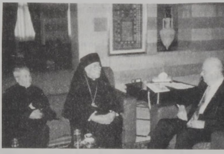
Վարչապետը կ'ընդունի հայր Պուրոս Մուալլէմը

Վարչապետ Սեյիմ Հըր երեկ ընդունեց Նապարէթի եւ Գալիլիոյ յոյն կաթողիկոսներու առաջնորդ Պուրոս Մուալլէմը, որ յայտնեց, թէ քննարկած են Պաղեստինի եւ Լիբանանի իրավիճակը: «Որպէս արաբներ կը ցաւինք այս գրգռութիւններուն, վայրագութեան եւ սպանութիւններուն համար: Այս պագումները յայտնելով կը մաղթենք, որ շրջանին մէջ արդարութեան համար աշխատանք կը շարունակուի» ըսաւ ան կոչ ուղղելով որ «արթնայ աշխարհի խիղճը եւ հոս-հոն ժողովներ գումարելու փոխարէն յուժումներ տրուին»: