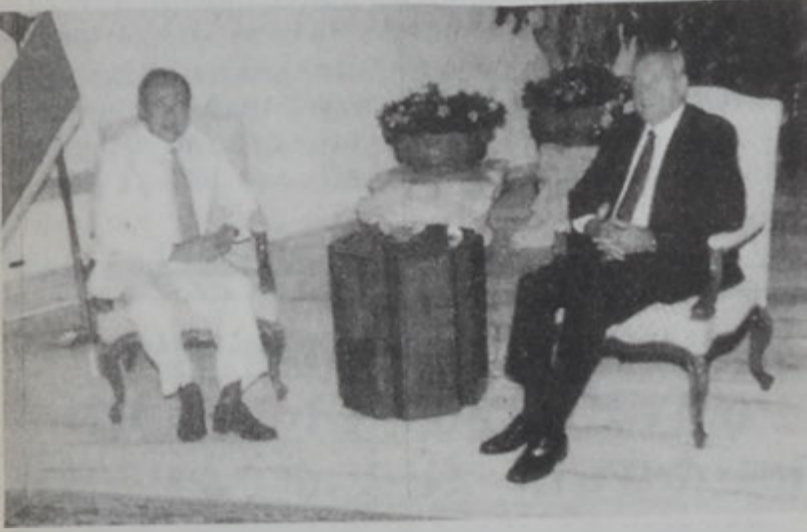
Նախագահը կ'ընդունի Պրրիին

Հանրապետության նախագահ Կոր. Էմիլ Լահուտ երեկ Պապատայի պալատին մէջ ընդունեց խորհրդարանի նախագահ Նեպիի Պրրիին: Անոնք քննարկեցին երկրին վերջին իրադարձութիւնները: