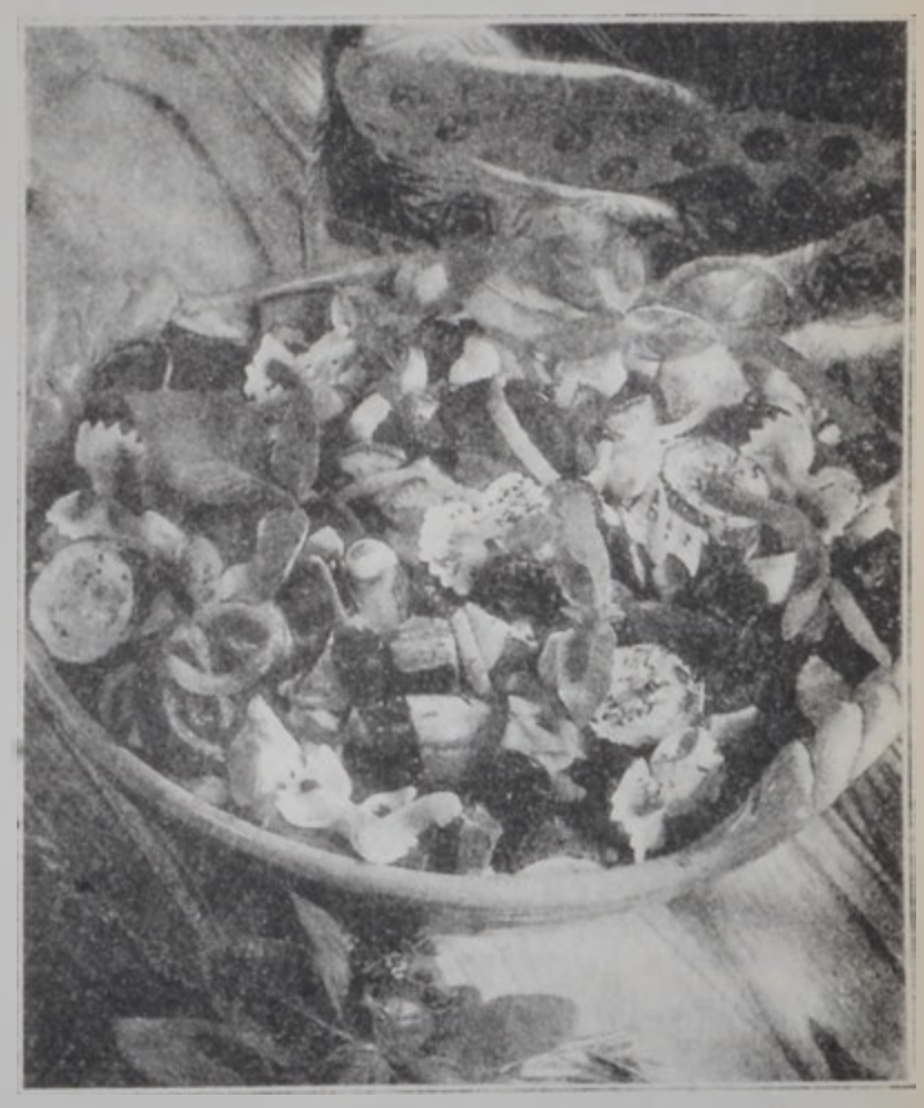
Պատրաստեց ՇՈՒՆԿ ԿՈՒՍՈՒՄԱՐՆԵՐ

Դրամաճը խաչել ուլ տակիւ, այսինքն՝ ոչ շատ, այնքան մը, որ ակոսային տակ չզգոմուի, այլ՝ կոտրի: Ապա պաղ ջուրի տակ բռնել, ցամքեցնել եւ խորունկ ամանի մը մէջ փոխադրել: Ձէթին կէտ դրամաճին վրայ թափել եւ խառնել: Դրամները կլոր շերտել, սմբուկը խորանարդաձեւ կտրուել, իսկ պղպեղը երկար ու բարակ կտրուել ու նախապէս տաքցած ձիթախալին մէջ դարձնել, մինչեւ որ լոյսը կարմրի: Նոյն միջոցին աւելցնել ռեհան բակլան, սխտորի մէկ պճեղ ու կարմիր պղպեղը: Ընդամենը եփել 15 վայրկեան՝ մերթ ընդ մերթ խառնելով. ապա աւելցնել աղը: Կրակին վրայէն հանել, աւելցնել քացախը եւ ձիթապտուղները: Խառնուրդը թափել դրամաճին վրայ, լաւ խառնել, երեսը գարդարել թարմ ռեհանով եւ հրամայել անմիջապէս: Բարի ախորժակ: