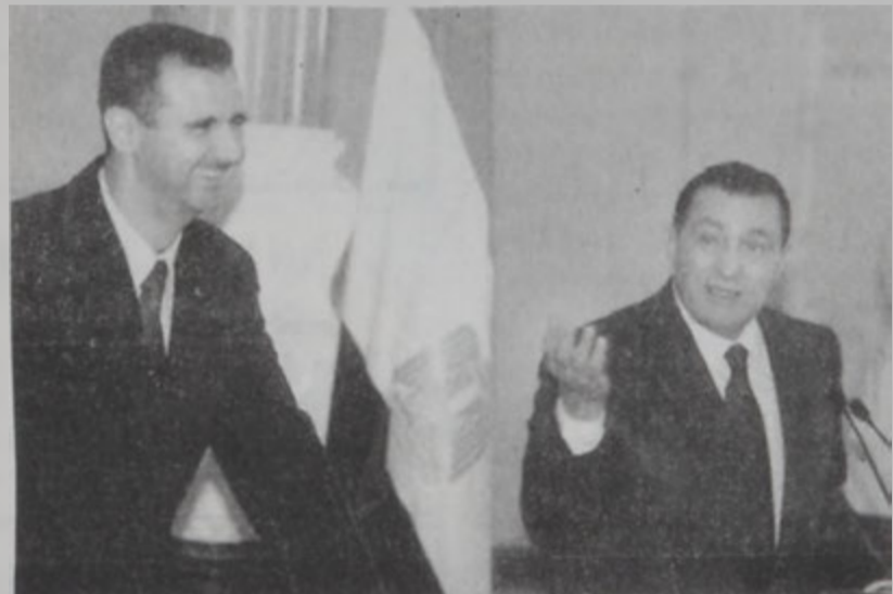
Նախագահներ Ասատ եւ Մուպարաք մամլոյ ասուլիսի ընթացքին:

Սուրիոյ նախագահ Պաշար Ասատ երէկ յայտարարեց, որ Դամասկոս կը հետապնդէ արդար եւ ամբողջական խաղաղութիւն մը, որուն մաս կը կազմեն երեք կողմերու առաջին կողմը՝ Սուրիա-Լիբանանն է, երկրորդ կողմը՝ Իսրայէլն է եւ երրորդ կողմը՝ հովանաւոր երկիրը՝ Միացեալ Նահանգները: