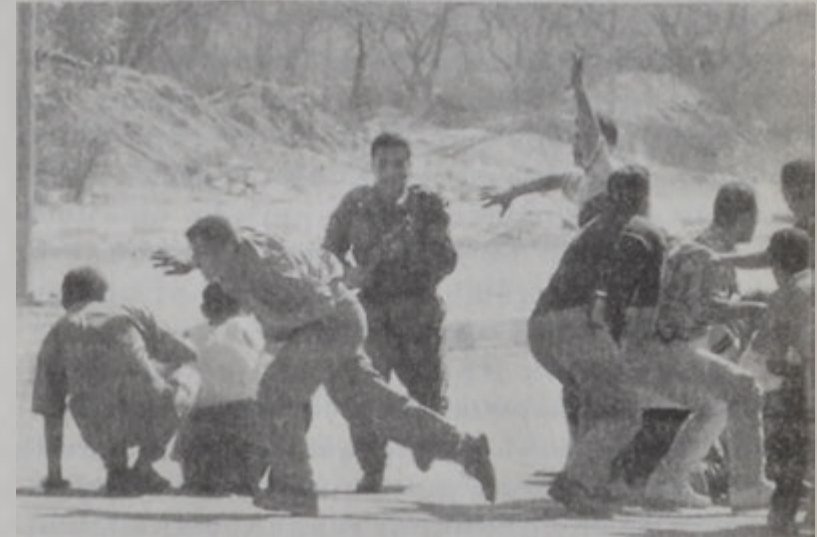
Պաղեստինցիներ կը փորձեն պաշտպանուիլ:

րար կ'ամբաստանեն խոռվութիւնները հրահրելու յանցանքով: Խոռվութիւնները ծայր տուած էին անցեալ Հինգշաբթի օր, երբ Լիքուտ կուսակցութեան ղեկավար Արիէլ Շարոն Արեւելեան Երուսաղէմ այցելեց: Պաղեստինցիները կ'ըսեն, որ Շարոնի այցելութիւնը խոռվութիւնն ու լարուածութիւնն հրահրող արարք էր: