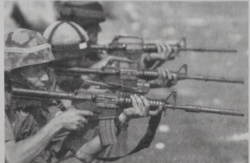
Իսրայէլացի զինուորներ կը կրակեն...

Պաղեստինցիներուն եւ իսրայէլեան ուժերուն միջեւ ծայր տուած բախումները շարունակուեցան երէկ՝ 42-ի բարձրացնելով զոհերուն թիւը: