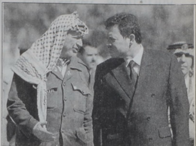
Արաֆատ տեսակցեցաւ Ապտալլա թագաւորին հետ:

Իտալիոյ արտաքին գործոց նախարարը եւս երկ միացաւ Շարունը քննադատողներուն: Լամպերթո Տինի ըսաւ, որ Իսրայէլի մէջ տեղի ունեցող բախումները արդիւնքն են անպատասխանատու եւ անտեղի արարքներու: