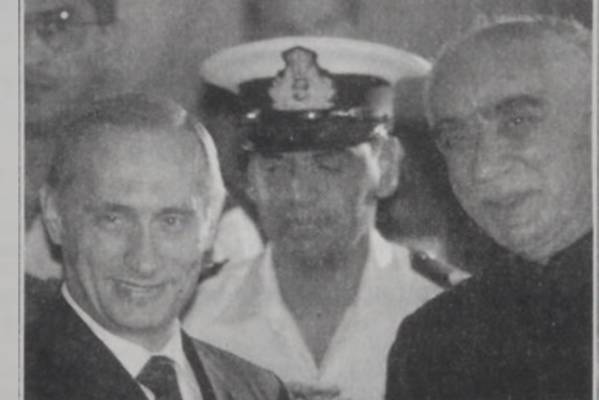
Փուսին կ'ընդունուի Հնդկաստանի արտաքին գործոց նախարարին կողմէ:

ՆԻԻ ՏԵԼԼԻ, 2 (ՌՈՅ- ԹԸՐԸ)։- Ռուսիոյ նա- խագահ վլատիմիր Փուսին Երկուշաբթի գիշեր Հնդկաստան ժամանեց պաշտօնա- կան առաջին այցելու- թեան մը համար: Հնդկաստանի ար- տաքին գործոց նախա- րար եւ բարձրաստի- ճան այլ պաշտօնա- տարներ ընդունած են պայն Տելիիի պիւնտ- րական Փալամ օդա- կայանին մէջ: Կը նախատեսուի, որ այցելութեան ընթաց- քին երկու երկիրները «ռազմա վար կան գործակցութիւն մը»