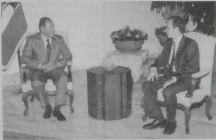
Զօր. Լահուտ կ'ընդունի Աւստրալիոյ դեսպանը:

Նախագահ ԿՕՐ. Էմիլ Լահուտ երէկ դատաւարտեց պաղեստինցի ժողովուրդին դէմ իսրայէլի գործած վայրագ ջարդերը, նկատելի տալով, որ անոնք շարունակութիւնն են 1948-էն սկսեալ անոր գործած ոճիրներուն: