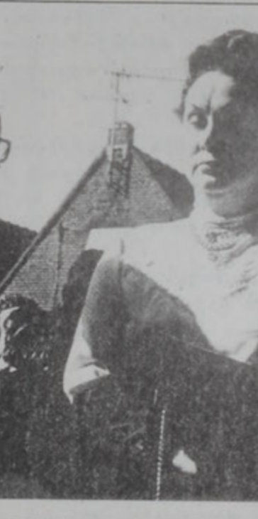
Ժամուրդեր Ուրք աւանի մէկ եկեղեցին առջեւ

Հոլանտա մտնելով՝ Ալ-չենք, որ վրէպեցիները եւ քաղաքներու աղքատ ընա-կիչները մեծ մասամբ բո-ղոքականութեան յարած էին, մինչդեռ ազնուակա-նութիւնը եւ հարուստ առեւտրականներու դա-սակարգը կաթողիկէ մնա-ցած էին: Ընդհանուր առ-մամբ Արթուր, Հենրի, Նա-սար, եւ Լիւքսամպուրկ հնազանդ էին սպանական տիրապետութեան, մինչ-դեռ Ֆրանսիայ, Պրա-պանթ, Հոլանտա եւ Չե-լանտա ընդդիմադիր դիր-քի վրայ կը գտնուէին: Հիւսիս-արեւելեան նա-հանգները, մեծամասնու-թեամբ աղքատ գիւղաբը-նակ շրջաններ, բայց կա-թողիկէ մնացած էին: