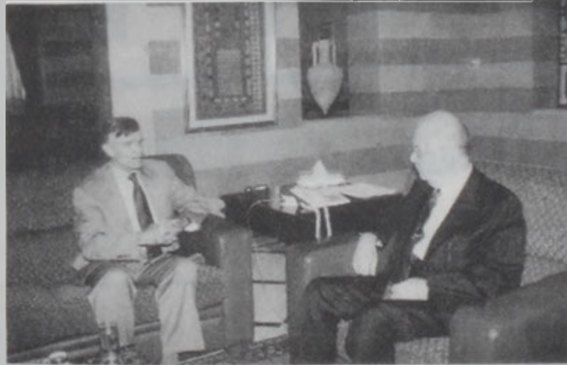
Պէյրութի Ամերիկեան համալսարանի Գախագահը այցելեց Հըսի:

Վարչապետ Սեյիմ Հըսի երկ դիտել տուաւ, որ Այսրորդա- նանի եւ Կապաի դէպ- քերը այնքան վտան- գաւոր են, որ անհրա- ժեշտ է արաբական միացեալ կեցուածքով դիմագրաւել այս վար- գացումները եւ ճշուն մասնագէտներու միջազգային ընտանիքին վրայ, որպէսզի Խորալէի պարտադրէ վերջ դնել այս ջարդին: