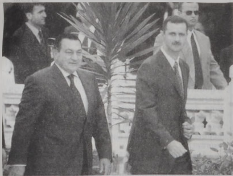
Նախագահներ Մուպարաք եւ Ասատ:

Սուրիոյ նախագահ Պաշչար Ասատ երէկ Գահիրէի մէջ վեհաժողով մը գումարեց Եգիպտոսի նախագահ Հիւսնի Մուպարաքի հետ: