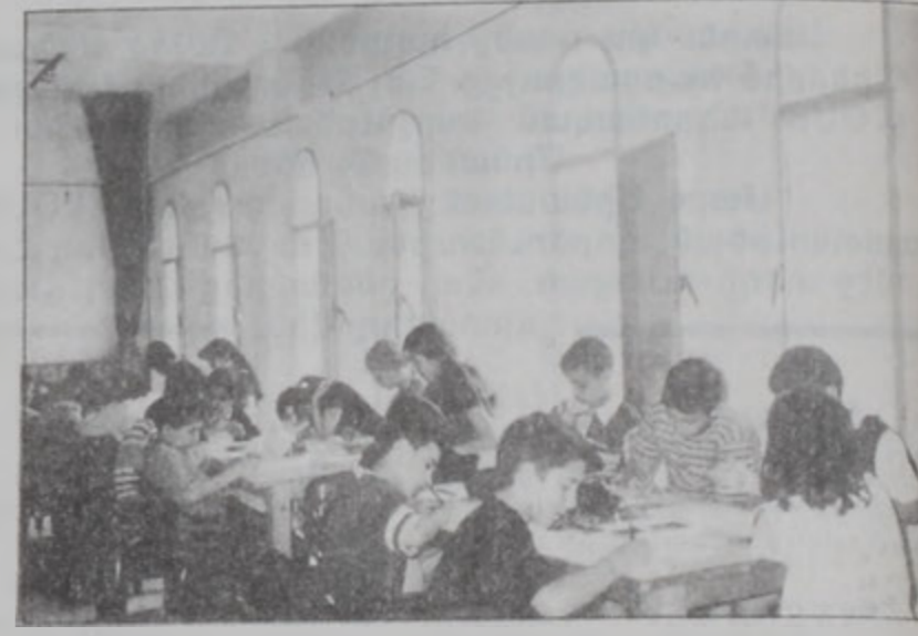
Միջոցառման ցուցահանդես - մրցանքի պատրաստութիւն «Լ. Շանք» կեդրոնին մէջ

Ակադեմիան ունի աշխատանքի երկու դրուժիւն՝ - Ակադեմիական դասընթացքի եւ մասնագիտական դասընթացքի դրուժիւններ: