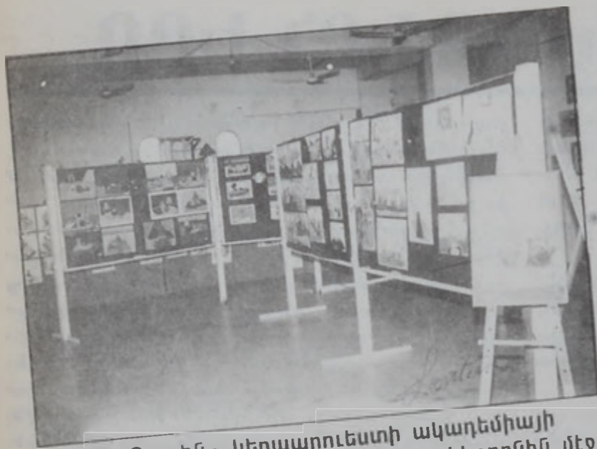
«Թ. Ռոսլին» կերպարուեստի ակադեմիայի տարեկան ցուցահանդես «Լ. Շանք» կեդրոնին մէջ

Պատերազմի դժնդակ պայմաններու մէջ ծրագրուեցաւ եւ ստեղծուեցաւ «Թորոս Ռոսլին» կերպարուեստի ակադեմիան, որ տասներեք տարիներէ ի վեր կը գործէ Համազգայինի «Լեւոն Շանթ» կեդրոնին մէջ (Պուրմէշ Զամուտ):