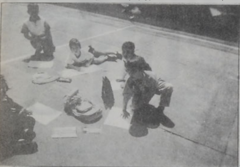
Բացօթեայ աշխատանքի պահուն, Ն. Փալանձեան ճեմարանի բակին մէջ

Այս առումով կրնանք հաստատել, որ «Թորոս Ռոսլին» կերպարուեստի ակադեմիան (հակառակ մասնակի վերլուծութեանը) բեղուն ընթացքի մը մէջ է եւ յաջողութեամբ կը շարունակէ իր սրբազան առաքելութիւնը: