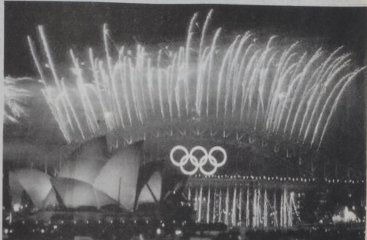
Փակման հանդիսութեանը տեսարան մը:

Հետաքրքրական եղան փակման հանդիսութեան աւարտին պայթուցիկներուն պարպած գեղեցկութիւնները, մասնաւորը որ ծախքը գնահատուեցաւ... 1,7 միլիոն տոլարով: