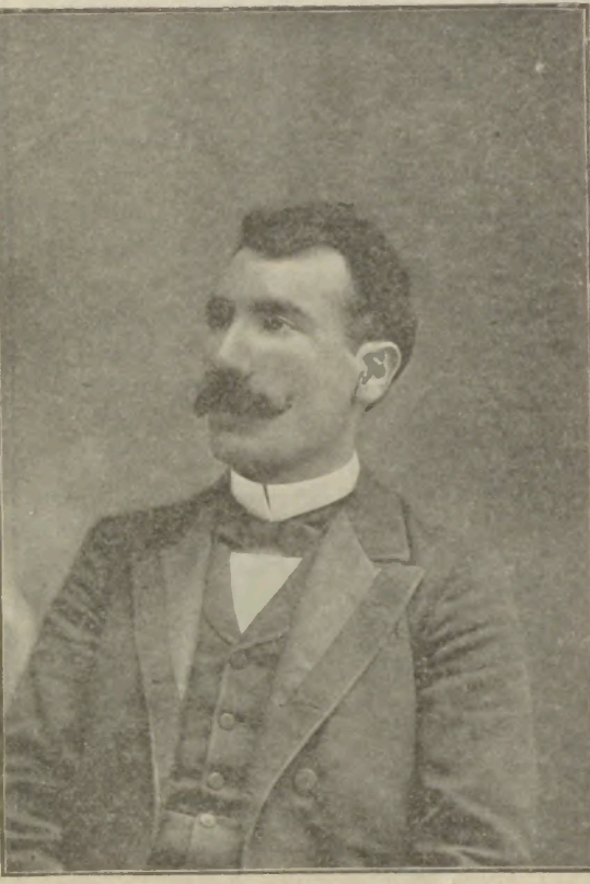
(Կարապետ Մարգարէի կէսնկան) ՆՈՐԱՊՈՎԻ ԱՐժ. ՏԵՐ ՂԵՎՈՆԴ ԱՐԵՂԱՅ ՕՐՄԱՆ ՀԱՆԴԷՍ ՈՒՍՏՐԻ Ս. ՓՐԿԻՉ ԵԿԵՂԵՑԻՈՅ ՄԷՋ (Մեր Յատուկ Թղթակցէն)

Նախորդ թուի երկրորդ երես, երկրորդ սիւնակ 34րդ տող՝ Օրուան կեանքը յօդուածի մէջ «գրգռիչ» բառը պիտի ըլլայ «գրաւիչ»: