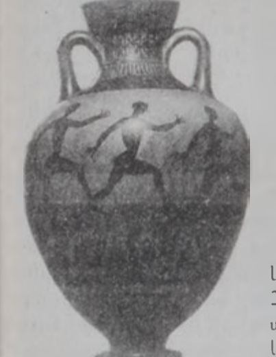
Մարմնամարզի ծեսեր հին Յունաստանի մէջ:

ՄԱՐԶԱԽԱՂԵՐՈՒ ՆԿԱՏԱՍԲ ՄԱՐԳԱՊԻԹԵԱՆ ՍԵՐԸ ԻՐ ԱՐՏԱՅԱՅՏՈՒԹԻՒՆԸ ԳՏԱԾ Է ԻՐԱՔԱՆՉՈՒՐ ԸԱԻՔԱԿԱՆՈՒԹՅԱՆ ԵՒ ԻՐԱՔԱՆՉՈՒՐ ԺԱՄԱՆԱԿԻ ՍԷՋ: ԻՆՉԸ ԿԸ ՄԴԷ ՄԱՐԳԸ ՄԱՐԶԱԽԱՂԻ