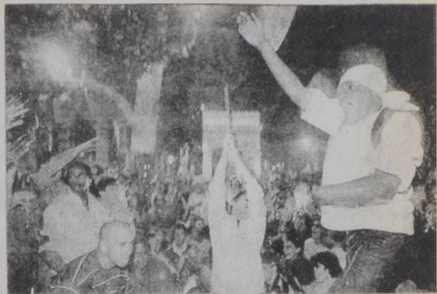
Ֆրանսայի ֆուտբոլի ազգային խումբին երկրպագուները կը տօնեն «Եւրո-2000»-ի մրցաշարքին իրենց յաղթանակը:

Եւրոպայի համալսարանին կողմէ կատարուած այլ ուսումնասիրութիւն մը ցոյց կու տայ, թէ պատեթիկ համալսարանական երկրպագուներ, որոնք հարցախոյզի մը պատասխանելով ինքնարժեքներու միջոց տուած են,