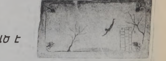
Յոյն մարզիկ մը կը սուզուի դէպի անդեմական - Ն. Զ. Տրոյ դարու դարձարանի մը որմնակարգ:

րեն մարգախաղի արժեքները ըմբռնողութիւն մը: 35 տարի առաջ պատմաբան մը ըսած է, թէ իրադարձութիւններով յատկանշուած այս աշխարհին մէջ միակ իրական բաները յիստի մնացն են իրենց ու մարգախաղերը: Ներկայիս մանուկներ պատկերով մարգիկները կը հետեւին միլիոնաւոր մարգիկներու խաղին: Մարգախաղերը կ'օգտագործուին զանազան արտագրութիւններ վաճառելու կամ քաղաքներու որոշ դիմապատկերներու փայլաւոր համար: Ճիշդ է, որ մարգախաղերը տիեզերական են, սակայն յատուկ մարգախաղի մը ընտանիքները շատ բան կ'ըսէ մեր մասին: Երբ մարգախաղի հաստատուեցան Նիւ Ինկլենտի գիւղերուն մէջ, անոնք պէշտպարէն ֆուտբոլի մրցաշարքեր հաստատուեցան: Նիւ Ինկլենտի գիւղերուն մէջ, ցանկ պէշտպարէն ֆուտբոլի մրցաշարքեր հաստատուեցան: Միւս կողմէ, Չարլզ Ա. ի հետեւորդները վերճիւրի մէջ հապտատուելով նախապատուութիւն տուած են ամէն տեսակ արիւնալի մարգախաղերու: Ազնուական դասակարգի