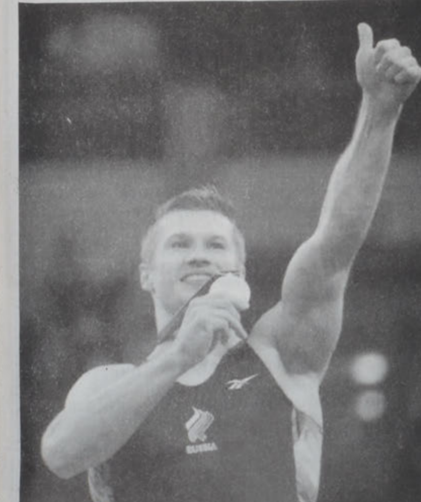
Մարմնամարզիկ ռուս Ալեքսէյ Նեմով ուրախ՝ իր շահած ոսկի մետալով: