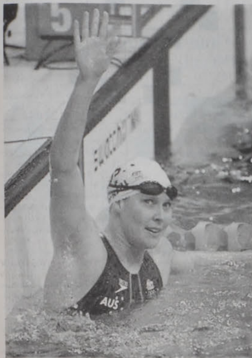
Աստրալիացի Սուզի Օ'Նիլ, 200 մետր ազատ լողի աղջկանց ոսկի մետալակիր: