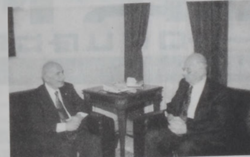
Հիւսէյնի Հըսի մօտ:

Խորհրդարանի նախագահ Հիւսէյնի Հիւսէյնի երկէ այցելեց վարչապետ Սեպիլ Հըսի տպա յայտարարեց, որ հանդիպումին ընթացքին չէ արժարժուած յաջորդ կառավարութեան կազմութեան հարցը. եւ տակաւին կանուխ է յաջորդ վարչապետին անունը առաջարկելու համար: