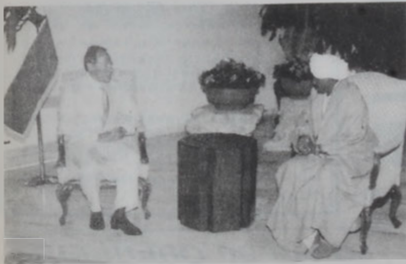
Սուտանի Գախազահին խորհրդակցանք գոր. Լահուտի կ'այցելել:

Նախագահ Գոր. Էմիլ Լահուտ երկրորդ անգամ հանրագումար աշխատանքներու եւ փոխադրամիջոցներու նախարար Նախագահ Սիբախին, որ նախագահին ներկայացուց երկու նախարարութիւններու իր օրով իրագործումներուն մասին զիջք մը: