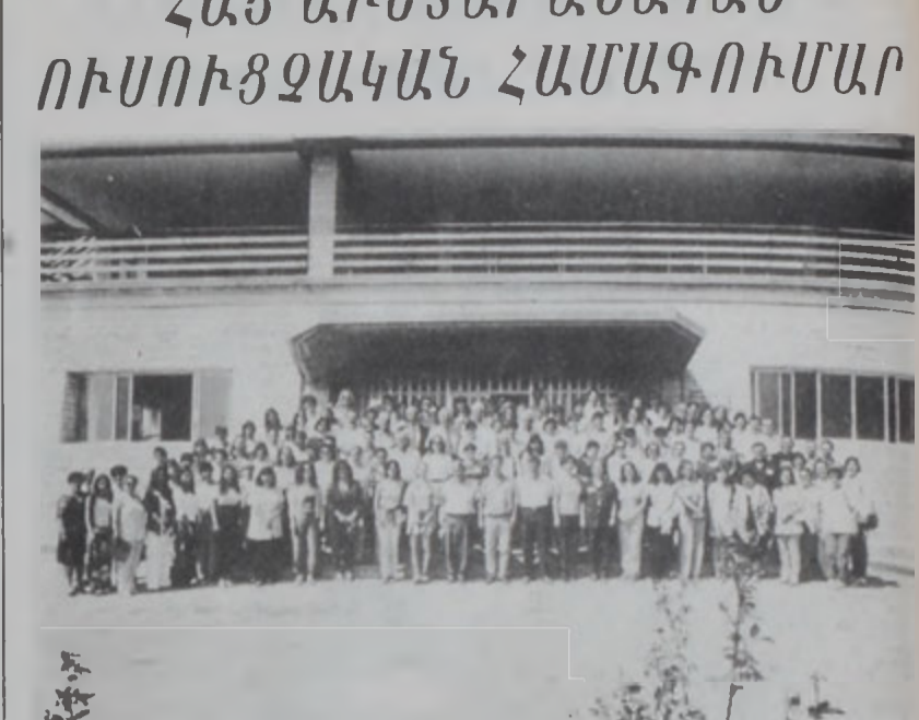
Համագումարին մասնակցած ուսուցիչներու խմբանկար

Նկատի ունենալով այս երեւոյթը, ինչպէս նաեւ՝ դրամի յուսացման դէմ համագործակցութեան անհրաժեշտութիւնը, Հայաստանի Ազգային Ժողովը վերջերս վաւերացուց 10 Յունիս 1999ին Հայաստանի, Վրաստանի, Իրանի եւ «Եւր. Տի. Սի. Փի» միջեւ ստորագրուած համագործակցութեան յուշագիրը: