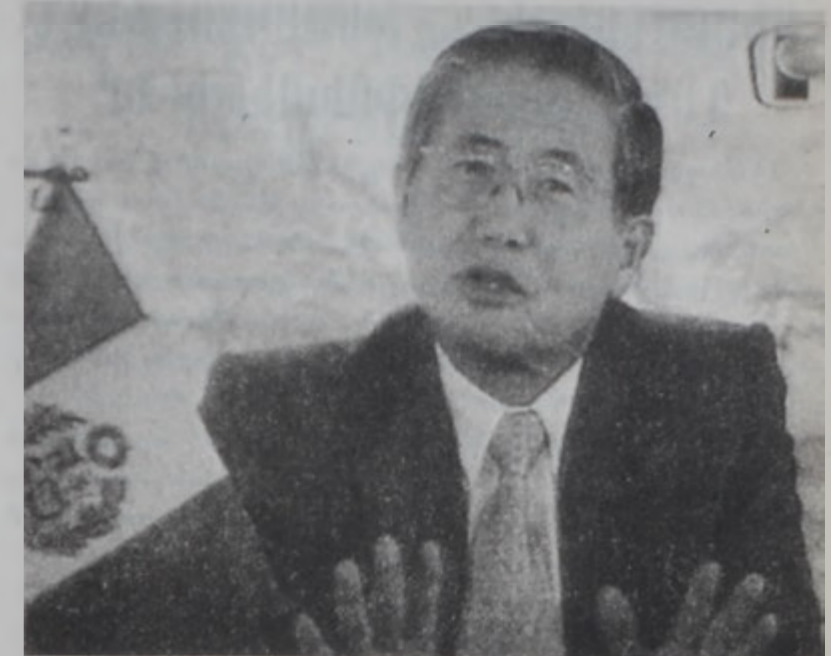
Փերուի նախագահ Ալպերթո Ֆուճիմորի:

ԼԻՄԱ, 17 (ՌՈՅԹԸԸ) - Շատ մեծ անակնկալի մը դիմաց գտնուող Փերու Կիրակի օր փորձեց «մարտել» նախագահ Ալպերթո Ֆուճիմորի այն յայտարարութիւնը, թէ պիտի կայացնէ նոր ընտրութիւններ, որոնց իր թեկնածուութիւնը պիտի չդնէ: