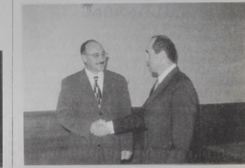
Արկադի Ղուկասեան կ'ընդունի Քոչարեանը:

Հայաստանի նախագահ Ռոպէրթ Քոչարեան Չորեքշաբթի օր Լեռնային Ղարաբաղ այցելութեան շրջագիծին մէջ այցելեց Մարտունիի շրջան, ուր հանդիպում ունեցաւ շրջանի ղեկավարութեան հետ: