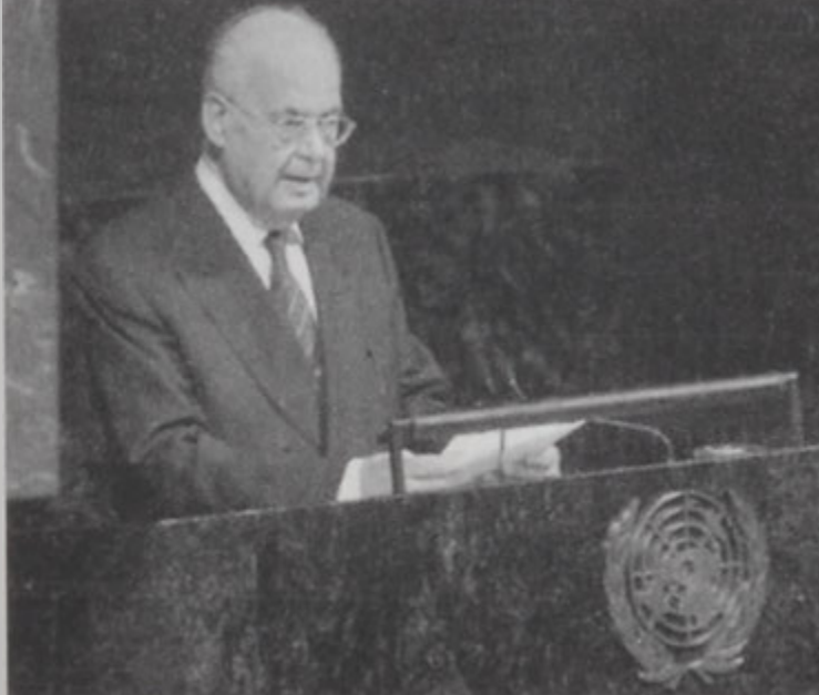
Վարչապետ Հըս խօսքի պահուն:

Վարչապետ Սեյիմ Հըս Երէկ երեկոյեան Նիւ Եորքի մէջ ՄԱԿի 55րդ Ընդհանուր Ժողովին արտասանեց Լիբանանի խօսքը: