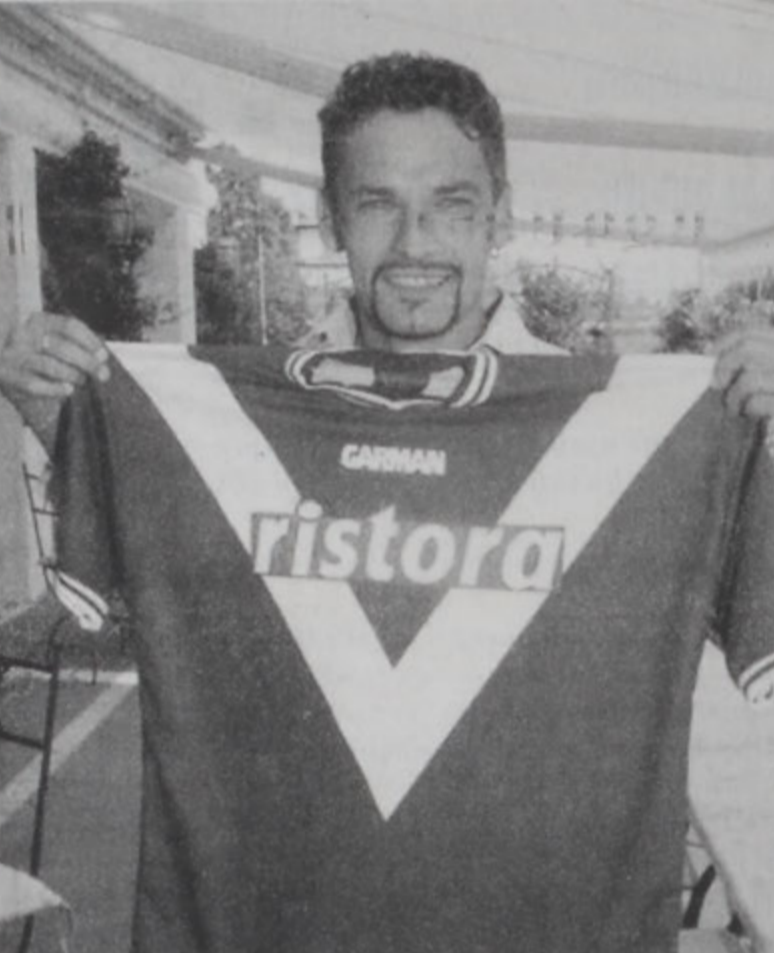
Ռոպերթո Պաճիօ, իր նոր կազմին՝ Պրեշիայի շապիկով:

Իտալացի յաւաքողական Ռոպերթո Պաճիօ երկէ միացաւ նոր Ա - դասակարգ բարձրացած Պրեշիայի, երկու տարուան պայմանագրութիւն մը ստորագրելով անոր հետ: