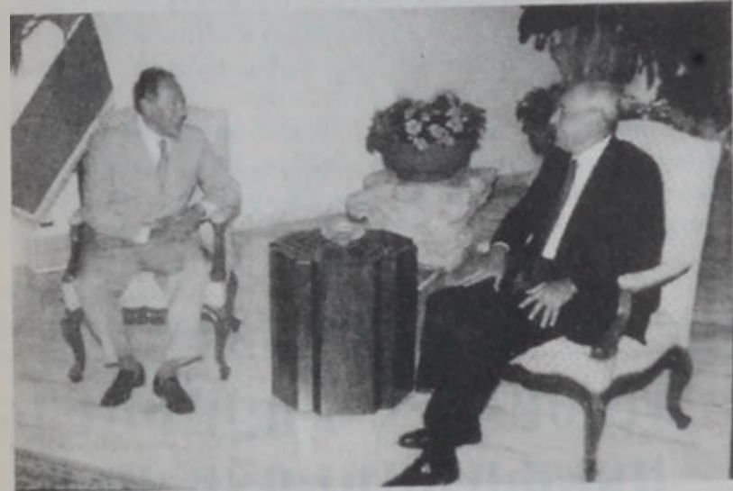
Նախագահ Լահուտ եւ Նեպիհ Պըրրի

Հանրապետության նախագահ ԿՕՐ. Էմիլ Լահուտի հետ տեսակցել է երբ, խորհրդարանի նախագահ Նեպիհ Պըրրի երկիրը այցելած երեսփոխաններուն յայտնեց, թէ նախագահ Լահուտ հաւատացած է, որ հաւասար հեռադիմացում վրայ կը մնայ բոլոր կողմերուն հետ եւ ոչ ոքի դէմ «վերթ» ունի: