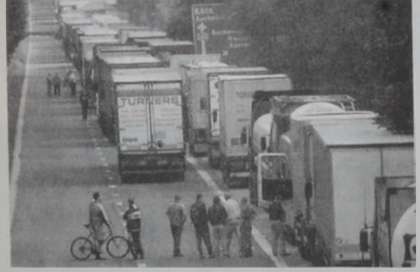
Բեռնակառքեր փակած են Պելճիքա - Գերմանիա սահմանը:

Բեռնատար փոխադրակառքերու վարորդներ՝ վարացած վառելիքի շատ բարձր հարկերէն, երկէ իրենց բողոքները հասցուցին Բրիտանիոյ վարչապետ Թոնի Բլէրի դրան սեւին, մայրաքաղաք Լոնտոնի կեդրոնը անդամալուծելով: