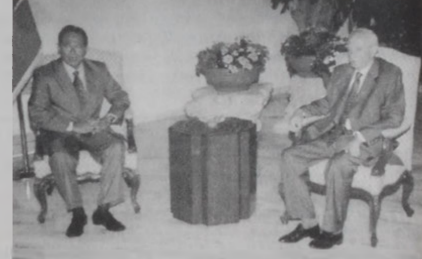
Նախագահը կ'ընդունի Զարամէն

Հանրապետութեան նախագահ ԿՕՐ. Էմիլ Լահուտ երկիրը այցելեց խորհրդարանի նախագահ Նեպիհ Պըրրիի: