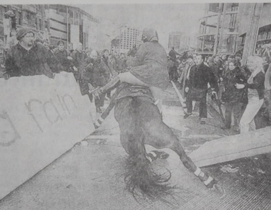
Յոյց՝ համաշխարհայնացման դէմ

աշխատանքին մէջ՝ դուռնկանքի րաւարտ ճեղքումներու մեկնելով ամերիկեան շահերէ: Տարբերակը սակայն այն է, որ ամերիկեան վարչապետը եւ ամէնէն աւելի ճարտարութեամբ կանաչած մեծ պետութիւնները իրենք ձգտին աշխարհի գանձաքան վայրերուն մէջ ծագած տնտեսական տագնապները լուծելու: Պարզ հայեացք մը բաւարար է տեսնելու համար այն թերութիւնը, որ գոյութիւն ունի ամերիկեան տիրապետութեան մէջ, ըլլալ գարգացող ժողովուրդներուն վրայ գեղարվեստի հաստատութիւնը, որպէսզի իրենց յաջողութիւնը իրենց վարչակարգը բնուած էր: