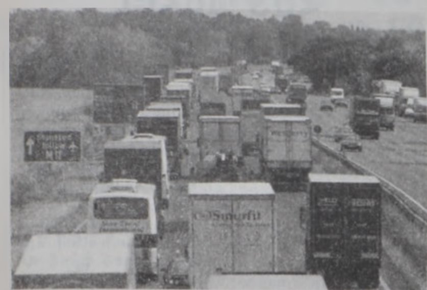
Բեմադրի (Աճգիլի) մեկ մայրուղին բեռնակառքերով փակուած՝ ցուցարարներու կողմէ:

ԼՈՆՏՈՆ. 12 (ՌՈՅԹԸՐԸ).- Բրիտանիոյ երկրագործները Երեքշաբթի օր յայտարարեցին, թէ մայրաքաղաք Լոնտոնը պիտի անշարժացնեն, մինչ վառելիքի սակերուն դէմ թափ սուսացող բողոքները կը պահանային երկրի տարածքին ճամբարներու ցանցը անդամալուծել: