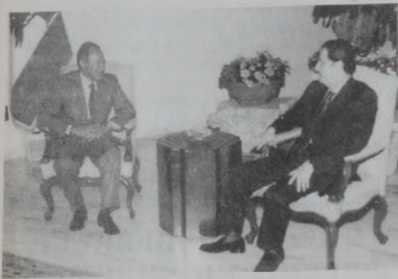
Լահուտ կ'ընդունի Սըրապային:

Հանրապետության նախագահ Գոր Էմիլ Լահուտ երկր ընդունեց երեսփոխաններ Մարուան Ֆարիսը և Թալալ Սրրապային, ինչպես նաև նորոնտիր երեսփոխաններ Անթուն Կանկմար և Նատալյա Սուբբարը: