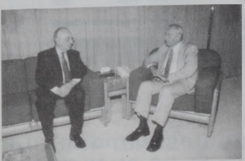
Պըրրի կ'ընդունի Փարիզի մէջ Լիբանանի դեսպանը:

Խորհրդարանի նախագահ ՆեպիՅ Պըրրի երկ կր-դունեց Ֆրանսայի դեսպան Ֆիլիպ լը Քուրթիէն, որ շնորհաւորեց երեսփոխանական ընտրութեան յաջող ընթացքը: «Ասիկա երկար եւ լարող գործընթաց մըն է, բայց կը համապատասխանէ ժողովրդավարական այլ կարգերուն մէջ որ պետք է ձեւերուն», ըսաւ Ֆրանսացի դեսպանական ղեկավար Երաշխիքներու, աշխույժ հանրապետութեան ու խորհրդարանի նախագահներուն իրաւաստութիւններուն, ինչպէս նաև իւրաքանչիւր նորոնտիր երեսփոխանի կարծիքին կարեւորութիւնը: