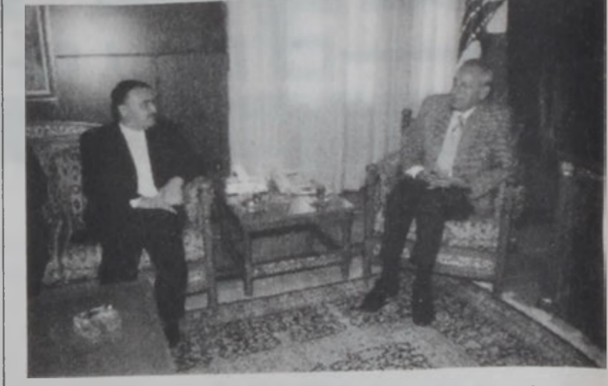
Իրանի դեսպանը այցելեց խորհրդարանի Գալազահին:

Խորհրդարանի նախագահ Նեպիհ Պըրրի երէկ Մալլեի մէջ ընդունեց «Իմադրութիւն եւ բարգաւաճում» ցանկի ընտրութիւնը շնորհաւորող երեսփոխաններ ու ժողովրդային կրօնական, աշխատանքական եւ պաշտօնական պատուիրակներին: