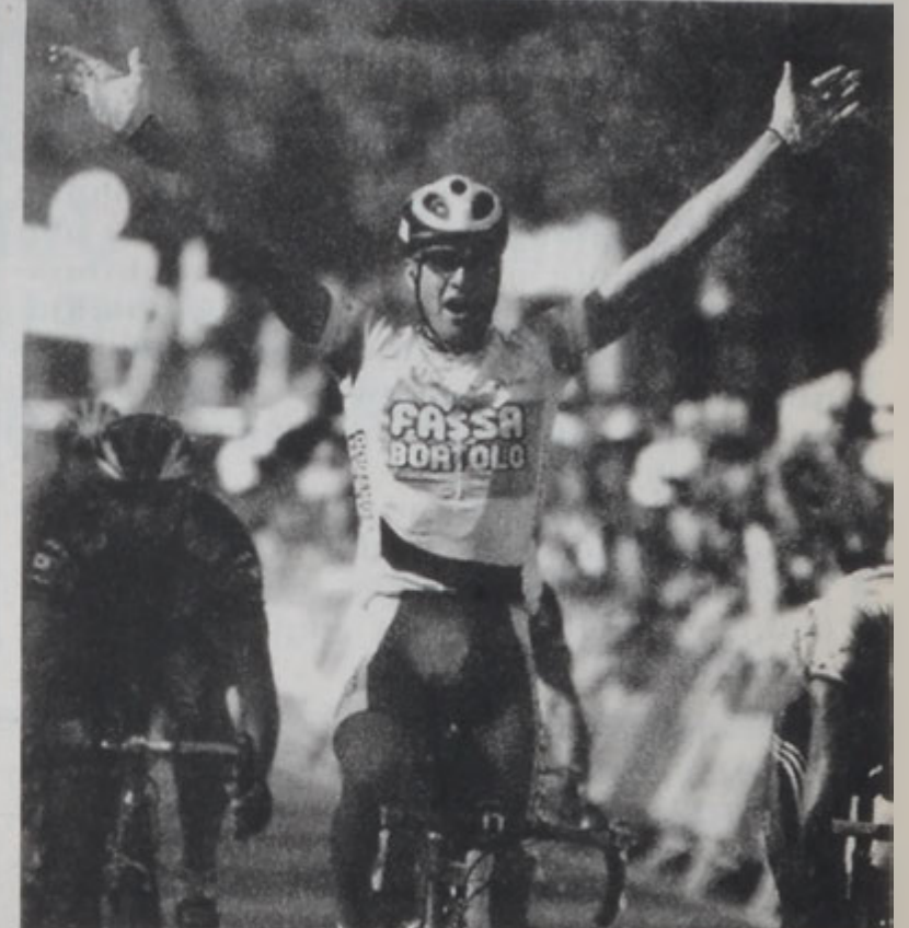
Փեթաչի յաղթական կը հասնի ժամանան գիծ

Իտալացի Ալեսանտրո Փեթաչի շահեցաւ Սպանիոյ շրջափակի 12րդ հանգրուանը, երկ, Սարաևոյի մէջ, 131,5 քմ. երկարութեամբ: Երկրորդ եւ երրորդ դիրքերը եւս բաժին ինկան իտալացիներու՝ յաջորդաբար Ճիւվանի Լոմպարտիի եւ Սթեֆանո Քազակրանտայի: