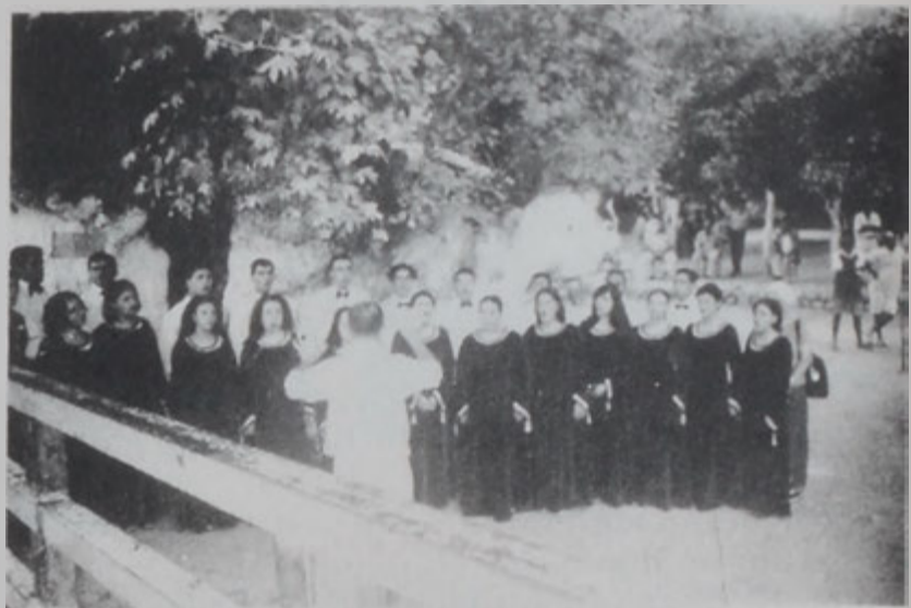
«Կոմիտաս» երգչախումբը՝ Մուսա Լեւոն Խորապէսի գիւղին մէջ:

Վերջին շրջանին, ամիսներու ընթացքին փորձերէ ետք է միայն, որ սկսաւ իր ելոյթներու շարքը, նաեւ՝ Այնճարի մէջ եւ ազատագրութեան հարաւի սահմանին վրայ, որմէ ետք մեկնեցաւ պատմական Մուսա Լեւոն, Սուրբ Աստուածածնայ տնին ելոյթ ունենալու համար: Մուսա Լեւոն հայրենակ վազրճի գիւղի եկեղեցւոյ կողքին երգչախումբը ելոյթ ունեցաւ, որուն ներկայ էր նաեւ Պոլսոյ Հայոց պատրիարքը, դարձեալ կամուրջներ հաստատելու Այնճարի եւ Մուսա Լեւոն միջեւ երկար տարիներու պարտադիր ընդմիջումէ ետք: Մեծաթիւ թուսա լեռնային աշխարհի տարրեր շրջաններէն եկած էին իրենց հարագատ գիւղը՝ դարձեալ հերիտան պատրաստելու եւ տառու- գունանայի կշռոյթին ի յուր՝ ամբողջ իրենց ոտքերը գետին գարնելու: Ներկայեւոր