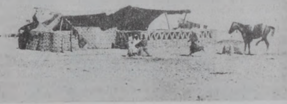
Եգիպտոսի ղուլամները իրենց տնային կառուցածքները կառուցեցին անոնց լատախիսապէս:

ութեան վճարակաւ ստացաւ ղուլամ ղուլամ (ծառայ) դարձաւ, իսլամացուցաւ և գաւտի (դատար) ճամալ ալ Տաուլա պըն Ամմարի (Համար) մօտ ծառայութեան մտաւ: Իր տիրոջ անունով ան Մամալի կոչուցաւ: