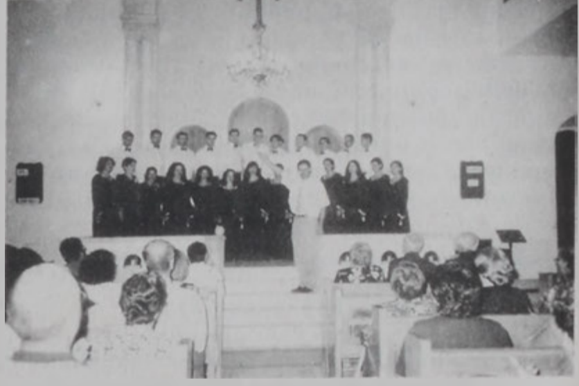
Քեսապի եկեղեցին մէջ:

յուզումով հետեւեցան երգչախումբին կատարումներուն եւ միայն «Մուսա Լեւոն Պարեգ» էր, որ ուրախութիւնը միախառնեց յուզումին: