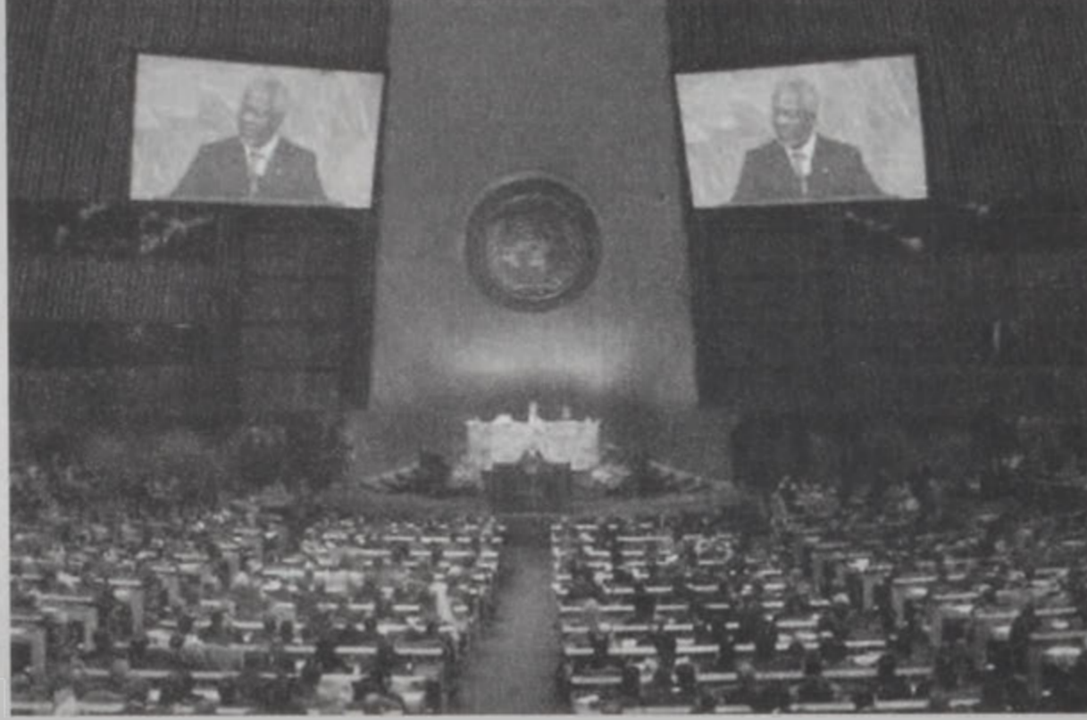
Վեհաժողովէն տեսարան մը, որ Զոֆի Անան կը կատարէ բացումը:

ՄԱԿԻ ընդհանուր քարտուղար Զոֆի Անան երէկ Նիւ Եորքի մէջ բացումը կատարեց հայկական խորհրդարանի անունով յարգելի ՄԱԿԻ վեհաժողովին, որուն կը մասնակցին արեւելի քան 150 թագաւորներ, նախագահներ եւ վարչապետներ: