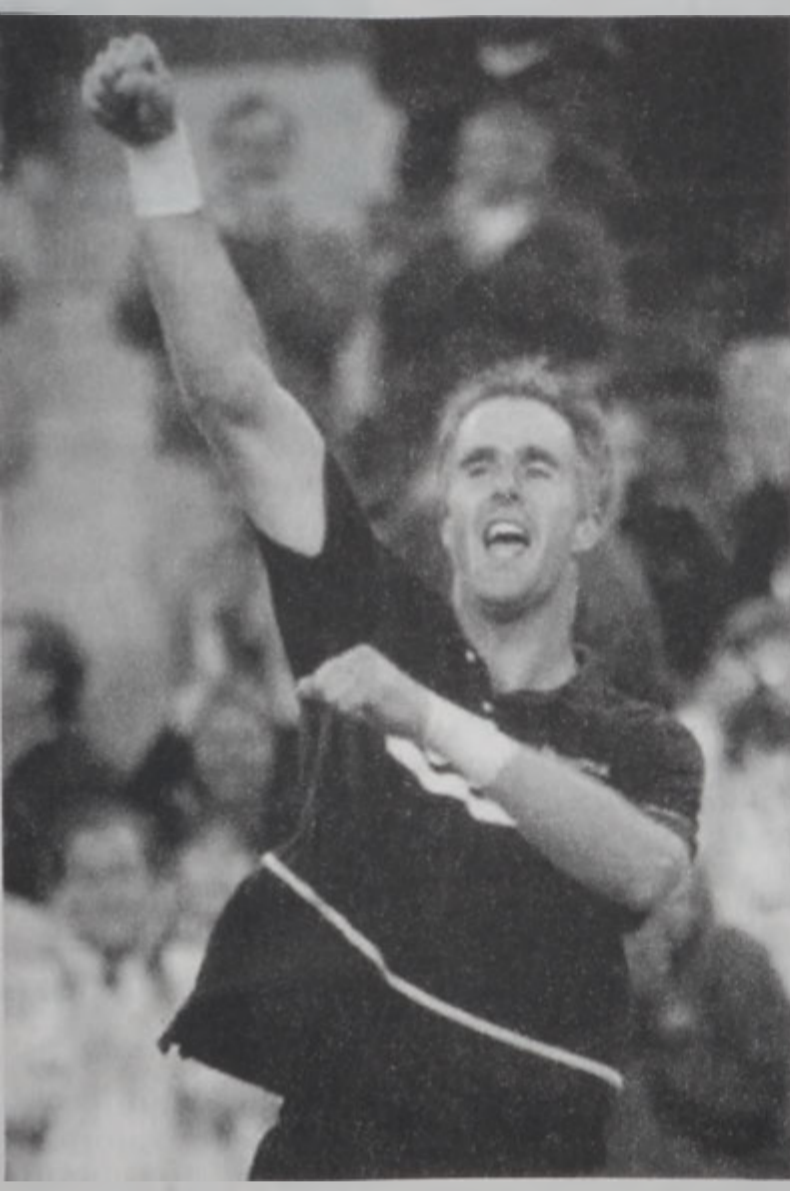
Թոտ Մարթինը կը սօցէ իր յաղթանակը

Թենիսի ԵՈՒ. ԸԱ. Օփըն մրցաշարքին Կրդ հանգրուանի մըր-ցումներուն ամերիկացի Թոտ Մարթին յաջողեցաւ մեծ իրազործում մը կատարել, երբ Քարլոս Մոյաի (Սպանիա) դէմ իր կատարած մըր-ցումը յաղթանակով աւարտեց, հակառակ անոր, որ ան առաջին երկու սէթերը պարտուած էր. գրեթէ պարապ թրիպիւններով տեղի ունեցած մըրցումին ընթացքին: Սակայն թիւով քիչ համակիրները միջոտ ալ կը քաջալերէին երկու մարտիկները: Առաջին երկու սէթերուն 6-7 եւ 6-7 արդիւնքով պարտուելէ ետք, Թոտ Մարթին յաջողեցաւ վերջին երեք սէթերուն յաղթանակներ արձանագրելէ ետք, 6-1, 7-6 եւ 6-2 արդիւնքով, մրցաշարքէն դուրս մըրցել սպանացի իր մրցակիցը: Թոտ Մարթինի արձանագրած այս յաղթանակը այս տարուան ԵՈՒ. ԸԱ. Օփընի մրցաշարքին ընթացքին ցարդ եղաւ ամենէն երկարը, որովհետեւ մարտն այս մըրցումը տեւեց չորս ժամ եւ 15 վայրկեան: Քառորդ աւարտականի մըրցումներուն, աստորալիացի Լէյթըն Հեւլիթ (դասուած 9րդ) անխնայ եղաւ ֆրանսիացի իր մրցակիցին՝ Արնօ Էլիմանի հանդէպ եւ արձանագրեց յաղթանակ մը՝ 6-2, 6-4 եւ 6-3 արդիւնքով: 19 տարեկան աստորալիացի արձանագրած այս յաղթանակը տեւեց չորս ժամ եւ 15 վայրկեան: Քառորդ աւարտականի մըրցումներուն, աստորալիացի Լէյթըն Հեւլիթ (դասուած 9րդ) անխնայ եղաւ ֆրանսիացի իր մրցակիցին՝ Արնօ (Մ.Ն.): Աղջկանց քառորդ աւարտականի մըրցումներուն ալ անակնկալ մը ստեղծեց ուս 18 տարեկան Էլէնա Տեմենթիեա, որ 6-1, 3-6 եւ 6-3 արդիւնքով պարտութեան մատնեց 10րդ դասուած վերջերան Անքը Հիւպերը (Գերմանիա) եւ եղաւ կիսաաւարտականի մըրցումներուն հասնող առաջին թենիսիստը: