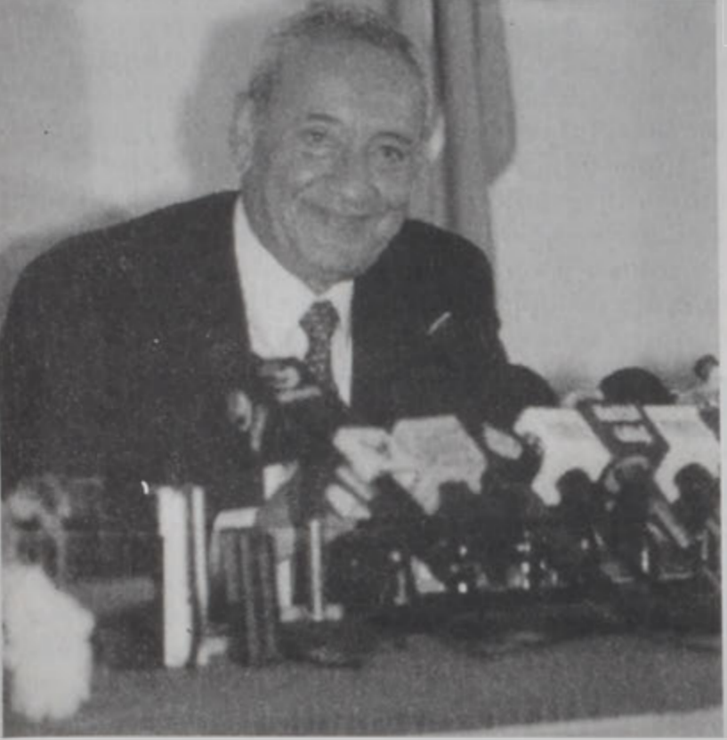
Նեպիտ Գրորի ասուլիսի պահուն:

Խորհրդարանի նախագահ Նեպիտ Գրորի երէկ տուաւ մամլոյ ասուլիս մը, որուն մէջ «Գիւմարու ժողովուրդին եւ բարգաւաճում» ցանկին անունով շնորհակալութիւն յայտնեց հարաւի եւ Պեքալի ժողովուրդին, որուն տուած քուէները նուիրագործեցին իմամ Մուսա Սատրքի ուղեգիրը: