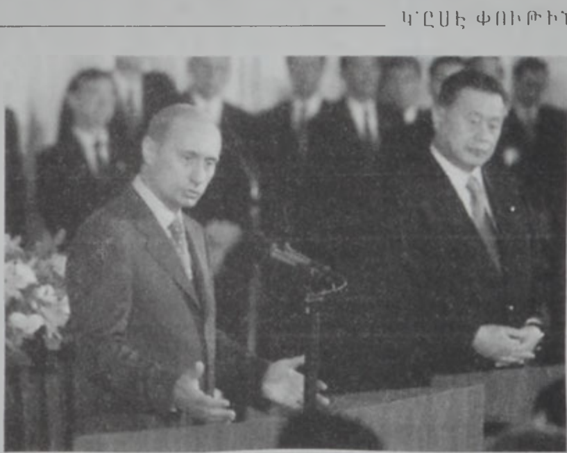
Փութին եւ Մորի միացեալ մամուլի ասուլիսի ընթացքին:

աւելի քան վիճակի մէջ կը գտնուին ներկայիս: