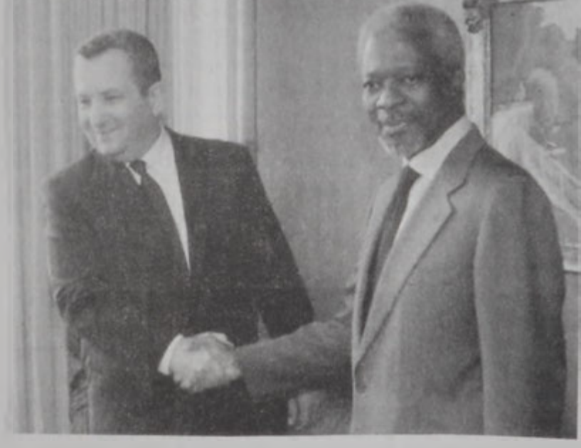
Պարաք - Անան հանդիպում

Պէյրութի Ա. Բ. եւ Գ. ընտրաշրջաններուն մէջ Հայկական Միասնականութեան ձակաւոր թեկնածուներուն ստացած հայկական քուէները կը պարզեն հետեւեալ պատկերը:- Ա. ընտրաշրջանին մէջ ձակաւոր թեկնածուներուն ինքնատ քուէարկած են 3,046 հայ քուէարկողներ. Բ. ընտրաշրջանին մէջ՝ 1,574 հայ քուէարկողներ եւ Գ. ընտրաշրջանին մէջ՝ 6,366 հայ քուէարկողներ: Ա. ընտրաշրջանին մէջ 253 հայ քաղաքացիներ քուէարկած են նախկին վարչապետ Ռ. Հարիրիի «Արժանապատուութիւն» ցանկին, Բ. եւ Գ. ընտրական շրջաններուն մէջ յաջորդաբար՝ 422 եւ 1,405 հայ քաղաքացիներ: Հետեւաբար երեք ընտրաշրջաններուն մէջ Հայկական Միասնականութեան ձակաւոր ստացած հայկական քուէներուն գումարն է 10,986 քուէ (84 առ հարիւր), իսկ «Արժանապատուութիւն» ցանկին ստացած հայկական քուէներուն գումարը՝ 2,080 քուէ (16 առ հարիւր):