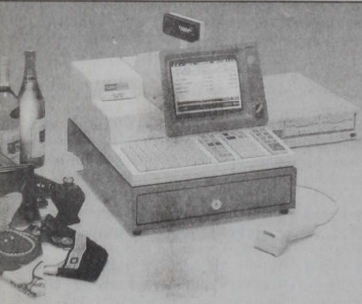
Total programmability lets you configure a register to meet the specific needs in any retail field.