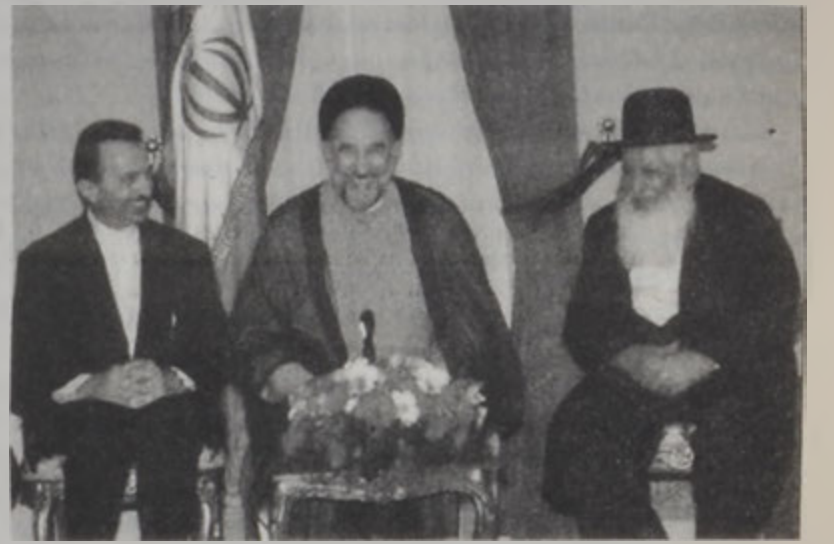
Խաթեմի հրեայ ղեկավարներու հետ հանդիպումի պահուն:

Իրանի նախագահ Սոհաձէտ ինքնուրու երկէր ընդունեց հրեայ ղեկավարներ եւ կոչ ուղղեց խաղաղ գոյակցութեան երկրին տարբեր համայնքներուն միջեւ: