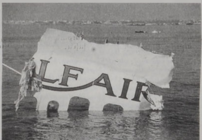
Կալֆ Էրի օդանավը բեկոր մը ծովուն մէջ:

Կալֆ Էրի ջախջախուած էրպիս 320 տիպի օդանավին արկածին պատճառները յայտնաբերելու համար, երկէր Նորվայ ընկերութեան 4 մասնագէտներ Պահրէյն ժամանեցին: