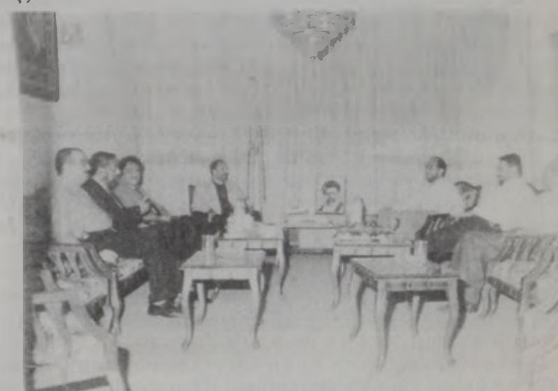
Հանդիպում Հրզրայի շրջ. գրասենյակի անդամներին:

Պասս կուսակցության Լիբ. Շրջ. Խորհրդի անդամները: