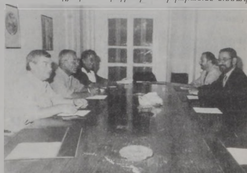
Պասս կուսակցության Լիբ. Շրջ. Խորհրդի անդամները:

Հ. Յ. Դ. Լիբանանի կոմիտեն երկրակազմակերպող քաղաքական կոմիտեի կողմից 2000 թվականի հունիսի 20-ին կայացված 200 հոգիի համաժողովում սահմանված մեջ: