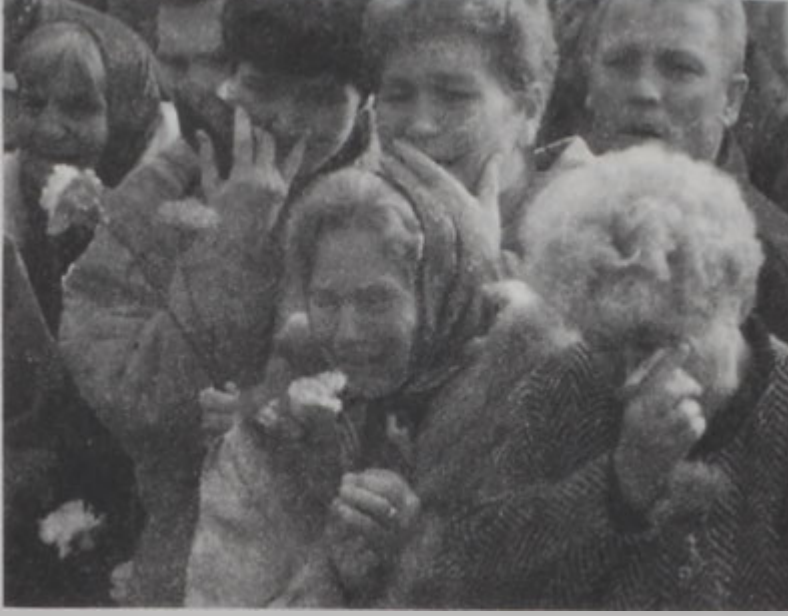
Նաւաստիներուն հարագատները կը սգան: