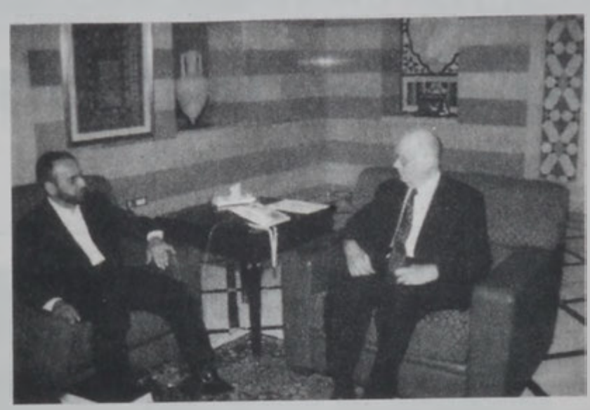
Վարչապետը կ'ընդունի Մուսաուհի

Վարչապետ Սեյիմ Հրսիսը ընդունեց երեսփոխան Ամար Մուսաուհիի եւ անոր հետ քննարկեց ընդհանուր գարգացումներն ու երկրին մէջ երեսփոխանական ընտրությունները առաջին հանգրվանի նախորակելի տիրոջ կացությունը: