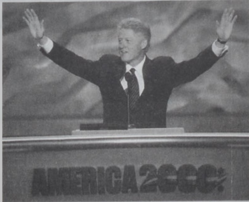
Պիլ Բլինթըն՝ Դեմոկրատական Ազգային Համագումարի բացումից, Լոս Անճելեսի մէջ, իր խօսքի նախօրեակին:

Մ. Նահանգներու նախագահ Պիլ Բլինթընը Երկուշաբթի օր Դեմոկրատական Կուսակցութեան հրաժեշտ տուաւ, շնորհակալութիւն յայտնելով, որ «հարաւային փոքր քաղաքէ մը» անձ մը կը բարձրացնէ իր նախագահ ծառայելու եւ ողջունեց քաղաքացիական պատերազմէ զոհուող պետութիւնը: