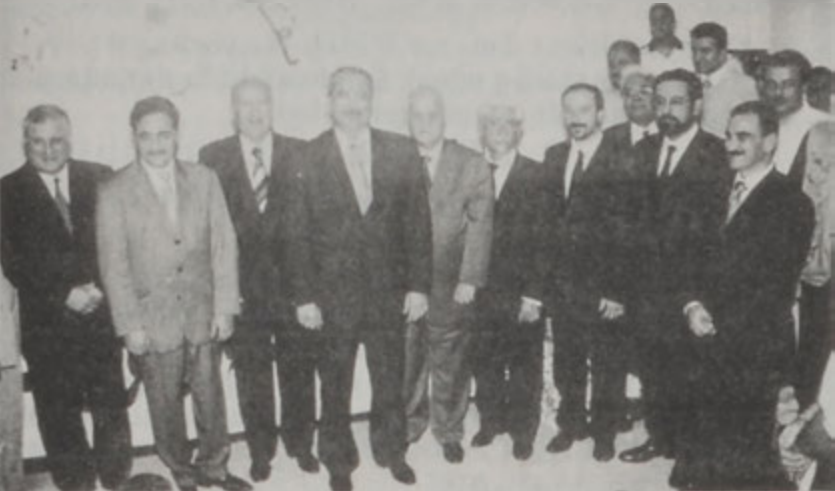
Ֆ. Մախգուլմի՝ «Հայկական Միասնականութեան Զակատ»ի թեկնածուներու հետ:

Տէտէան կը ներկայացնէ իր հայու-Հայկական Միասնականութեան շահագործողները: Ան աւելցուց, որ ինքն իր ինքնուրուի շահագործողները: