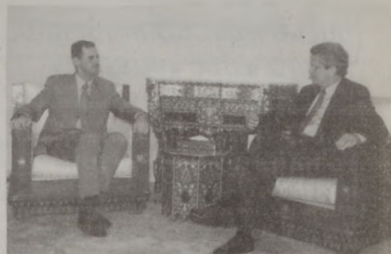
Նախագահ Ասատ ընդունեց Ուոլթը:

ՆԱԽԱԳԱՏ ԱՍՍՏ ԸՆԴՈՒՆԵՅ ԱՄԵՐԻԿԱՅԻ ՊԱՏՈՒԻՐԱԿ Է. ՈՒՈՔԸ