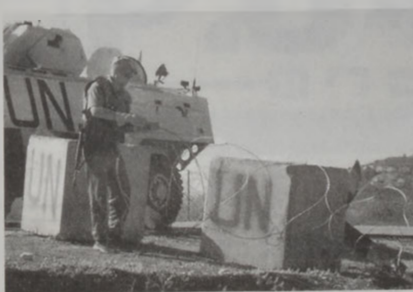
ՄԱԿԻ ուժեր կը հաստատուին հարաւի մէջ:

ՄԱԿԻ խաղաղարար ուժերը անցեալ շաբաթավերջին հաստատուեցան Լիբանան - Խորաճէյ սահմանալին 13 դիրքերու վրայ: