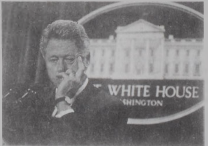
Ըլինթոն մտահոգ՝ բանակցութիւններու ապագայով:

զինեալ ժողովրդական Ինթիֆատայի մը ծագման հաւանականութիւնը: Ինթիֆատայի մը, որուն մասնակցութիւնը պաղեստինեան ազգային իշխանութիւններու ապահովական ուժերուն կողմէ չի բացառուիր երբեք: