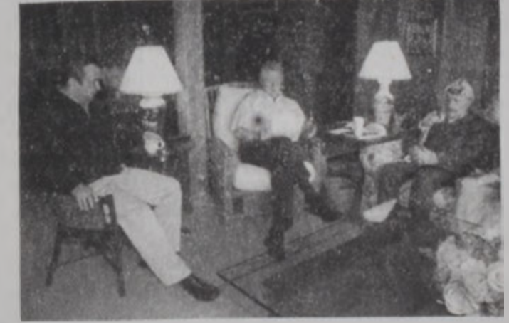
...Սակայն բանակցութիւններու ընթացքին շեշտուեցաւ հեռաւորութիւնը:

Սպիտակ Տան բանբեր մը յայտնեց, որ Պարաք Քլինթոնի ուղղեց նամակ մը, որուն մէջ կ'ըսէ, թէ պաղեստինցիները կ'արգելակեն ՔԷՄՓ ՏԷՅՎԻՏԻ վեհաժողովի ընթացքը: Միւս կողմէ, պաղեստինեան աղբիւրները յայտնեցին, որ պաղեստինեան իշխանութիւններու նախագահ Եասէր