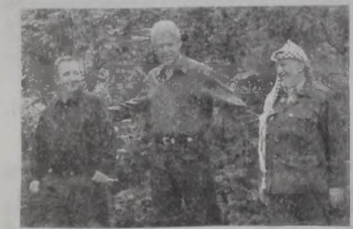
Ըլինթոն կը փորձէր մօտեցնել Պարաքը եւ Արաֆաթը...

Մինչև առաջնության կանոնի ժամերը (ՊԵՄՓ) ժամով) ՔԷՄՓ ՏԷՅՎԻՏԻ վեհաժողովին մասնակցող ամբիոնիկները կողմը շարունակեց իր ճիգերը՝ եռակողմ հանդիպումը դրական ելքով մը աւարտելու համար, մինչև Խորաշխյի վարչապետ Էհուտ Պարաք նախագահ Պիլ Քլինթոնի ուղղուած նամակով մը յայտարարեց, թէ վեհաժողովը «աւարտած է ձախողութեամբ»՝ ամբաստանելով պաղեստինեան կողմը բանակցութեանը ընթացքը խանգարելու մէջ: