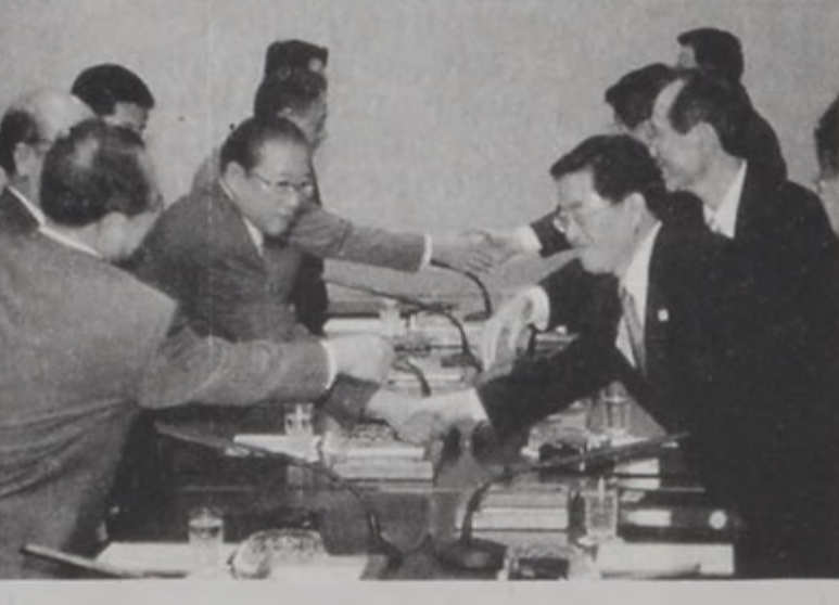
Հիւսիսային եւ հարաւային քորեական պատուիրակութիւններուն անդամները իրարու կը ծանօթանան:

ՍԷՆՏԷ, 31 (ՌՈՅՅԹԸՐԸ). - Հիւսիսային Քորէա եւ Հարաւային Քորէա Երկուշաբթի օր յայտարարեցին, թէ Համաձայնութիւն մը գոյացուցած են կարգ մը հարցերու շուրջ, որոնց շարքին՝ երկու երկիրները բաժնող ապառազմականացած գօտիին երկայնքին կապի միակ կէտին՝ Փանմունճոմի մէջ, կապի գրասենեակներու վերաբերման ծրագիրը: