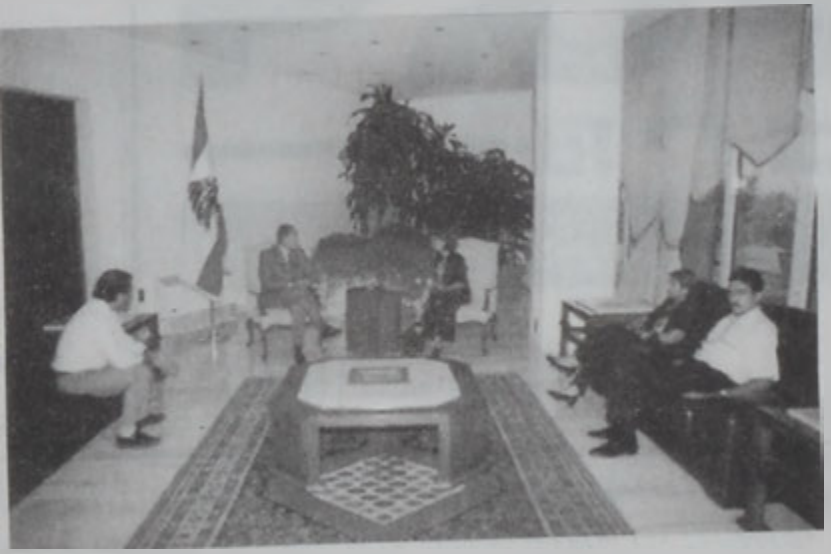
Նախագահ Լահուտ ընդունեց առեւանգուածներու հարագատներու պատուիրակուիւնը:

Սահմանադրական խորհուրդի նորընտիր անդամներ Սաւի Եուսէս, Աֆիֆ Մըքատէս, Էմիլ Պըժմարի, Մուսթաֆա Մանսուր եւ Կապրիէլ Սըրիանի երէկ նախագահ Կոր. Էմիլ Լահուտի առջեւ տուին իրենց երդումը: Արարողութեան ներկայ գտնուեցան սահմանադրական խորհուրդի նախագահ Ամին Նասար եւ նախագահական պալատի պաշտօնատարները: