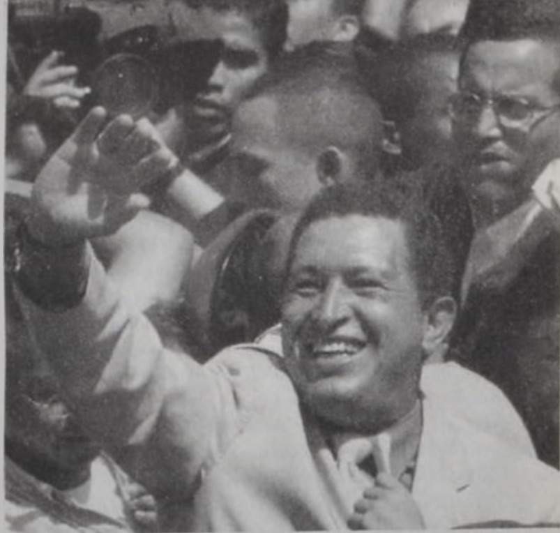
Վեճեցուցիլայի ճախագահը կ'ողջունէ իր համակիրները:

ՔԱՐԱՔԱՍ, 31 (ՌՈՅՅԹԸՐԸ) - Դէպի ձախ թեքող վեճեցուցիլայի նախագահ Հուկօ Չաւէզ Կիրակի օր տեղի ունեցած ընտրութիւններուն յաղթական դուրս եկած է՝ յաւելելով Ս տարուան Համար վերընտրուելով: