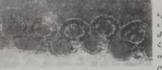
ՄԻՏԱ-յի ժահրը վարակուած Լեմ-Ֆոսիք ԹԵ. ԲԵԻՅԻ մը մակերեսին վրայ: