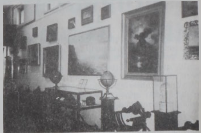
Այվազովսքիի նուիրուած անկիւնը

առհասարակ հայ ազգային ինքնագիտակցութեան ու զարթօնքին: Այս պատճառով Մխիթարեանները եթէ ուր որ առաջ արդէն իսկ սկսած են ընել այն, ինչ որ կը փորձենք ընել այսօր մենք սփիւռքահայրէս ամէն տեղ: Ուրեմն, մեր քանգարանին հիմնական հարստութիւնը կը կազմեն հայ մշա-