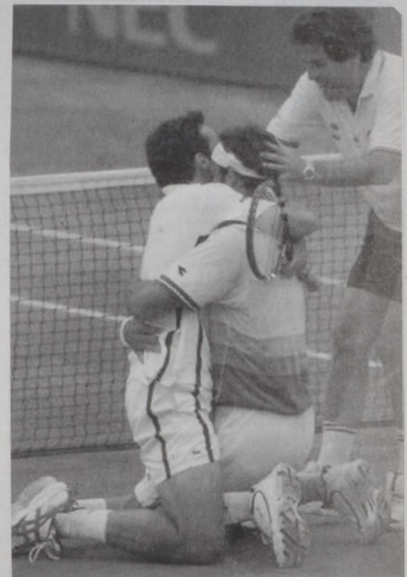
Քորեթիա եւ Պալաւէս կը տօնեն զոյգի մրցումին իրենց յաղթանակը, որուն շնորհիւ Սպանիա ապահովեց աւարտականի տոմսակը:

Թեյնիսի Տէյլօր բաժակին (ազգային խումբերու) գծով, Սպանիա մեծ իրազորում մը կատարեց շարաթակերտին, երբ կիսաաւարտականին 5-0 արդիւնքով տապալեց հզօր Միացեալ Նահանգները եւ հասաւ աւարտականին, ուր պիտի ճակատի Աւստրալիոյ դէմ, յառաջիկայ Գեկտեմբերին, Սպանիոյ մէջ: 1921էն ի վեր Սպանիա միշտ այ կը մասնակցի այս հեռակաւոր մրցաշարքին, սակայն անկէպէտ ցարդ որեւէ անգամ չէ շահած տիտղոսը: Ըստ մասնագէտներու, այս անգամ առաւելուելիւնը ի նպատակ անոր է, ոչ միայն որովհետեւ անկէպէտ աւարտական մրցումները պիտի կատարէ իր երկրին մէջ եւ համակիրներուն ներկայութեան, այլեւ ունի շատ յաւ կազմ մը: