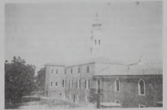
Վերանորոգուած գանձատան մէկ մասը

Պ. - Մխիթար Սեբաստացիին հիմնական մտահոգութիւնը, որ փոխանցած է նաեւ իր անմիջական յաջորդներուն, եղած է փրկել հայերէն ձեռագիր մատենաները: Մխիթար Սեբաստացի կը պատուիրէր Մխիթարեան հայրերուն, որ ամէն տեղ փնտռեն, եւ ուր որ հանդիպին հայկական ձեռագիրներու: