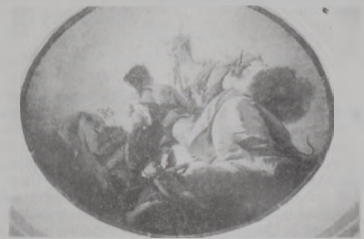
Մխիթարեան միաբանութեան գանձերն՝ Թիֆլիսի մէկ գլուխ գործոցը

Պ. - Մխիթարեան միաբանութեան Իտալիոյ մէջ ըլլալու իրողութիւնն ու միաբաններու եւրոպական կրթութիւնը ստանալու հնարաւորութիւնը մեծապէս օգտակար եղած են ոչ միայն հայ մշակույթի գանձերու հաւաքման ու պահպանման, այլեւ