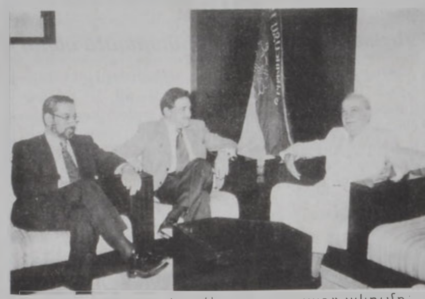
Ժորժ Ֆրեմ այցելեց «Սարգարայատ» ակումբ:

Հ. Յ. Գ. Լիբանանի Կեդրոնական Կոմիտէի երեք «Սարգարայատ» ակումբին մէջ ընդունեց նախկին նախարար Ժորժ Ֆրեմը, Ժիլյէլի Քեպուանի մարտնչի մարտի թեկնածու: