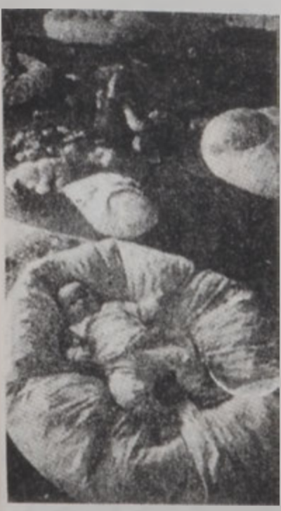
Լոյս տեսած ուսումնասիրությունները ցույց են տալիս, որ մայրական կաթը ավելի արագ է աճեցնում և ավելի զանազան հիվանդություններով է տառապում: