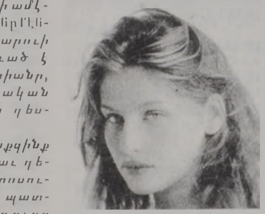
21 տարեկան Լեթիսիա Քասթա, որ աշխարհի ամէնէն հռչակաւոր մոտիլո, ներկէն մէկ կը կր համարուի ներկայիս, ընտրուած է Ֆրանսայի Նոր Մարիանր, այսինքն՝ Ֆրանսական հանրապետութեան դեսպանուհի:

Վերջերս բարեհրական նպատակի համար աճուրդի հանուած է Բրիտանիոյ նախկին վարչապետ Մարկարէթ Թաչարի պայուսակը, որուն համար առաջարկուած է մինչեւ... 165 հազար տոյար: Նոյն առիթով աճուրդի իրեր դրած են մալրէն ձկրի Հոյ եւ վարչապետ Թոնի Պլէրի կինը: Նախկին վարչապետ անձնապէս ներկայ գտնուած է աճուրդին եւ իր «Ֆերրարի» պայուսակին ակնարկելով՝ յայտնած է, թէ անիկա ակնառես եղած է «բացմաթիւ եգակի հանդիպումներու»: