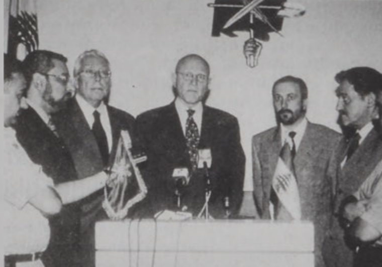
Երեսփոխան Սալամ կը պատասխանէ լրագրողներուն հարցումներուն:

Երեսփոխան Թամամ Սալամ երկ անգլից Հ. Յ. Գ. «Սարգարայատ» ակումբ, որ ընդունուեցաւ Հ. Յ. Գ. Լիբանանի Կեդրոնական Կոմիտէին, հայկական երեսփոխանական պլոքի ներկայացուցիչ Սեպուհ Յովհաննէանի, ինչպէս նաեւ Հ. Յ. Գ. Լիբանանի Կեդրոնական Կոմիտէի քաղաքական դիւանի անդամներու կողմէ: