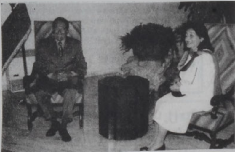
Նախագահ Լահուտ կ'ընդունի Պահիա Հարիրին:

Հանրապետության նախագահ Վոր. Էմիլ Լահուտ երեկ Պատմության պալատին մէջ ընդունեց երեսփոխան Պահիա Հարիրին, որ կը գլխավորէր հարաւային Լիբանանի ապստամբութեամբ շրջապատու էին 8 հազար աշակերտներու քաղաքներուն մը: