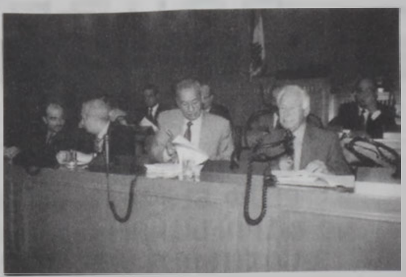
Նեպիին Պըրրի խորհրդարանական լանձնախումբերու միացեալ նիստի ընթացքին:

Խորհրդարանական լանձնախումբերը երեկ գումարած իրենց միացեալ ժողովին որոշեցին նախարարութիւններու եւ պետական խորհուրդներու միացման օրինագծին բարեփոխում տարբերակը: Այս վաւերացումին հիման վրայ, խորհրդարանի նախագահ Նեպիին Պըրրի երեսփոխանները հրաւիրեց երեքշաբթի 25 եւ Զորքշաբթի 26 Յունիսին գումարելու օրենսդրական լիագումար նիստեր քննարկելու եւ քուէարկութեամբ վաւերացնելու համար օրակարգի վրայ գտնուող օրինագիծեր, որոնց կարգին նաեւ վերալիշեալ օրինագիծը: Երեկուան ժողովը նաեւ որոշեց 64 տարեկանէն վեր լիբանանցիներու առողջապահական ապահովութեան օրինագիծը: