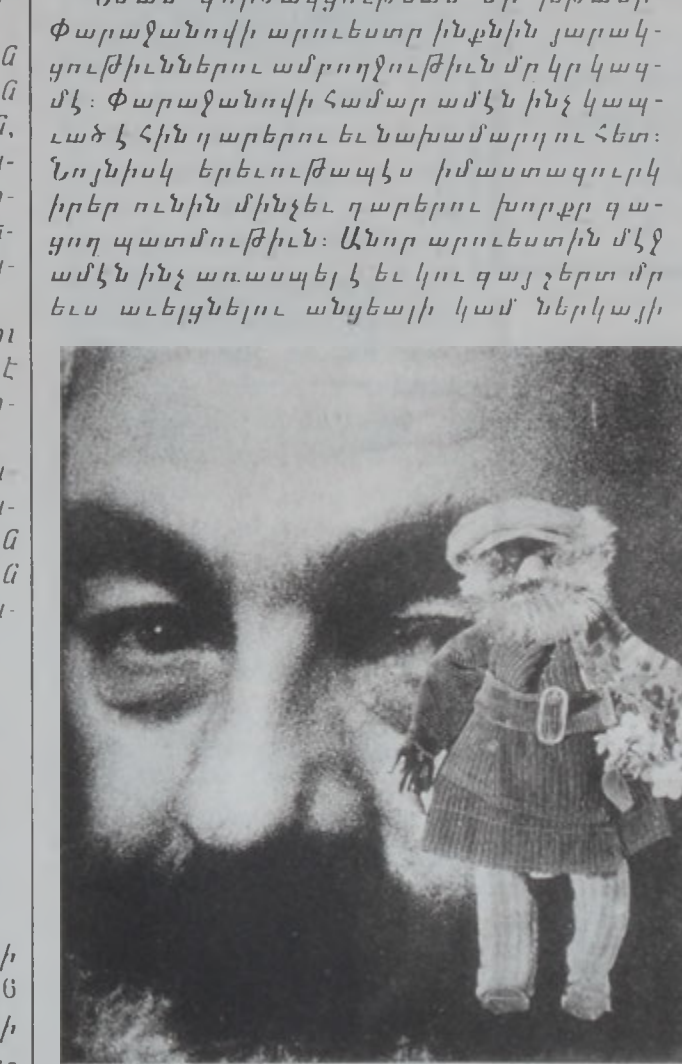
«Փարաջանովի դրախտի մէջ» - 1988

Նման գործակցութեան մը խթանը՝ Փարաջանովի արուեստը ինքնին յարակցութիւններու ամբողջութիւն մը կը կազմէ: Փարաջանովի համար ամէն ինչ կապուած է հին դարերու եւ նախամարդու հետ: Նոյնիսկ երեւութապէս իմաստազուրկ իրեր ունին մինչեւ դարձել խորք գացող պատմութիւն: Անոր արուեստին մէջ ամէն ինչ առասպել է կը կու գայ շերտ մը եւս աւելցնելու անցեալի կամ ներկայի: