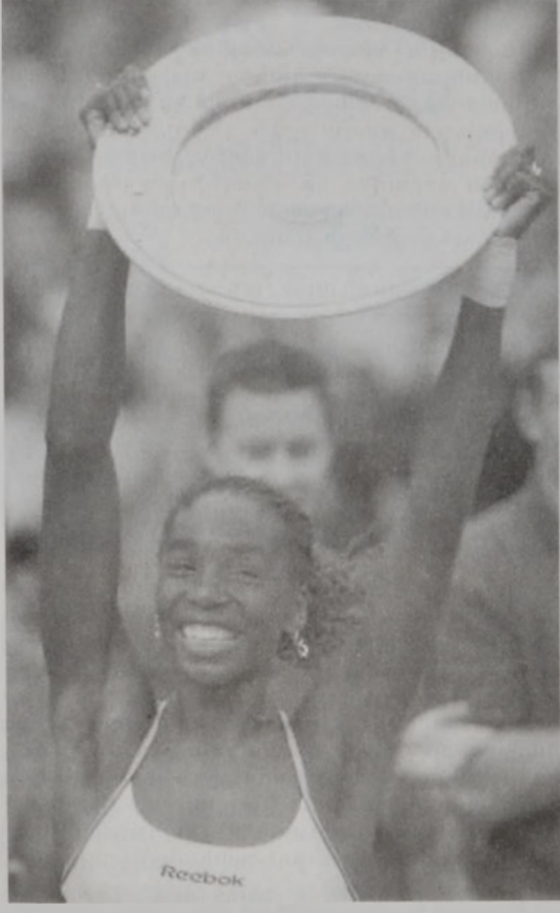
Վինըս Ուլիմպուս կը բարձրացնէ բաժակը:

Թենիսի Ուլիմպիոնները մրցաշարքը (կրան շեյէմ) աւարտեցաւ երկր, անձրեւոտ օրէ մը ետք: Աղջկանց տիտղոսը Շարաթ օր շահեցաւ ամերիկացի Վինըս Ուլիմպուս, իսկ երկր, տղոց տիտղոսին տիրացաւ ամերիկացի Փիթ Սամփրաս: Ուլիմպուս պարտութեան մատնեց աղջկանց Լինտոնյ Տեվրնփորթը (6-3 եւ 7-6), իսկ Սամփրաս՝ աւստրալիացի Փաթրիք Ռաֆթրը (6-7, 7-6, 6-4 եւ 6-2): Այսպէսով, Ուլիմպիոնները այս տարի աւարտեցաւ Հարիւր տոկոս ամերիկեան յաղթանակով: