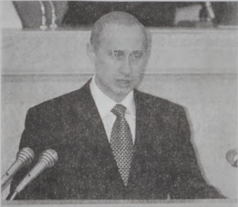
Փութին իր խօսքի պահունգ:

Ռուսիոյ նախագահ Վլատիմիր Փութին Շարաթ օր պաշտօնական ու կարեւոր իր առաջին խօսքը փոխանցեց Պետական Տումային եւ դաշնակցային խորհրդարանին միացեալ նիստին, որուն ընթացքին ներկայացուց իր պատկերացումը երկիրը յուզող զանազան հարցերուն մասին: Նիստին ներկայ էին նաեւ դատաւորներ, բարձրաստիճան կրօնաւորներ եւ այլ անձնաւորութիւններ: