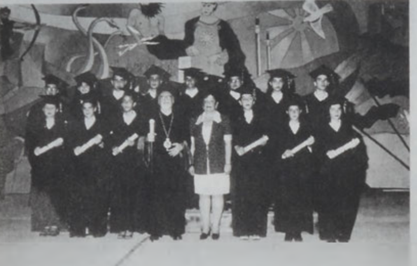
Հայ կաթողիկէ համայնքի Ներսէս Պետրոս ԺԹ. կաթողիկոս-պատրիարքը վկայեալ աշակերտներուն եւ վարժարանի տնօրէնի հետ:

Վարժարանի աշակերտները ներկայացուցին գեղարվեստական յայտագիր մը, որմէ ետք միջոցառումն աշակերտներուն անունով ուղերձներ կարդացին՝ Գարոյի Մկրտիչեան արարելէն, Արամ Գարատաղեան անգլերէն, իսկ Ռիթա Չալոյեան՝ հայերէն: