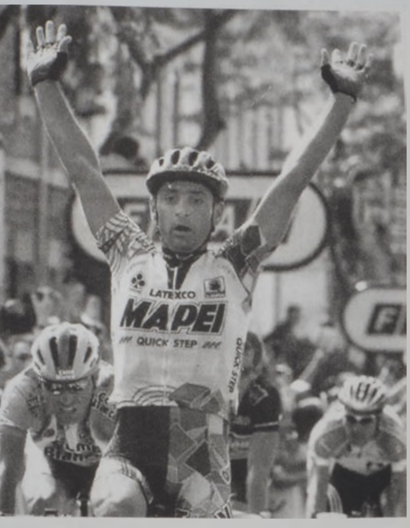
Պեթինի կը հասնի ժամանման գիծ:

Ֆրանսայի չորվազգի ծրոյեցի Գրոյ Հանգրուանները տեղի ունեցան շարժապարհի վրայ, որոնց ընթացքին յատկանշական իրադարձութիւններ չարձանագրուեցան: