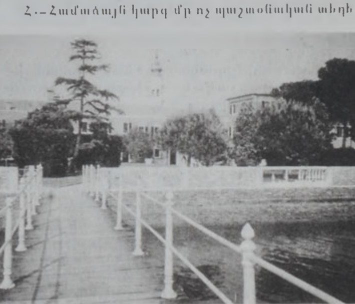
Ս. Ղազար կղզիին Միսիթարեան միաբանութեան վերանորոգումը վառը: