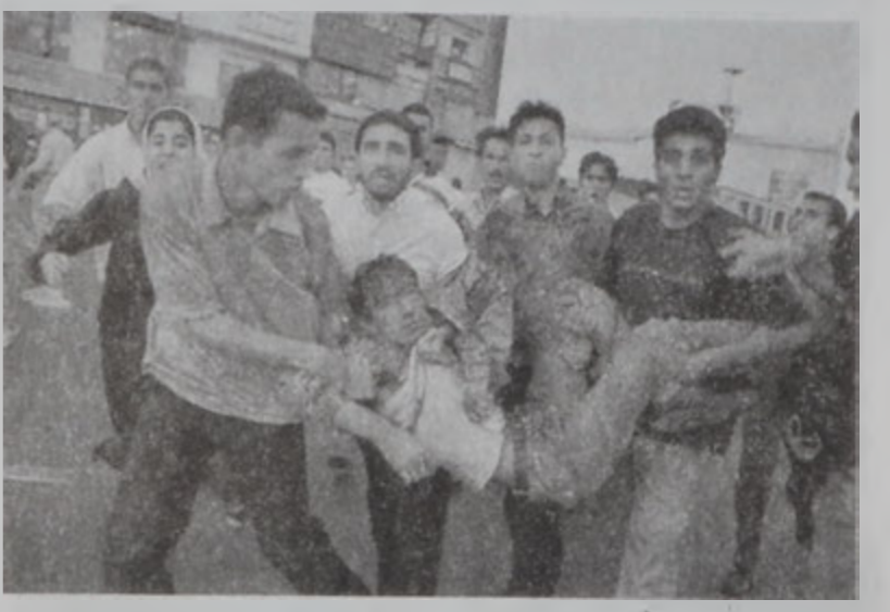
Ուսանողներ կը փոխադրեն վիրաւոր ուսանող մը:

Իրանի գերագոյն ղեկավար յայտարար Ալու Ալի Սուսթաֆան «թշնամիներ» մեղադրեց անցեալ տարի տեղի ունեցած ընկերային խռովութիւններուն համար: