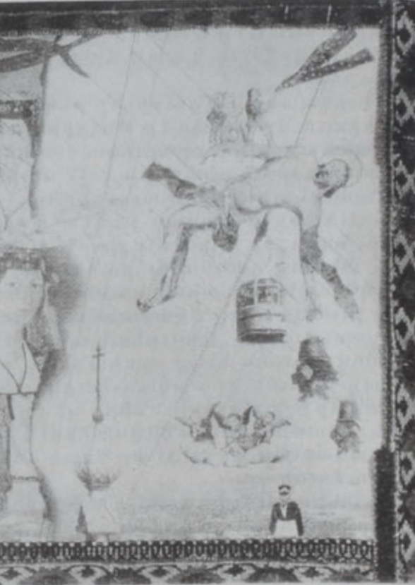
«Աղօթք» Յովնաբանեանի համար - 1987

Նոյն գրքուկին մէջ Ֆրանսայի դեսպան Ֆիլիփ Լըբուրթիէ իր հերթին կը գրէ. «Մեծ վարպետ Սերգէյ Փարաջանովի կերպարուեստին նուիրուած ցուցահանդէս մը այս ձեւով իր յաւաքոյն տեղը կը գտնէ Պէրլուցի մէջ, այնպիսի ժամանակ»: