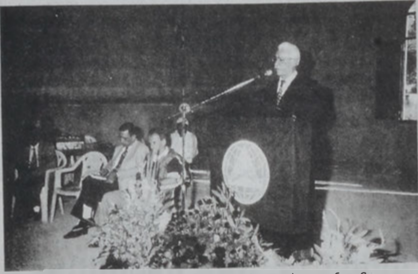
Նախարար Տեղեկան իր խօսքի պահունգը:

Շուքի Բար Բաքուր գիւղին մէջ, Ընկերվար Յաւազարիական Կուսակցութեան կազմակերպութեամբ, Շարք, 1 Յունիսին կայացաւ պատմաբան դոկտ. Սահակ Չախրետտիի աշխատասիրութեան «Արարական Ճակատամարտներու Համայնագիտարան»-ի ներկայացումը: