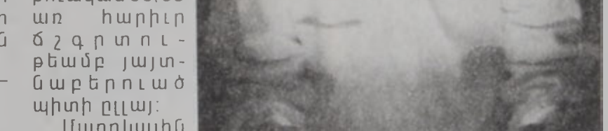
Արեւմտագետ մը Ա. Տէ. Էն. ի յաջորդականութիւնը կ'ուսումնասիրէ ծիւղերու ինքնութիւնը գտնելու համար:

Մարդկային «ծեռնոս»ի ծրագրին բրիտանական հետազոտողները արեւմտագիտական հետազոտողները կ'ըսեն, թէ յառաջիկայ մարտահրաւիրը գտնելն է. թէ մարդկային մարմնին մէջ Ա. Տէ. Էն. ի յաջորդականութեան ո՞ր բաժինները կը ներկայացնեն ծիւղերը եւ անոնց պարտականութիւնը ի՞նչ է: