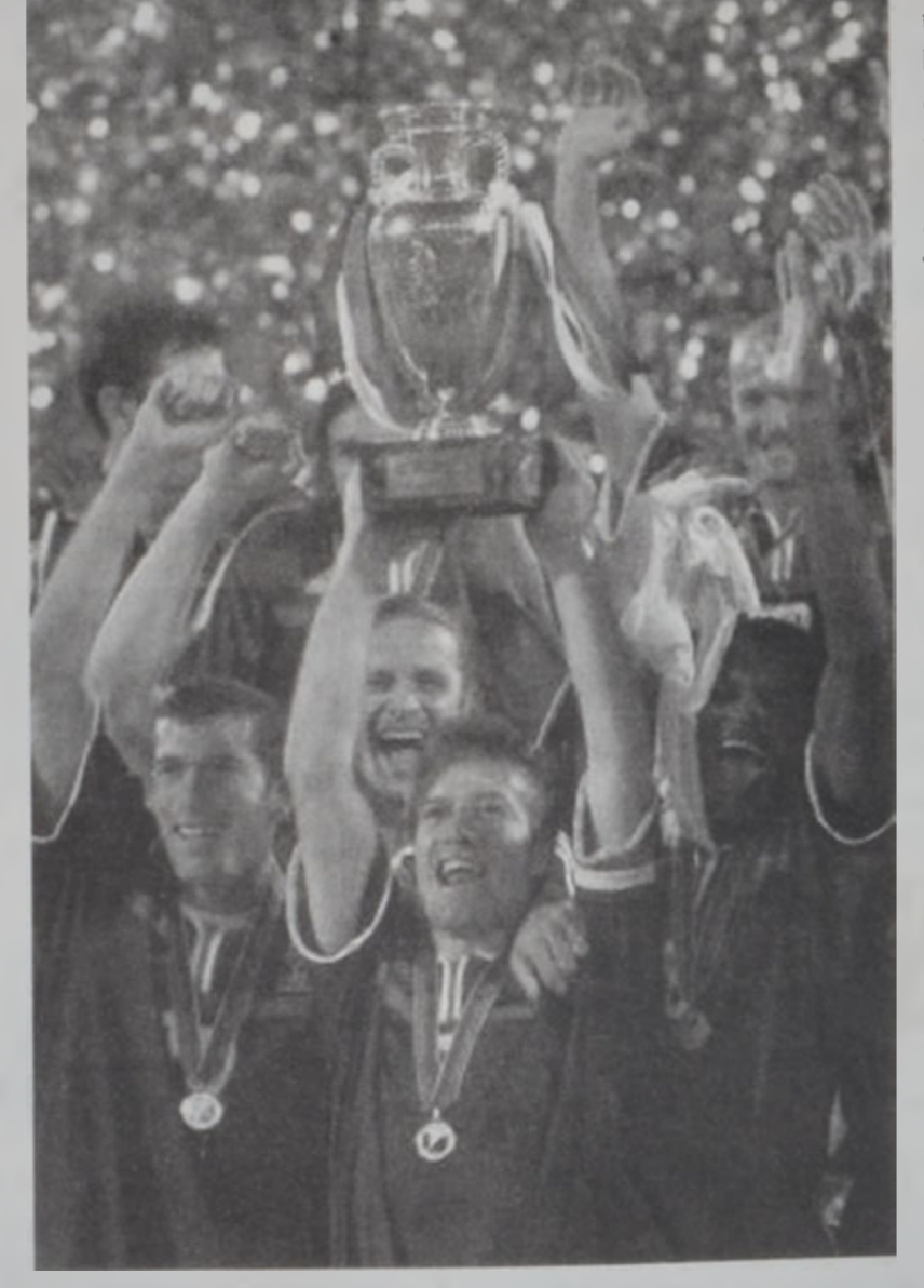
Ֆրանսացիք կը բարձրացնեն բաժակը

Եւրօ - 2000ի աւարտական ճակատումը Ֆրանսայի եւ Իտալիոյ միջեւ տեղի ունեցաւ երէկ գիշեր. Ռոթերտամի (Հոլանտա) մէջ. իտալի հապարհամակիր-