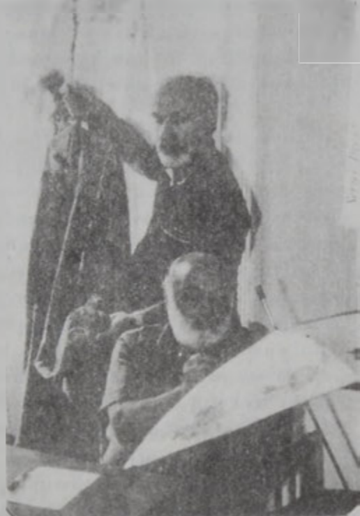
Փարաջանով՝ ստեղծագործական աշխատանքի պահուն:

Այվագովսկին եւ կամ Արամ Խաչատրեանը ուսուսկան մշակույթի ճամբով բացուեցան աշխարհին եւ դարձան միջազգային ճանաչման արժանացած դէմքեր: Կրնաք պատկերացնել, որ Մարտիրոս Սարեանի նման մեծութիւն մը նոր միայն սկսած է գնահատուիլ միջազգային գեղարվեստի վրայ եւ այն ալ ուսուստպարապաշտ գեղանկարչներու ընդմէջէն: