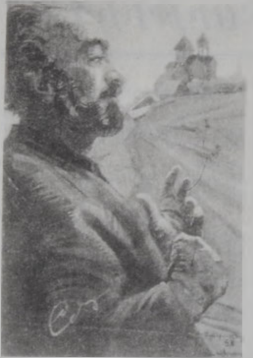
«Սերգէյ Փարաջանովի դիմանկարը», գործ՝ Ստեփան Անդրանիկեան:

Սերգէյ Փարաջանովի միայն մէկ ժապատէնը՝ «Հրեղիւն ձիերը» արժանացած է 16 միջազգային մրցանակներու: Յաջողութիւն մը, որ շատ քիչերու միայն կրնայ վերապահուած ըլլալ: Հակառակ այս բոլորին, ան հայեցողական եւ բանտարկուեցաւ ու նաեւ տնային կայանքի եթեր-կուեցաւ խորհրդային շրջանին: