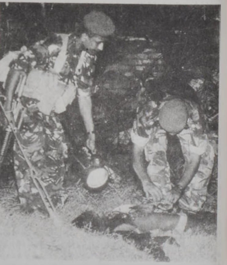
Քոլումպիացի ոստիկաններ «կը քակեն» անձնապաշտպանական արարքի մը դիմողին մարմնին վրայի պայթուցիկ նիւթերը: Ան ձեռքալուծած է նախքան իր գործողութիւնը կատարելը:

Սրի Լանքայի պետութիւնը կը հաստատէ, թէ Պուրման եւ աւելի ուշ՝ Թայլանտը զարմած են գէշներ առեւտուրի կեդրոններ: Քանի մը տարի առաջ Պուրման ռազմական ղեկավարութիւնը փակած է Թ. Ի. Ա. Վ. ի մարզումի կեդրոններէն մէկը, որ Պուրմանի ափերէն հեռու կղզիի մը վրայ կը գտնուէր: Իր կարգին, Փաքէթի թայլանտական կղզիներէն մէկուն վրայ կառուցուող փոքր սուզանաւի մը գրաւումը պատճառ դարձաւ, որ Թայլանտի խաղաղած ղեքը բազայախուի-