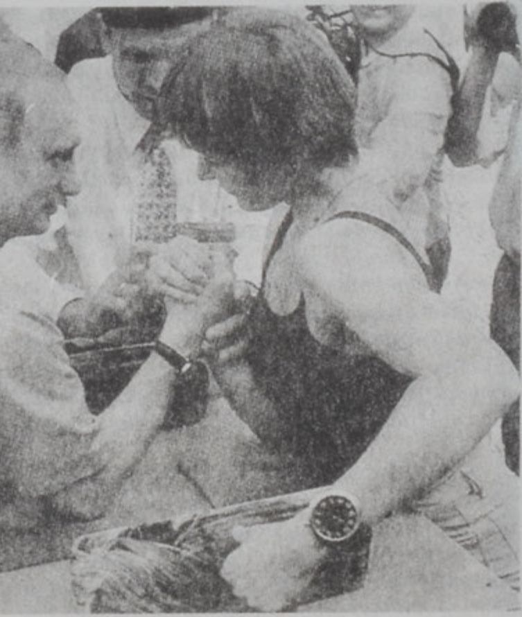
Նախագահ Վլատիմիր Փութին կը մենամարտի Թաթարստանի կիներու յատուկ «քապաշ» մարզախաղի արտաձեւման հետ:

ԱՊՂԶի վեհաժողովին արձարծուած այլ կարեւոր հիւր մըն էր ԱՊՂԶի սահմաններէն ներս միջազգային ահաբեկչութեան հարցը: Նախագահ Փութին դիտել տուաւ, որ հասարակապետութիւնը իր ուժերուն վստահելով կրցած էր կայունութիւն հաստատել իր ամբողջ տարածքին վրայ: Կեկավարները միաձայնութեամբ որ-