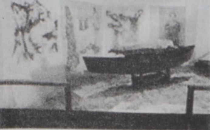
«Հալեպի ձամբան» (1998)

ՖԼՈՐԻՏԱՅԻ ՄԵՋ ՀԱՅ ԱՐՈՒԷՍԱԳԵՏ ՍԸ ԿԸ ՅՈՒՍԱՅ ԻՐ ՏԱՐԱԾԱՍԱՐՔԱՅԻՆ ՅՐԱՅՔՈՎ ՈՒՋԱՂՈՒԹԻՒՆ ՀՐԱԻՐԵԼ ՀԱՅՎԱԿԱՆ ՑԵՆԱՍՊԱՆՈՒԹԵԱՆ ԿՐԱՅ՝ ԻՐ ՉՈՐՑԵՐԸ ՑՈՒՑԱՂԵՐԼՈՎ ՈՂՋԱԿԻՉՈՒՄ ԹԱՆԳԱՐԱՆԻՆ ՄԵՋ: «ՄՈՇԵՒՅԹԸ ՓՐԵՍ ՆԻՈՒՂՈՒԱՅՐԶ» Ի ԹՂԹԱԿԻՑԸ ԿԸ ՍԱՆՐԱՍԱՍԷ