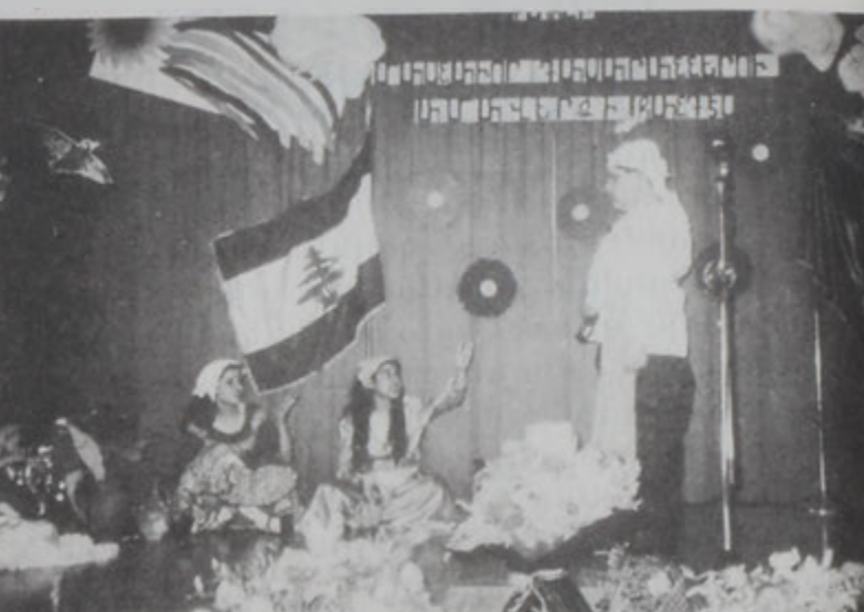
Հանդիսութեան գեղարուեստական յայտագրին տեսարան մը:

1988ին արժանացած է փրոֆետորի կոչման: Ան հեղինակ է 100է աւելի գիտական աշխատութիւններու: Կ. Աղամեան Ռուսիոյ չափազանցական ակադեմիայի ակադեմիկոս է եւ երկու գիտերու հեղինակ է: