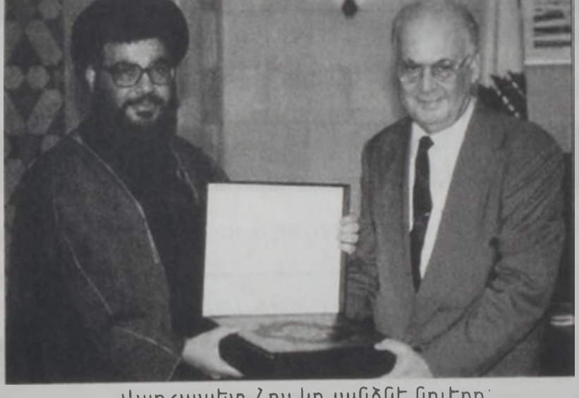
Վարչապետ Հրս կը յանձնէ Տուրքը:

Վարչապետ Սեյիմ Հրսերէկ ընդունեց Հրգայալա-յի ընդհանուր բարոյագործչէն Հասան Նասրալլան: Հանդիպումին ընթացքին Նասրալլայի «Քուրան» օրինակ մը նուիրեց ինչ ետք, Հրս ստատեց, որ Լիբանանի մեծ իրագործումը՝ իսրայէլեան բրունագրաւուէն հայրենի հողին ազատագրումը կը պարտինք զիմադրութեան հերոսական ուժերուն եւ Լիբանանի հպարտ ժողովուրդին անոր շուրջ համախմբուելուն, ազգային միասնութեան հրաշալի մէկ արտայայտութեամբ: