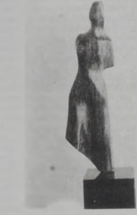
«Շղարշապատ կինը», գործ՝ Նայիմ Տումիթի:

Ինաստեղծական խառնուածքի տէր (ոչ անպայման քնարական) այս քանդակագործը հակամէտ է կերտելու կին կերպարներ, որոնք ոչ միայն մայր են ու էգ, այլ նաեւ կ'արտայայտեն տարբեր