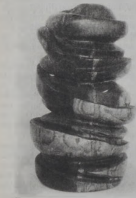
«Ցայտադիր», գործ՝ Սալուա Ռաուտա Շուբէրի

Ի իբրևանի քանդակային արուեստի երէց սերունդի կարկառուն դէմքերէն կը