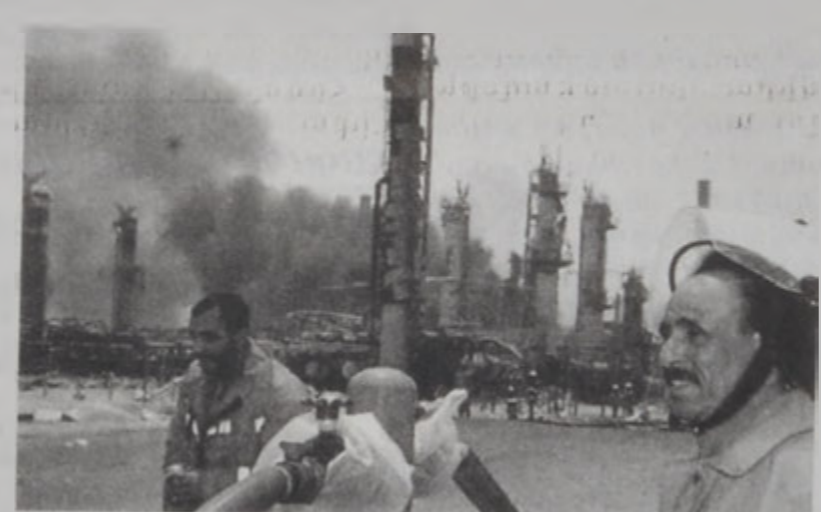
Չտարանը՝ պայտումէն ետք:

ԱՇՄԷՏԻ, 25 (ՌՈՅԹԸՐԸ). - Քուէյթի քարիւղի մեծագոյն գտարանին մէջ գորտեր պայտում մը տեղի ունեցաւ Կիրակի օր, արեւածագին՝ չորս գոհեր եւ 49 փրկարարներ պատճառելով: Քուէյթի քարիւղի պետական ընկերութեան կողմէ հրապարակուած յայտարարութիւնը մը յայտնեց, որ պայտումը խափանարարական արարքի մը արդիւնքն է: Յայտարարութիւնը կ'աւելցրէր, որ կազմի հոսք մը տեղի ունեցած է, պատճառելով պայտումն ու հողեհէր: