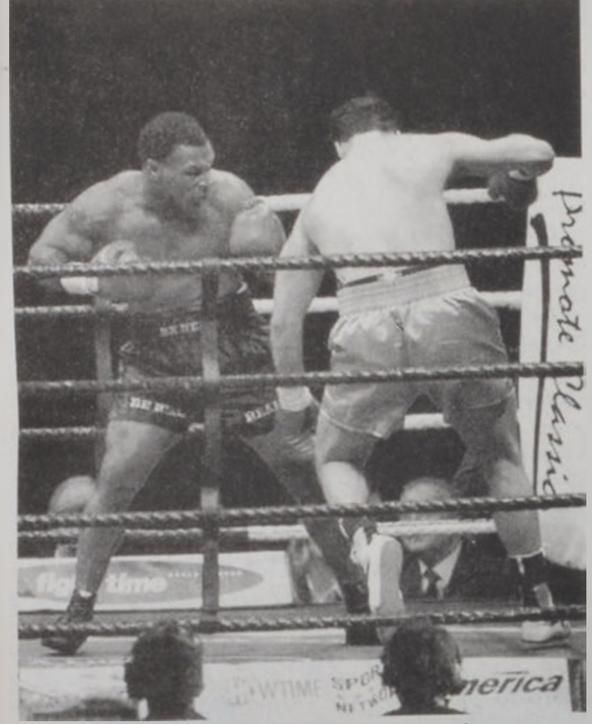
Թայսըն կը պատրաստուի իր «մահացու» հարուածը հասցնել Սաւարեգէի:

- ԹԱՅԱԸՆ ՏԱՊԱԼԵՅ ՍԱԻՐԵԶԷՆ - ԱՐԹԻՒՐ ԳՐԻԳՈՐԵԱՆ ՊԱՆԵՅ ԱՇԽԱՐՀԻ ԱՆՈՅԵԱՆԻ ՏԻՏՂՈՍԸ