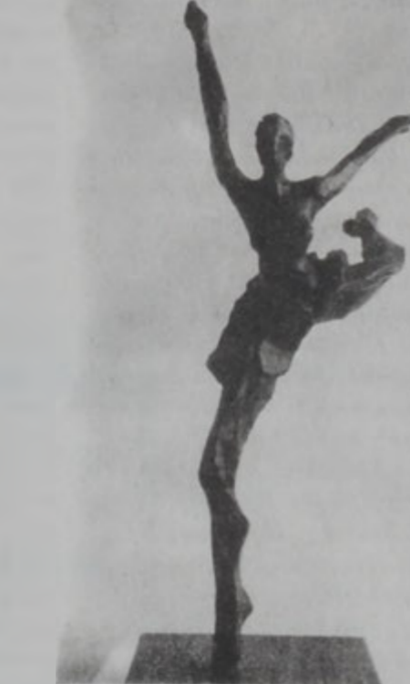
«Պարուհին», գործ՝ Անթուան Պերպէրիի

Նորարարական հակումներով և արտակերտ յղացքներով ստեղծագործական հրապարակի իջնելէ ետք, ան ժամանակի ընթացքին կերտեց քանդակային արուեստ մը, ուր մետաղի թելադրականութիւնը իր արժանի տեղը ունի: «Թաւ-