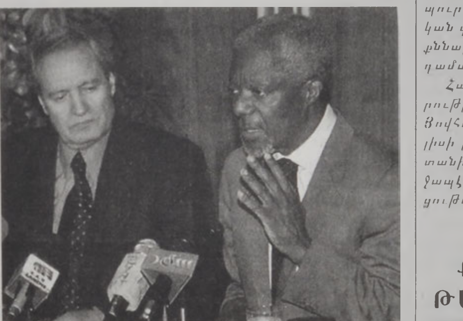
Անան եւ Շարէհ:

Սուրիա երկէ կ'ՄԱԿԻ ընդհանուր քարտուղար Քոֆի Անանի յայտնեց, որ պատերազմ է որեւէ առեւտրային խաղաղութեան բանակցութիւններուն՝ առանց հրաժարելու սակայն կողանք ամբողջութեամբ վերադարձնելու պահանջին: