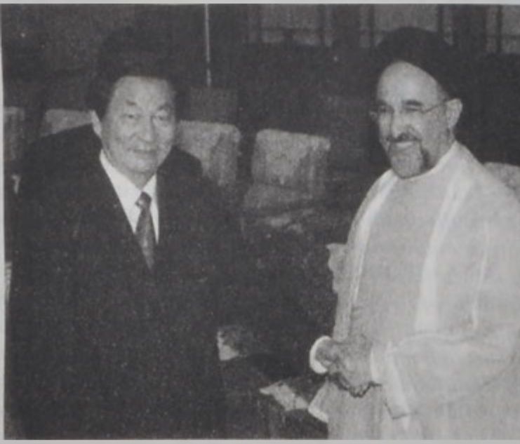
Խաթեմի կը տեսակցի Չինաստանի վարչապետին հետ:

ՊէՅՃԻՆԿ, 23 (ՌՈՅԹԸՐԸ).- Չինաստանի նախագահ Ճիանկ Մեմին եւ Իրանի նախագահ Մոհամէտ խաթեմի խոստացան թափ տարակրկողմանի կապերուն եւ առեւտուրին, ինչպէս նաեւ՝ վերականգնել Մետաքսի ճամբան, որ իրարու կը կապէր երկու քաղաքակրթութիւնները, հաղորդեցին չինական յրատուական պաշտօնական ցանցերը Ուրբաթ օր: