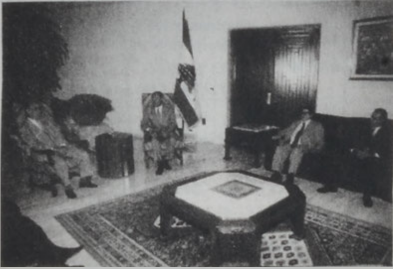
Լահուտ կ'ընդունի Ղովմի Կուսակցությունը պատուիրակությունը:

Նախագահ Գոր. Էմիլ Լահուտ երկ կատարեց, որ Լիբանան այս օրը կ'ընդունի միջազգայնորեն ճանաչված իր սահմաններին ներս ինկող ել իրեն պատկանող հողատարածքի ամբողջությամբ վերատիրանալու փուլին մէջ: «Լիբանան այս մարտահրաշխան կը դիմագրուէ գինուած իր միութեամբ ել իր իրաւունքով, որ բացառապէս մնաց հակառակ կայն հերքելու Խորաշխի ճիգերուն», ըսաւ ան: