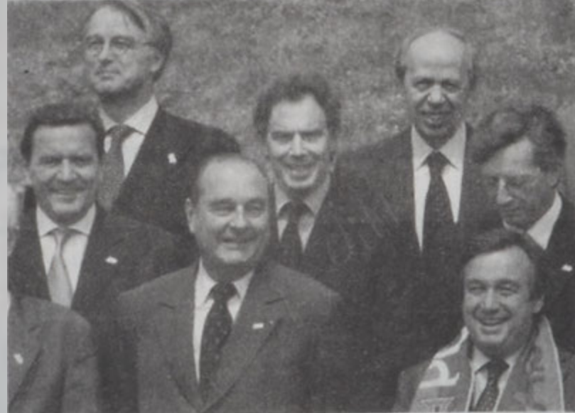
Երոպական Միութեան ղեկավարները՝ յիշատակի Գլխաւոր պահուցի:

Փորթուգալի մէջ կայացած վեհաժողովի մը ակտիւնին, 15 ղեկավարները յայտնեցին, որ Ռուսիոյ հանդէպ ներդրողներու վստահութիւնը կարելի է ձեռք բերել միայն ժողովրդային պայմաններու հիմնարկութիւններով, օրէնքի իշխանութեամբ, շուկայի արեւելումով տնտեսութեամբ մը եւ Անտառի չաւառաւարի միջոցով Կապակերպութեան Ռուսիոյ անդամակցութեամբ: