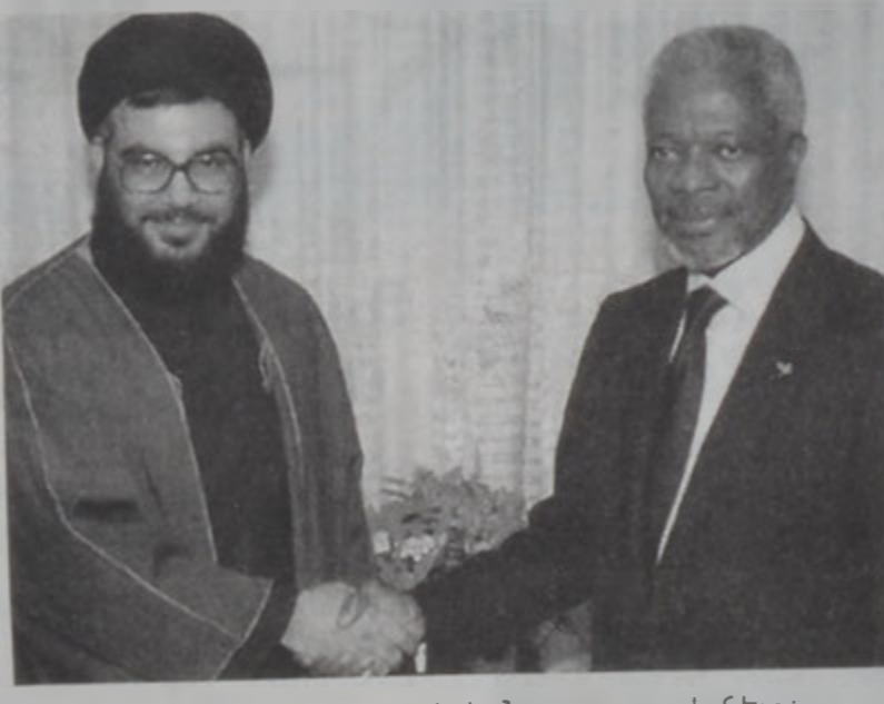
ԱՃԱՆԿ ԿՐ ԿԵՆԱԿԻ ԶԵՅԻՆ ՆԱՐԱՂԱՅԻ ԿԵՆ:

աւարտին կը հասնի արմաճուակն ետք Ֆինիլի տարած աշխատանքը շնորհաւորելով, Անան հաստատեց, որ այդ ուժերու քարոզականը բարձր է եւ հաստատեց թէ մօտ օրէն պիտի աւելնայ անոնց վիճակը: