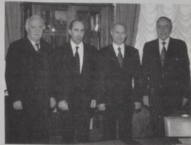
Շեարտնաժէ, Զոչարեան, Փուլթիմ եւ Ալիւ:

Հայաստանի եւ Ազրայէլ յանրապետութեան Ռոպէրթ Քոչարեան եւ Հայրապ Ալիւ, երկէ Մոսկուայի մէջ, Անկախ Պետութիւններու Հասարակապետութեան անդամ երկիրներու ղեկավարներու վեհաժողովին շրջագծին մէջ ունեցան հանդիպում մը, որուն մասնակցեցաւ նաեւ Ռուսիոյ նախագահ Վլադիմիր Փուլթիմ: