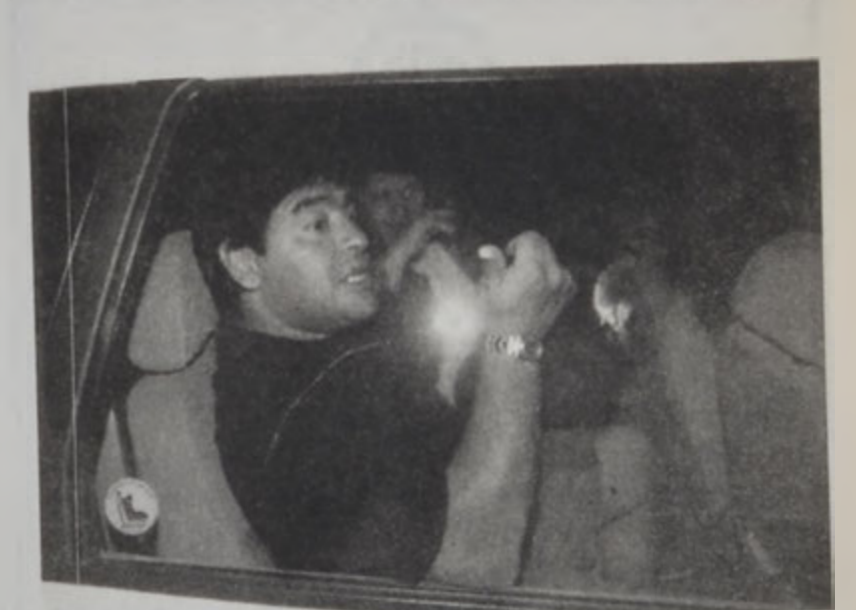
Մարատոնա՝ ինքնաշարժից մէջ

Աշխարհի ֆուտբոլի բոլոր ժամանակներու մեծագոյն աստղերէն՝ արժանթինցի Տիեկո Մարատոնա թէլեֆուտբոլի մէջ յաւանական լուսավորած է եւ հետզհետէ կ'ապաքինի, այսուհանդերձ տակաւին կանուխ է անոր հայրենիք վերադարձը, կը յայտնէ անոր բոլիվը՝ Ալֆրետո Քահէլ: