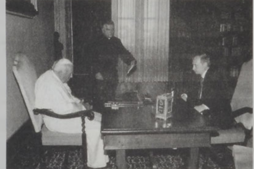
Փութին տեսակցեցաւ պապին հետ, բայց Ռուսիա այցելելու հրաւեր չուղղեց անոր:

Մամլոյ ասուլիսի մը ընթացքին, ան դիտել տուաւ «Եթէ կ'ուզենք բան մը ընել Պալեստինայի կայունացնելու համար, պէտք է վերջ տանք պատժամիջոցներուն եւ Եռակուսակից միջազգային մեկուսացումէ դուրս բերենք»: Փութինի իտալիա այցելութեան առաջին օրուան ընթացքին (Երկուշաբթի), նոյնպէս միջազգային քաղաքականութիւնը կը տիրապետէր: Ան Մոսկուայի մէջ Մ. Նահանգներու նախագահ Պիլ Քլինթոնի հետ վեհաժողովը հազիւ աւարտած ուղղուած էր իտալիա, ուր