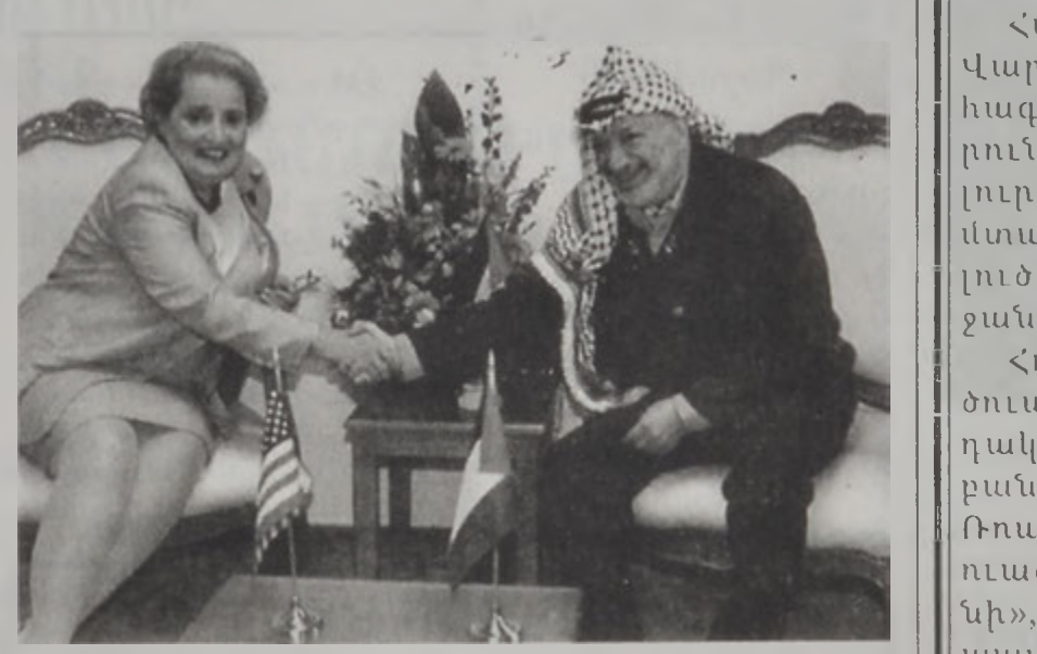
Արաֆատ կ'ընդունի Օլպրայթը իր կեդրոնատեղիին մէջ:

Իսրայէլեան եւ պաղեստինեան պատուիրակութիւնները յառաջիկայ շաբթուան մէջ Ուաշինկթոնի մէջ պիտի վերսկսին բանակցութիւններուն՝ պատրաստելու համար վերջնական համաձայնագրի մը պատկերացումը, յայտնեց Միացեալ Նահանգներու արտաքին գործոց նախարար Մատրիչն Օլպրայթ երկէ: Ան ըսաւ նաեւ, որ պաղեստինեան իշխանութեան նախագահ Եսսկր Արաֆատ Յունիս 14ին Ուաշինկթոնի մէջ տեսակցութիւն պիտի ունենայ նախագահ Պիլ Քլինթոնի հետ: Օլպրայթ կը խօսէր Արաֆատի հետ Ռամալլայի մէջ ունեցած հանդիպումի մը աւարտին: Ամերիկացի Տար. ք. Էջ 10