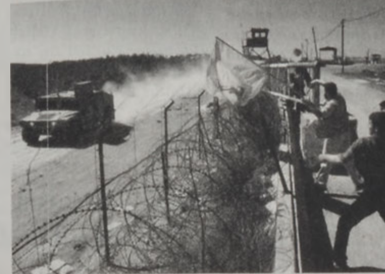
Պաղեստինցիներ կը քարկոծեն իսրայէլեան գրահատար մը:

Իսրայէլեան ձայնասփիւռի կայանը հարտըգ, որ ապահովութեան մարմինները Լիբանանի սահմանամերձ Ատանիք եւ Արամիշ գիւղերը պիտի ուղարկեն փակ գոտի դարձուցած են՝ արգիլելով քաղաքայիններու մուտքը: Կայանը ըսաւ, որ այս որոշումը իրեն պատճառ սահմանարտաքին գործիքներէն սահման գալիս վերջերս պատահած ապահովական խախտումներն են: Լրատու աղբիւրներ երէկ հարտըգեցին, որ Լիբանանի գաղթական-