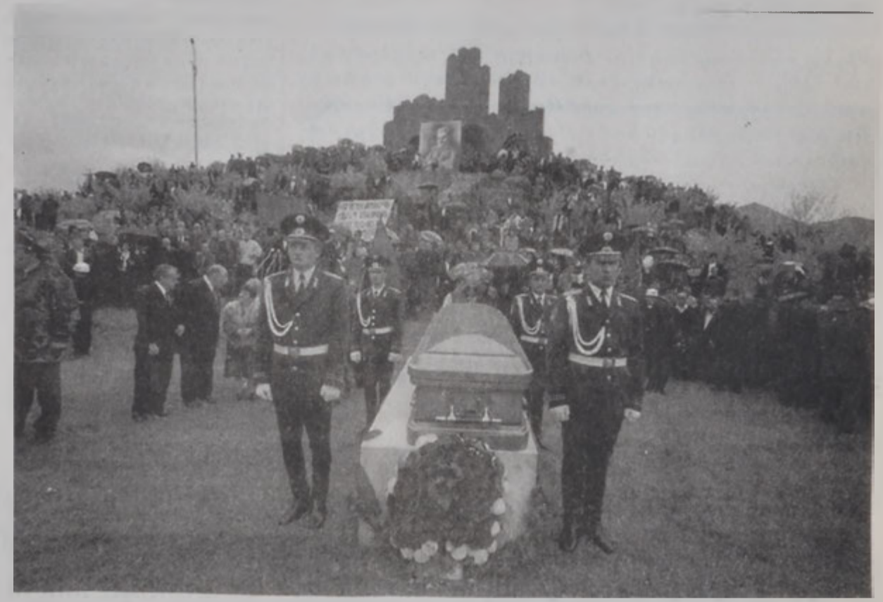
Զօր. Դրօ իր վերջին հանգիստը կ'առնէ հայրենի հողին վրայ:

Ազգային Հերոս Դրաստամատ Կանաչեանի վերատաշարակաւորութիւնը տեղի ունեցաւ Կիրակի 28 Մայիսին, Բաշ Ապարանի յուշարձանին մօտ: Զօրավար Դրոյնի իրենց վերջին հրաժեշտը տալու համար Բաշ Ապարան եկած էին Հայաստանի նախագահ Արմէն խաչատրեան, վարչապետ Անդրանիկ Մարգարեան, Ամենայն Հայոց Կաթողիկոս Գարեգին Բ., Ազգային ժողովի պատգամաւորներ, նախարարներ, պաշտօնատար համար Բաշ Ապարան եկած էին Հայաստանի նախագահ Ռոպէրթ Քոչարեան, Ապարանի Ս. Բագիլիկ