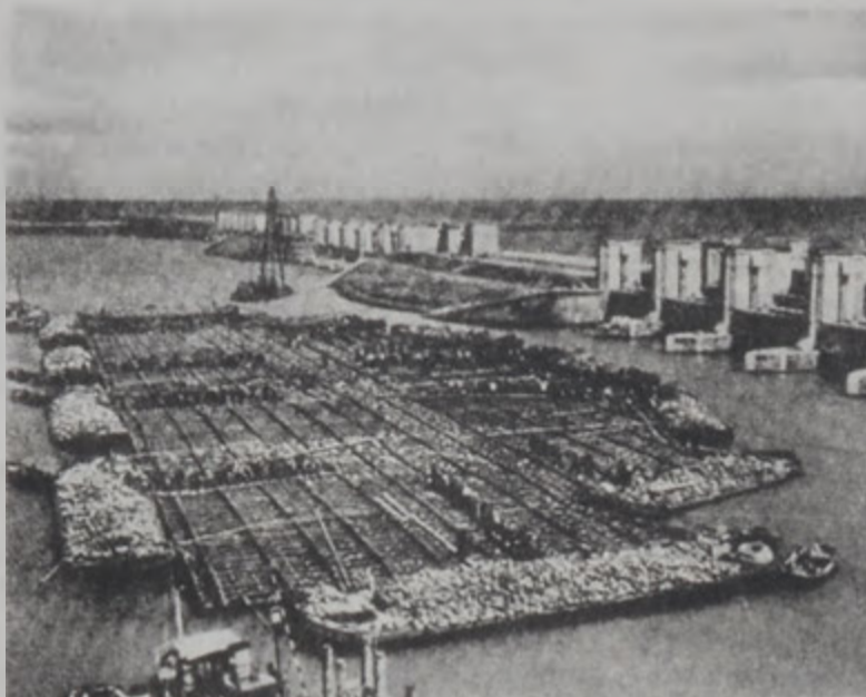
Հուլիսի 21-ին Երևանի քաղաքում կատարվեցին աշխատանքներ...