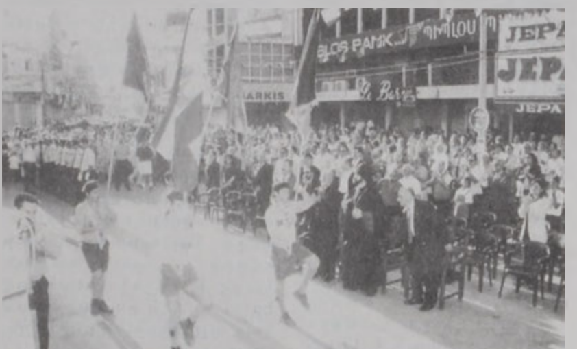
Հ.Մ.Ը.Մ.ի սկառուներու տողացեցը Պ. Համուտի դաշտէն կը հասնի հրապարակ, ուր իրենց կը սպասէր հոծ բազմութիւն մը:

Հայաստանի անկախութեան 82րդ ամեակին առիթով, Կիրակի, 28 Մայիս 2000ին, Պուրճ Համուտի Քաղաքապետարանի հրապարակին վրայ տեղի ունեցաւ Մայիսեան փառատօն, հովանավորութեամբ Մեծի Տանն Կիլիկիոյ Արամ Ա կաթողիկոսի, նախագահութեամբ Լիբանանի հայոց թեմի առաջնորդ Գեղամ եպս. Խաչերեանի եւ կապիտակերպութեամբ Հ.Մ.Ը.Մ.ի Լիբանանի Երջանային Վարչութեան: