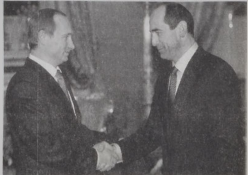
Նախագահներ Փուլթին եւ Զոչարեան:

Հայաստանի եւ Ռուսիոյ յարաբանութեան Ռուսիոյ Քո-չարեան եւ Վլադիմիր Փուլթին երկ Միւսքի մէջ ընդ-հանրակաւ ապահովութեան խորհուրդի նիստին շրջա-ցին մէջ ընեցան հանդիպում մը: