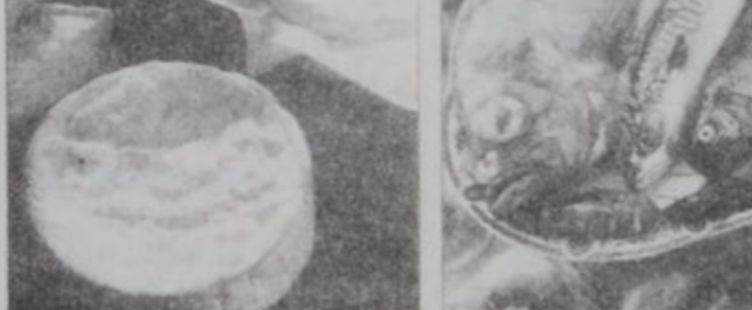
Հում ձուկէն ու կարգ մը պանիրներու պատեանէն հրածարիլ

Վերոյիշեալ բոլոր անձերը, որոնք բաւարար պաշտպան