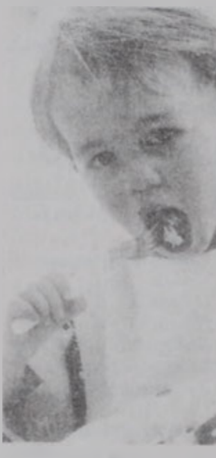
Մանուկները առաջին վտանգուածները

Լիսթերիոզը վտանգաւոր հիւանդութիւն մը չի անտեսելով հանդերձ կրնայ մահացու դառնալ ժամանակին չղարմանելու պարագային: Այս հիւանդութեան մասին մարդիկ բաւարար տեղեկութիւններ չունեն մինչդեռ անկիւ կրնայ մեծ վնաս պատճառել յղի կիներուն, երեխաներուն և տարեցներուն: Այս հիւանդութենէ կը վարակուին ուտելիքներու ճամբով, նաեւ մաքրութեան կարգ մը տարրական կանոնները չարգելու պարագային: