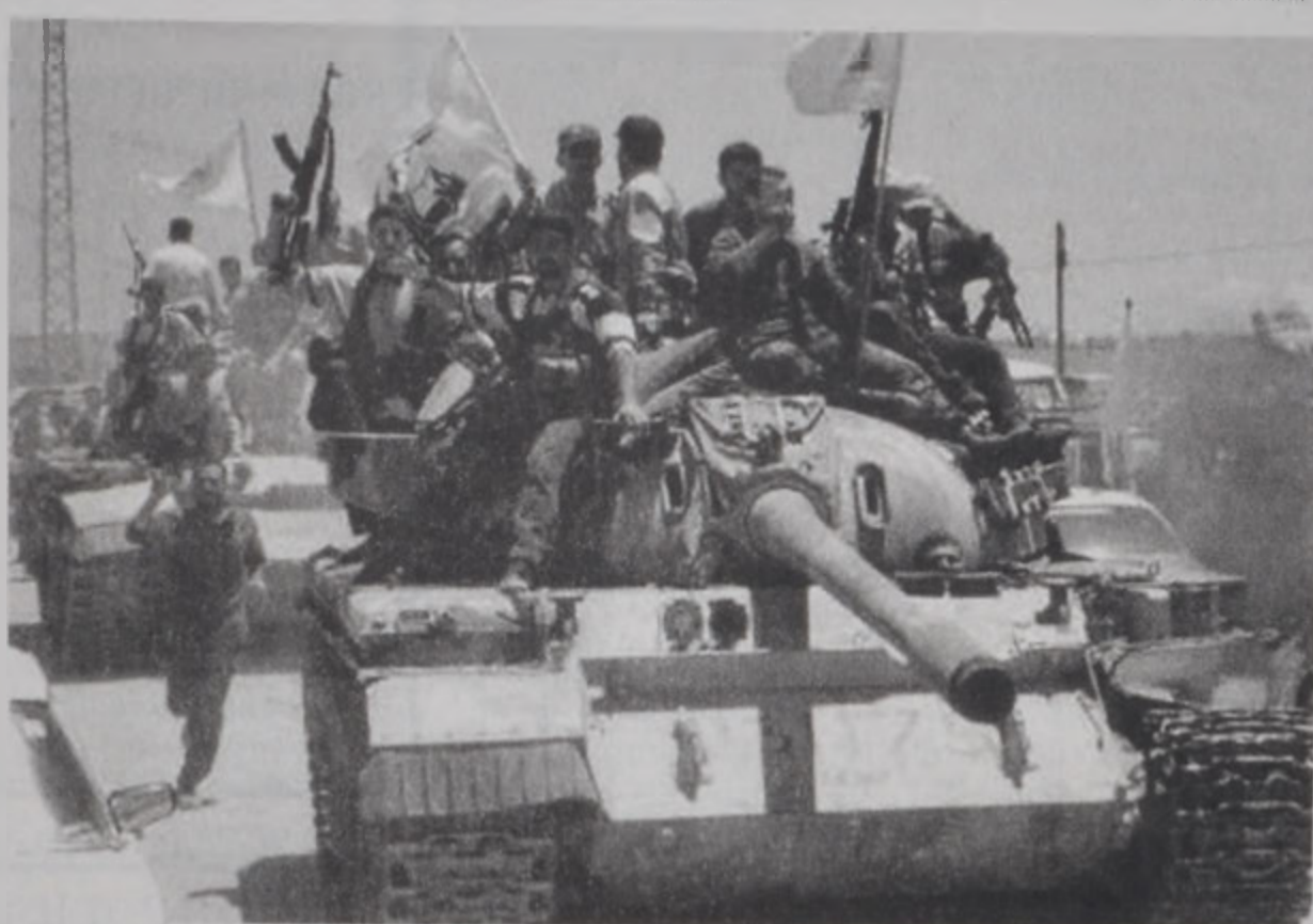
ԲՖար Բիլայի մէջ Հըզպալլայի անդամներ կը շրջագային Հ. Լ. Բանակի լքուած հրասայլով մը:

Հարաւ երկ ապրե-ցաւ նաեւ խաղաղ օր մը: Ապստամբութեան աղբիւրներ յայտնե-ցին, որ շրջանին մէջ տիրած է անհարմար-րայց հանդարտութիւն, ոչ մէկ գործողութիւն կատարուած է իսրայել-եան ուժերու դէմ, ոչ ալ