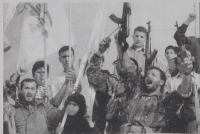
Ուրախութիւն եւ գոհունակութիւն:

Երեքշաբթի օր, նոյն եր-կիրներու, բացի Հայաս-տանից, Տար. 19 Էջ 10