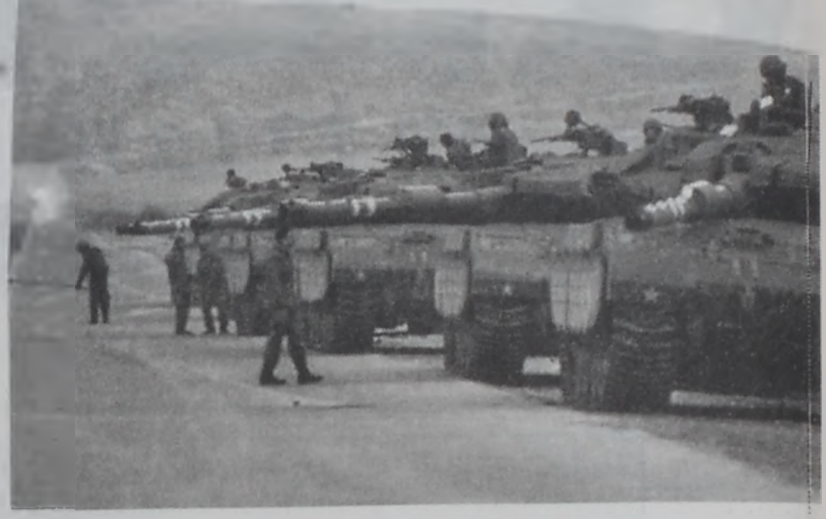
Իսրայէլեան հրասայլեր կը գրաւեն ճոր դիրքեր սահմանին միւս կողմը:

Սակայն ինչ որ սակայն յայտնեց, որ լիբանանեան բանակի ուժերուն վրայ պատահած են երկու դէպքեր, որոնք ցոյց կու տան Իսրայէլի վերաբերումը լաիտեան պահուստներուն նկատմամբ: Առաջին դէպքը պատահեցաւ սահմանին վրայ, երբ իսրայէլեան բանակը արգիւյն Իսրայէլ մուտք լաիտեան ուժերուն եւ անոնց ընտանիքներուն մէկ կարասանին: Լաիտեան ուժերը ընդվզած կրակ բացին իսրայէլեան անցարգէլին վրայ: Տեղի ունեցաւ պիստակ բարձր, որուն հետեւանքով սպանուեցան լաիտեան երկու պահուստներ եւ կին մը: Կր պատահեցաւ իսրայէլեան լաիտեան ուժերուն հրահանգ կու գայ իրենց բեռնակառքերէն վար առնել լաիտեան պահուստները եւ շարժուել անոնց, որ Իսրայէլ մուտք գործեն: