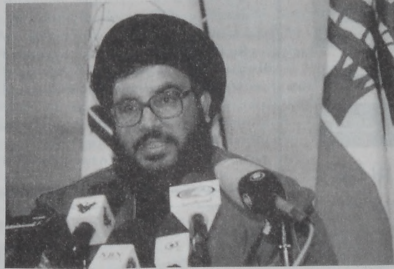
Շէյխ Նարալա մամլոյ ատուլիսի պահուն:

Լիբանանեան բանակի հրամանատար Էթան տեղեկատուական բաժանմունքը հաղորդագրութեամբ քննարկեց պատարձակումը 2000 թ. Լիբանանի Լիբանանի մէջ գտնուող իր ուժերուն երէք-չորրորդ արդէն հեռացած ու վերադարձած է Բարայէ: