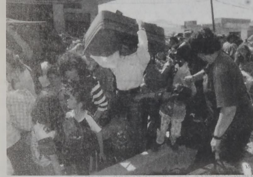
Հարաւային Լիբանանի բնակիչներ կը փորձեն խոյս տալ դէպի Իսրայէլ:

Մնացեալ տեղեկատուական բաժանմունքը հաղորդագրութեամբ քննարկեց պատարձակումը 2000 թ. Լիբանանի Լիբանանի մէջ գտնուող իր ուժերուն երէք-չորրորդ արդէն հեռացած ու վերադարձած է Բարայէ: