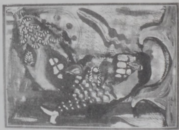
Նմուշ մը՝ Նանոր Թաշեանի գործերէն:

Կիրարկելով յայտնի գեղանկարիչ Վարդան Թաշեանի դուտորը՝ Նանոր, ամուսնացած ըլլելով կը մտնէ գեղանկարչական ասպարէզ: Ան ար- դէն իսկ Նիկոսիոյ մէջ կազմակերպած է 3 ան- կանական ցուցանակներ եւ մասնակցած քանի մը իմբատի միջոցով ցուցանակներու: Մեծ է 1974-ին, Նիկոսիոյ, ուր ընդունուած է 1996-ին աւարտած է Կրաֆիք Արք Էնա Տիգրայի գեղար- ւեստից կիմնարկը: