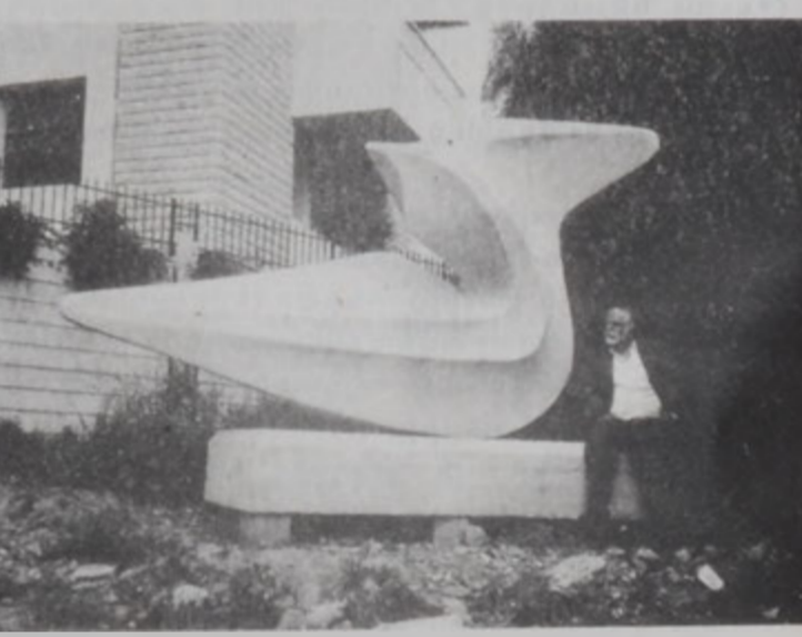
«Ասթարթ» դիցուհին թռիչքէն առաջ (լայնք՝ 440 սմ.)

Պ.- Անկասկած: Յոյսս ունի հիմնաւոր պատճառներ: Նախ՝ Լիբանանի մեծագոյն ստեղծագործութիւնը պիտի ըլլայ, իսկ երկ- րորդ՝ բաղդատմամբ Եւրոպայի (չնորհիւ իմ յայտնաբերած արձեւտագիտութեան), պի- տի արժէ հագիւ մէկ տասներորդ գիւնը: Այն-