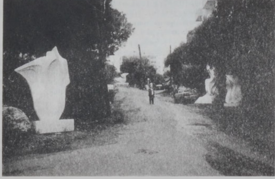
Պելլիի 65րդ փողոցը, ուր Զաւէն Խտըշեան սկսած է քանդակագործել:

Եւ մտայն ինչո՞ւ մեր փողոցը իսկապէս արժանանալով իննուկէ՞ կը փորձվի: Պ.- Հաւանաբար գարմա-նաք, եթէ ըսեմ, թէ այս հար-ցումին պատասխանը չու-նէի, քանի մը ամիս առաջ: Նոյն հարցը ես ինչի կու տա-լի եւ իսկապէս չէի գիտեր, թէ ինչն էր գիտ մտողը այս արկածախնդրու թեան: