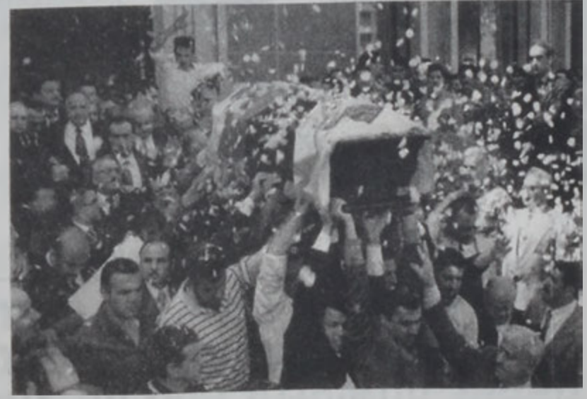
Էտտէի դագաղը ուսամբարձ կը փոխադրուի:

Լիբանան երէկ հրա- ժեշտ տուա Ռէմուն Էտ- տէի: Արարողութիւնը տեղի ունեցաւ Պէյրու- թի Մար ժըրմու Կէ- ղեցոյ մէջ. հանդիսա- պետութեամբ Նաւարայ- լա Սֆէյր պատրիար- քին: