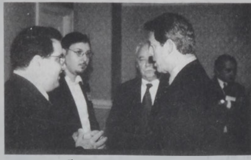
Հանդիպումն տեսարան մը

Պատուիրակութիւնը նաեւ շնորհակալութիւն յայտնեց փոխ նախագահին՝ Հայաստանի տնտեսական զարգացման մէջ իր տարած աշխատանքին համար: