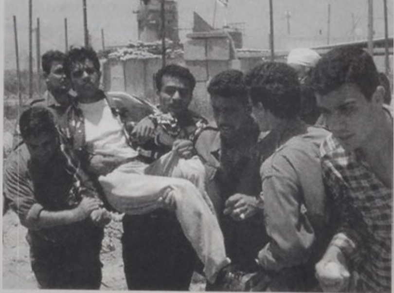
Վիրաւոր պաղեստինցի մը օժանդակութիւն կը ստանայ:

Իսրայելեան ուժերուն եւ պաղեստինցի բանտարկեալներուն ապստարակուած պահանջող արաբ ցուցարարներուն միջե բախումները շարունակուեցան շաբաթավերջին, Այսրյորդանանի եւ Կապալի մէջ: