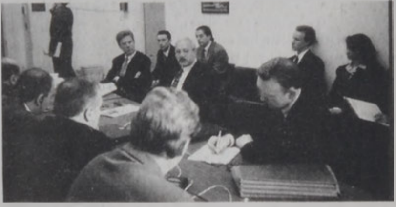
Հայրենի պատուիրակութեան հետ հանդիպումն տեսարան մը