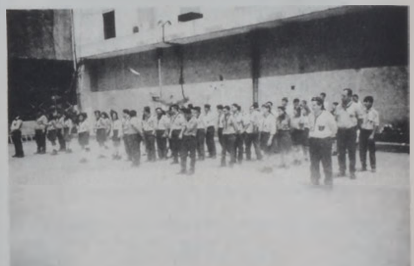
Մրցումին մասնակիցները հաւաքի պահուն

Գիրակի, 7 Մայիսի առաւօտեան ժամը 9:30-ը 11:30 տեղի ունեցաւ Հ.Մ.Ը.Մ. Ի երկրագործական հիմնարկի գարգաման մրցում մը, Ազգային Լեւոն եւ Սոֆիա Յակոբեան վարժարանի սրահին մէջ, կազմակերպութեամբ Հ.Մ.Ը.Մ. Ի Երջանային խմբագրութեան: