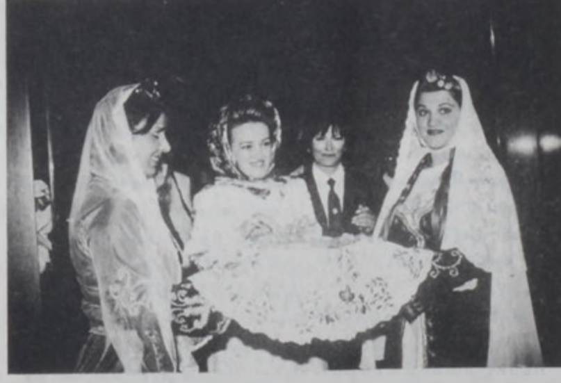
Ռ. Պրորի կը դիմաւորուի աղ ու հացով: