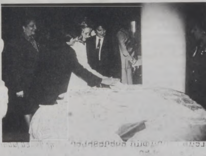
Ուրֆայի ձեռագործներու մասին բացատրութիւն