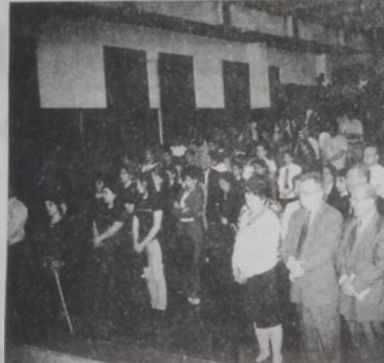
Ներկաները քայլերգի պահունք

խօսելով ինքնուրուի պահանջներու հարցին մասին՝ ան ընդգծեց, թէ հասարակ համալսարանացուցումը երեւոյթներ, հայերը կրցած են պահել իրենց ինքնությունը: Իր խօսքին աւելուած լեզուաբանական արտահայտութեամբ: «Ինչպէս եկեղեցին կ'ընդունի իր մեղքերը եւ անոր համար