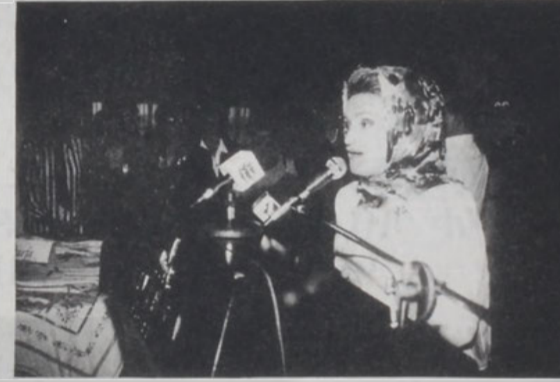
Ռանտա Պրորի՝ խօսքի պահուն