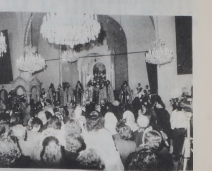
Հոգևոր երեք պետերու միացեալ արարողութեան տեսարան մը:

Անոնք կ'ըսեցին օգնութեան ձեռք երկարելու կարիքաւորներուն, սէր եւ խղճութիւն տարածելու, տեղեկութեան հետ մնալու եւ նո-