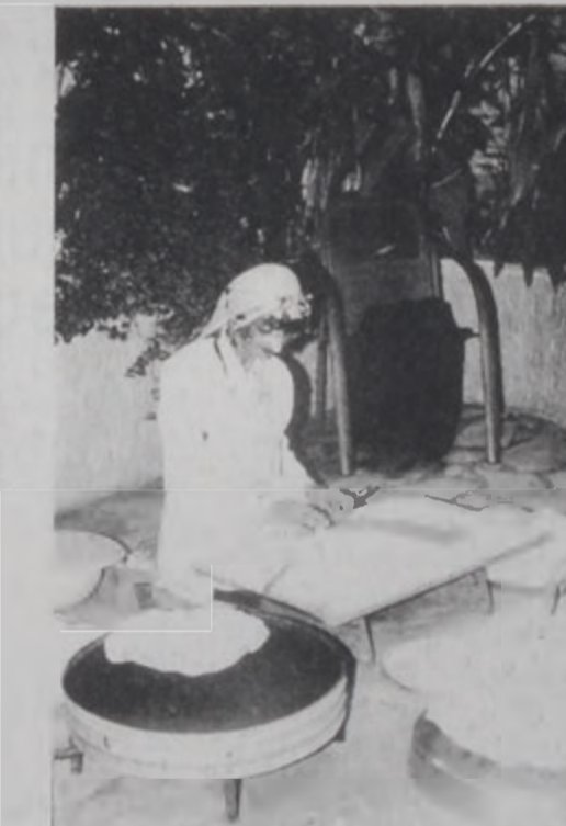
Հայ մամիկը լաւաշ հաց կը թխէ

Հայկական եւ արարական մշակոյթին միջեւ համեմատութիւն մը կատարելով՝ ան ըսաւ, թէ հայ կիններուն ձեռքերը պէտք է օրհնուին իրենց ստեղծած հրաշալի ու ներդրանքները: Ան ներդրանք կը յաւանդուի պայքարի եւ կան մշակոյթի արմատները: Իր խօսքի աւարտին Ռ. Պրորի յոյս յայտնեց, որ համագործակցութեան կապ մը կը ստեղծուի հայ եւ արար մշակութային միութիւններուն միջեւ, նշելով այն իրողութիւնը, որ Լիբանանը նաեւ հայութեան հայրենիքն է: