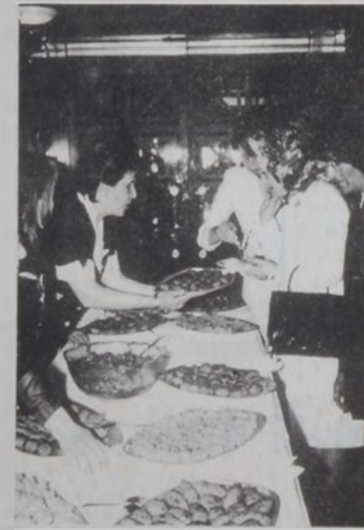
Ռ. Պրորի կը համտեստ հայկական ձաշերը