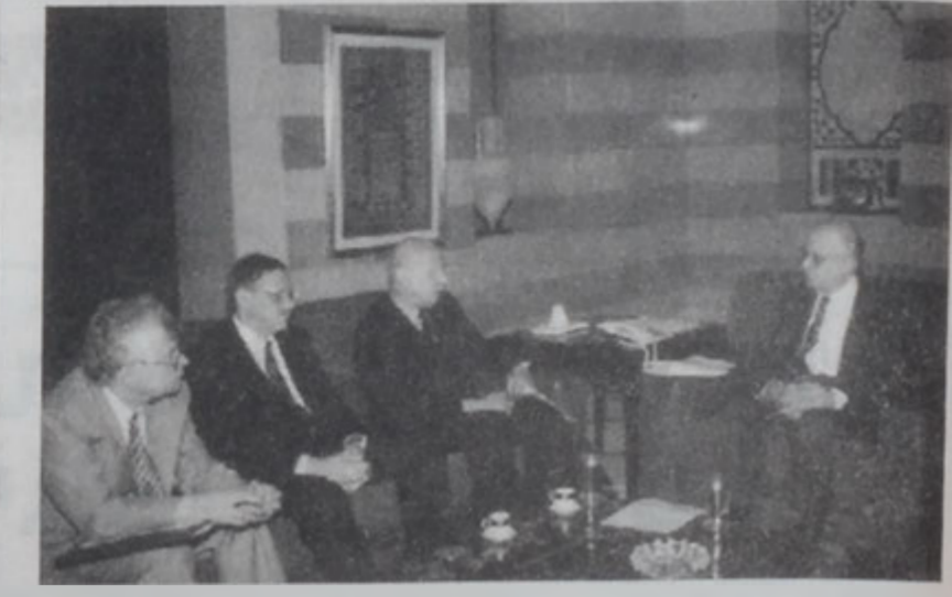
Սուլթանով վարչապետ Հըսի մօտ:

Վարչապետ Սեյիմ Հրա երկվ վերահաստատեց, որ Լիբանան իր իրաւունքներէն ոչինչ պիտի պիլի, եւ կարելի ըլլալ միջոցներուն պիտի գիտնէ անոնց վերատիրանալու համար: