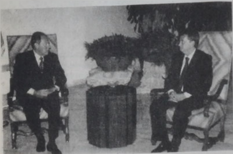
Նախագահ Լահուտ կ'ընդունի Կեդրոնական Դրամատան կառավարիչը:

Հանրապետության նախագահ Գոր. Էմիլ Լահուտ երկվ իր այցելուներուն հաւատարմեց, որ պիտի գործածէ իր սահմանադրական լիազօրութիւնները՝ մերժելով ստորագրել երեսփոխանական ընտրութիւններուն «խնդրած քայլով» քուէարկելու իրաւունք տուող օրէնքը, եւ գայն պիտի վերադարձնէ խորհրդարան, որպէսզի վերատեսուեան ենթարկուի, նկատի ունենալով որ անիկա անդրադարձնել կ'ունենայ ընտրական գործընթացի պարկեշտութեան վրայ եւ առիթ կու տայ ընտրութիւն մեկնարանութիւններուն: