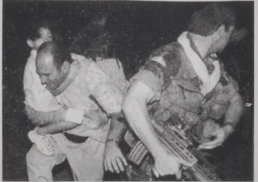
Բրիտանացի մը եւ իր դուստրը կը հեռանան Ֆրիթանուէն:

Սիերրա Լեոնէի ըմբոստ դեկավար Ֆոտայ Սանքոն, որուն գլխաւորները մարտատանուած են ՄԱԿԻ խաղաղարար ուժերու 500 անդամ պատանդ ընտել ըլլալով, երկէ կը կրկնուին պաշտպանութեան ներքեւ կը գտնուէր՝ անոր մարտակից մէկ հատուածին կողմէ յարձակումէ մը եւ անոր տան գրաւումէն ետք: