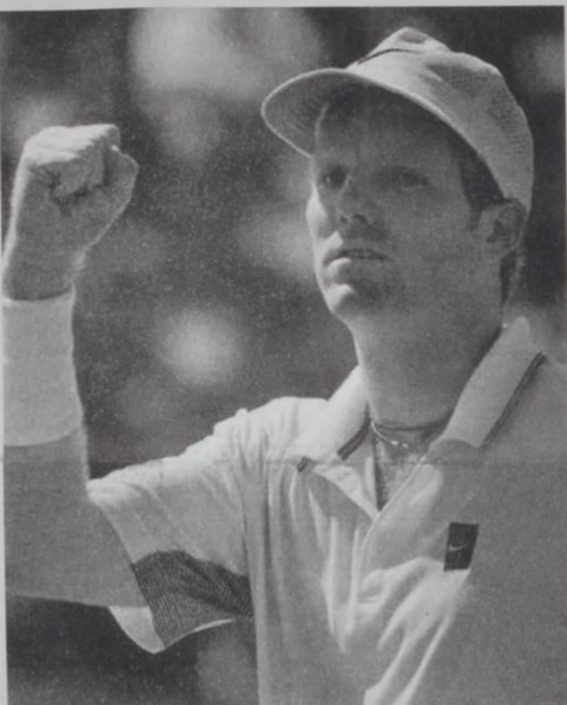
Զուրիք՝ յաղթական կը մեկնի դաշտէն:

Թեղրանի աշխարհին մեջ մեծ հռչակ վայելած ամերիկացի ձիւմ ֆուտբոլ երկկ պաշտօնագէտ յայտարարեց, որ կը քաշուի ասպարէզէն: Ան 1997ին ի վեր կը տառապի կունակի ցաւէ, բայց կը յուսար լաւանայ եւ շարունակելու յայտնապէս ան այս իմաստով ի վերջոյ յուսահատեցաւ եւ դիմեց տունեայ որոշումին: