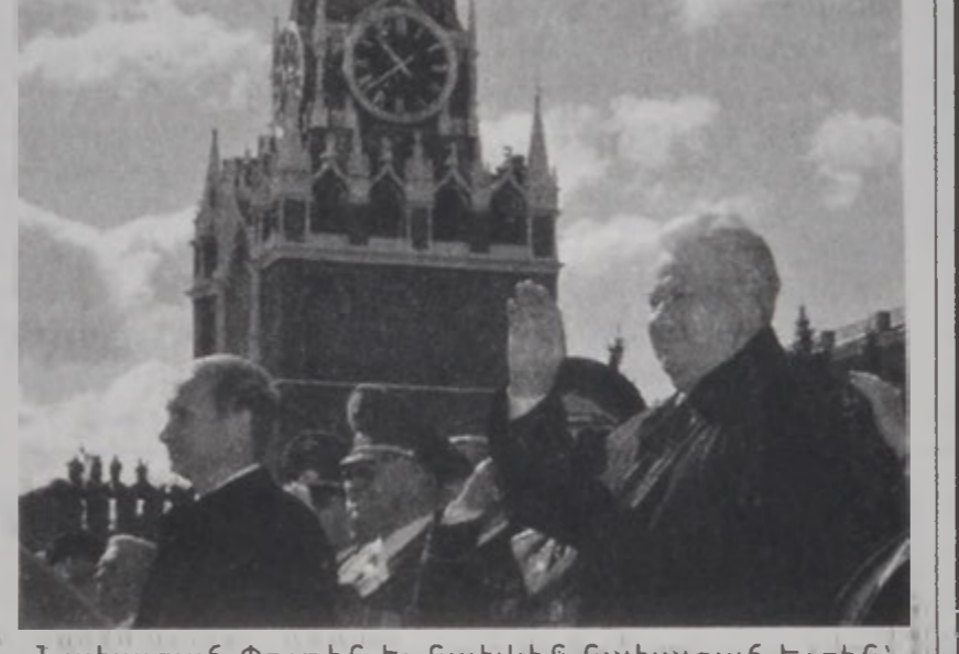
Նախագահ Փութին եւ Գախիկն Գախազար Ելցին՝ Մոսկուայի Կարմիր Հրապարակին վրայ:

Հալարարու համայնավարներ Յաղթանակի Օրուան առիթով Մոսկուայի գլխաւոր փողոցէն քալելով դատապարտեցին ազգին աղքատութիւնը եւ ցած կենսամակարդակը: