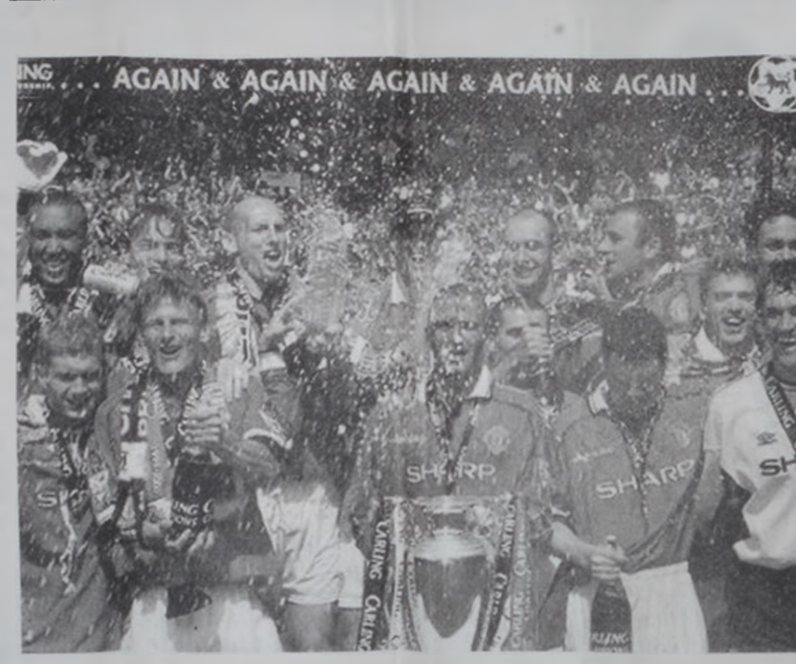
Մանչեսթըր Եւնայթըտ, որ անցեալ Կիրակի օր բարձրացուց ախոյեանութեան բաժակը, մրցումին աւարտին «Օլտ Թրեֆորտ»-ի մէջ տունէն իր իրաւորումը: Անոր տղաքը նշեցին իրենց փառքը: Նկարին մէջ ակներեւ է անոնց «Ղոգանք»ը շաւիտիով, ինչպէս նաեւ՝ մարկիներուն ձեռքերուն մէջ ֆրանսական ընտիր հեղուկին շիշերը...